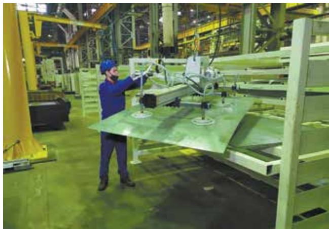
Манипулятору под силу поднять почти полтонны

Новое оборудование было смонтировано за неделю. Сейчас идёт его освоение.