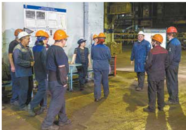
Каждодневное обсуждение вопросов качества позволяет достичь целевых показателей