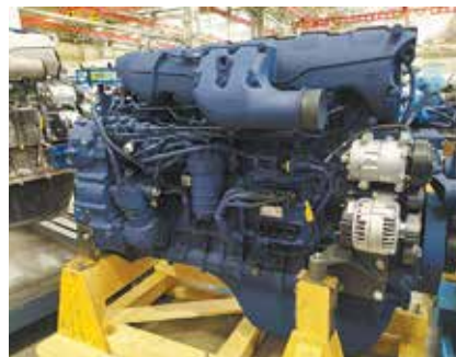
Обновлённый двигатель форсирован до 550 л.с.

успешно прошла обкатку и приёмодаточные испытания. Запуск в серийное производство планируется в начале 2021 года.