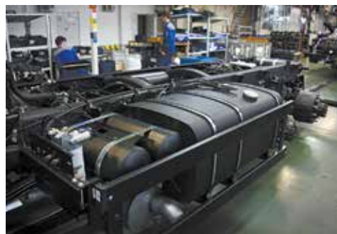
Бак модели 53215 отлично вписался в конструкцию автомобиля

Фарита Гимадиева, другие задачи и оформление — на инженера-технолога Азата Гизатуллина.