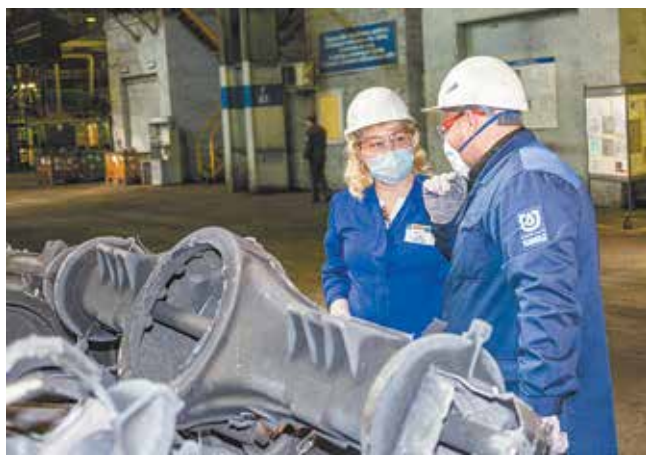
Всё, что не прошло визуальный контроль, обрубщики транспортируют в изолятор брака

— Чтобы достичь целевых показателей в области качества, мы работаем по принципу «3 НЕ»: не принимаем, не делаем, не передаём брак. Каждый день проводим совещания у бригадного информационного стенда (БИЦ), на которых рассматриваем проблемы качества. И то, что наш участок по показателям стал лучшим, — результат ежедневных шагов к достижению цели. Каждодневное обсуждение вопросов качества с персоналом выливается в