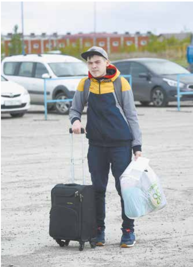
Родительских дней в этом сезоне не будет, поэтому экипируйте детей как следует

Как и в предыдущие годы, обеспечение безопасности детей берёт на себя ФГУП «Охрана» Росгвардии.