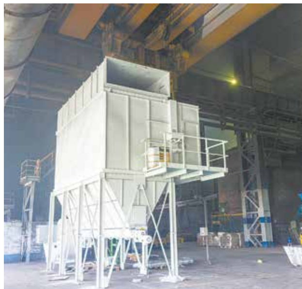
В производстве чугунного литья начался монтаж вентиляционной установки

Воздух на производстве чугунного литья станет чище. Рядом с плавильным комплексом идёт монтаж вентиляционной установки немецкой фирмы GARANT-Filter. Она предназначена для очистки отходящих от плавильной печи газов и от пыли.