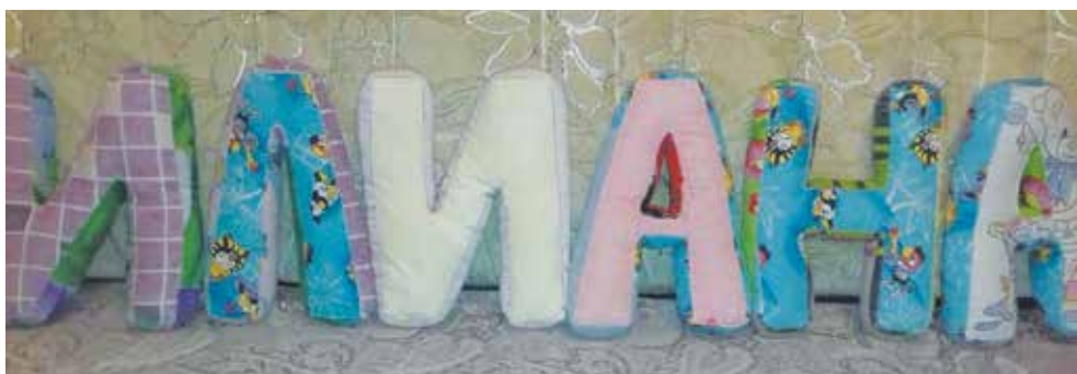
Учиться надо играючи, знает бабушка маленькой Илианы

У раскройщицы Ильсияр Мирсаитовой трёхлетняя внучка постигает азбуку, играя. Бабушка сшила для неё объёмные буквы, заполненные синтепоном. Букв всего шесть, но ей вполне достаточно: из них можно сложить имя малышки — Илиана.