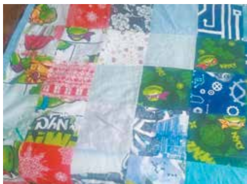
Техника лоскутного шитья требует много терпения

«Моя мама шила на ней абсолютно всё: от детских пальто до кухонных прихваток. Мне всегда хотелось научиться так же, и вот уже 36 лет я в профессии», — рассказывает она.