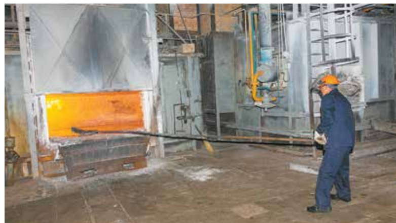
Плавить металл — настоящее мужское занятие

считает своими призваниями: «Приятно наблюдать за ростом учеников: как правило, молодёжь приходит со 2-м разрядом, а потом постепенно обучается, сдаёт на 3-й, 4-й и выше. Главное в нашем деле — любовь к своей профессии. Да, эта работа физически тяжёлая, но именно такую называют мужской — создавать что-то своими руками. Это невероятное чувство, когда выплавленный тобой металл на глазах становится деталью к автомобилю». Слава же на всю страну его не слишком волнует: «Я на литейном заводе уже давно на Доске почёта, мне не привыкать», — улыбается он.