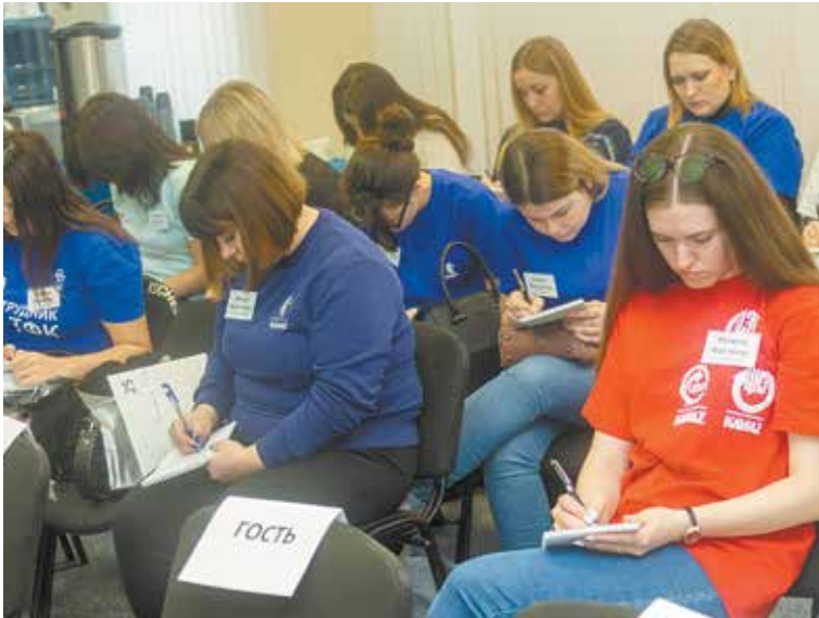
Февральский корпоративный чемпионат «КАМАЗа» по рекрутингу показал, какие опытные эйчары работают в компании

Рейтинг лучших рекрутеров компании будет озвучен в конце года.