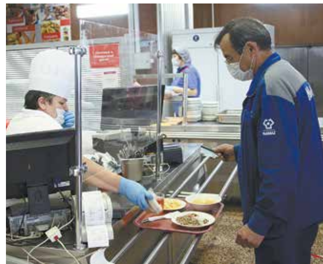
Такой защитный экран установлен на заводе двигателей