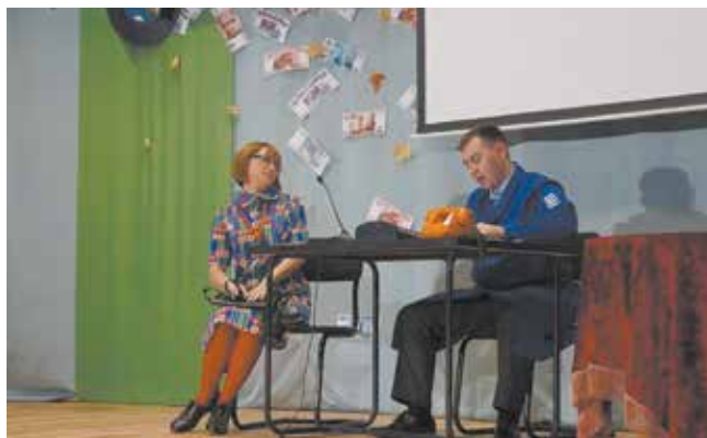
Фестиваль открывает путь на сцену

Таланты участников смогут оценить и их коллеги. Лучшие номера с согласия авторов будут размещены в социальных сетях.