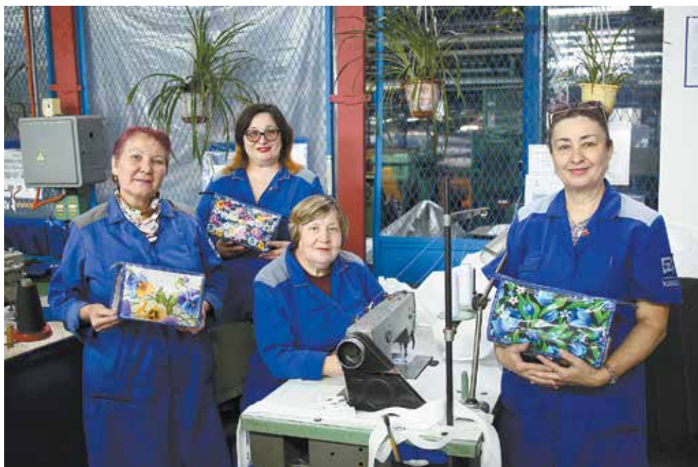
«Чайные» сумочки в руках у работниц швейного участка помогают блюсти порядок в бытовом помещении

В бытовке швейного участка — чистота и порядок. Чайные принадлежности работников убраны в сумочки на молнии — дело рук хозяек помещения. Сумки из хлопчатобумажной ткани и плотного полиэтилена прекрасно служат в качестве средства для хранения и выглядят эстетично, придавая месту отдыха почти домашний уют. Но это то, что на виду. А чем ещё могут похвастаться рукодельницы?