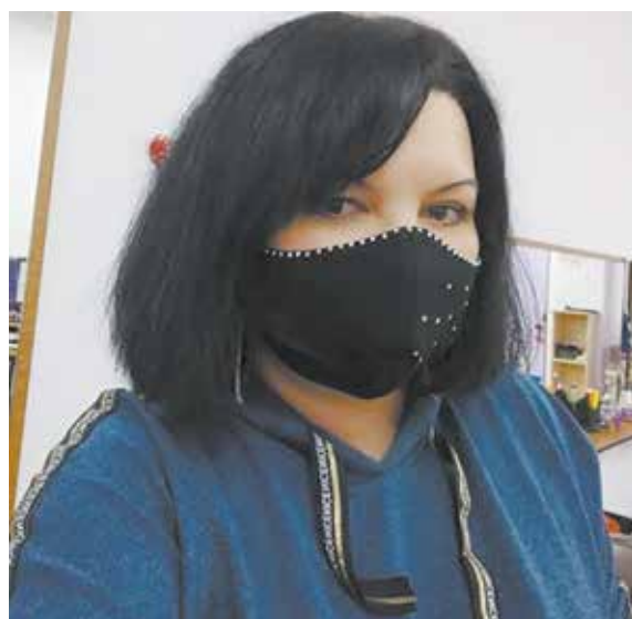
Известные модельеры сравнивают маску с вуалью — и то, и другое придаёт дамам загадочности и шика