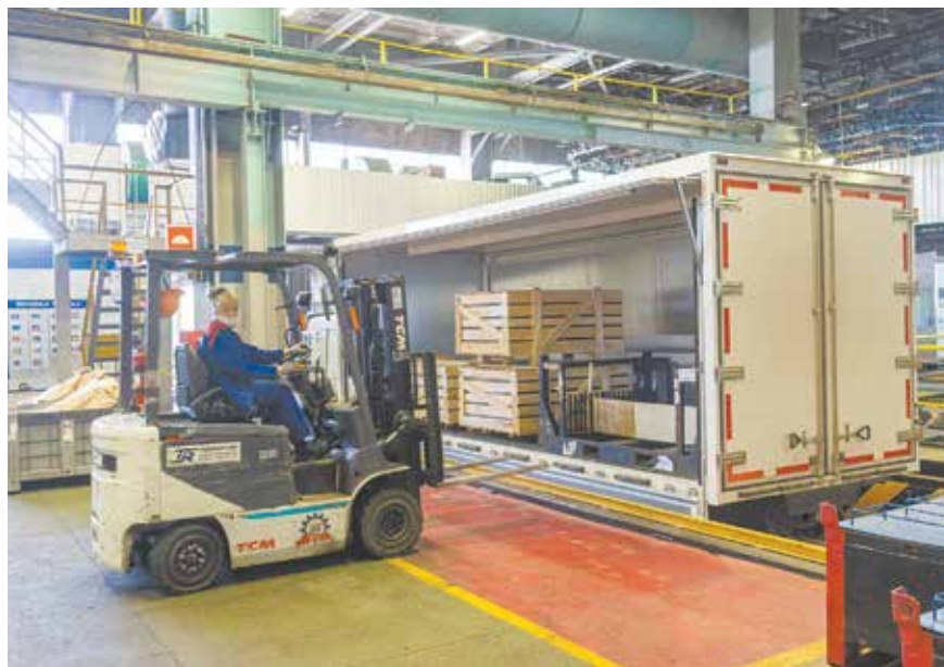
Такой фургон разгружать удобно

Заезжая на разгрузку, водитель без особых усилий открывает шестиметровый кузов. Между тем ещё недавно на эту операцию требовалось в 30 раз больше времени. Ещё один плюс — обширная площадь, открытая для обслуживания. А прочный металлический пол позволяет вести работы прямо в фургоне. Новая модель обеспечивает и более высокую