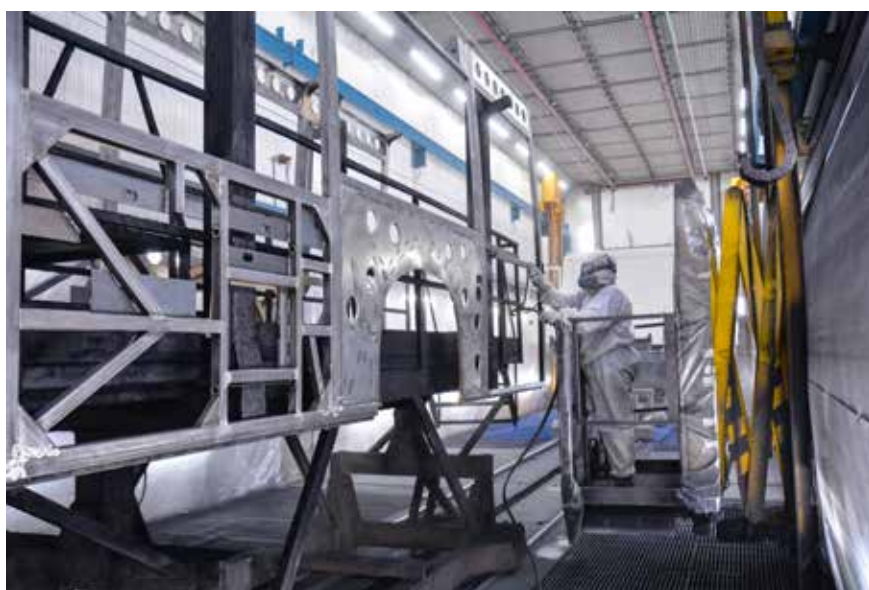
Выпуск 3000 автобусов в год — вот ради чего проводится модернизация

В ПАО «НЕФАЗ» продолжается модернизация производства. В компании наращивают мощности в целях увеличения объёмов выпуска до 3000 автобусов в год.