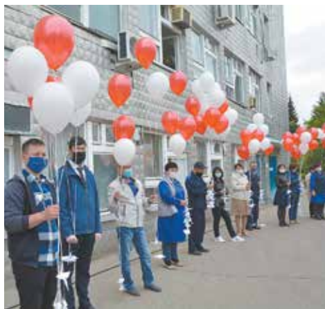
Запуск шаров в память о воинах, отдавших свои жизни за Родину

22 июня, в День памяти и скорби, профсоюзная оперативка на «НЕФАЗе» была проведена в формате митинга возле заводской Стены памяти.