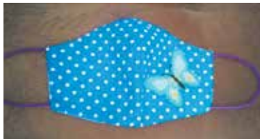
...а вспорхнувшая на маску бабочка невольно заставит улыбнуться движение.

Сейчас организаторы оценивают 30 авторских работ. Среди критериев — как оригинальность идеи, так и защитные свойства.