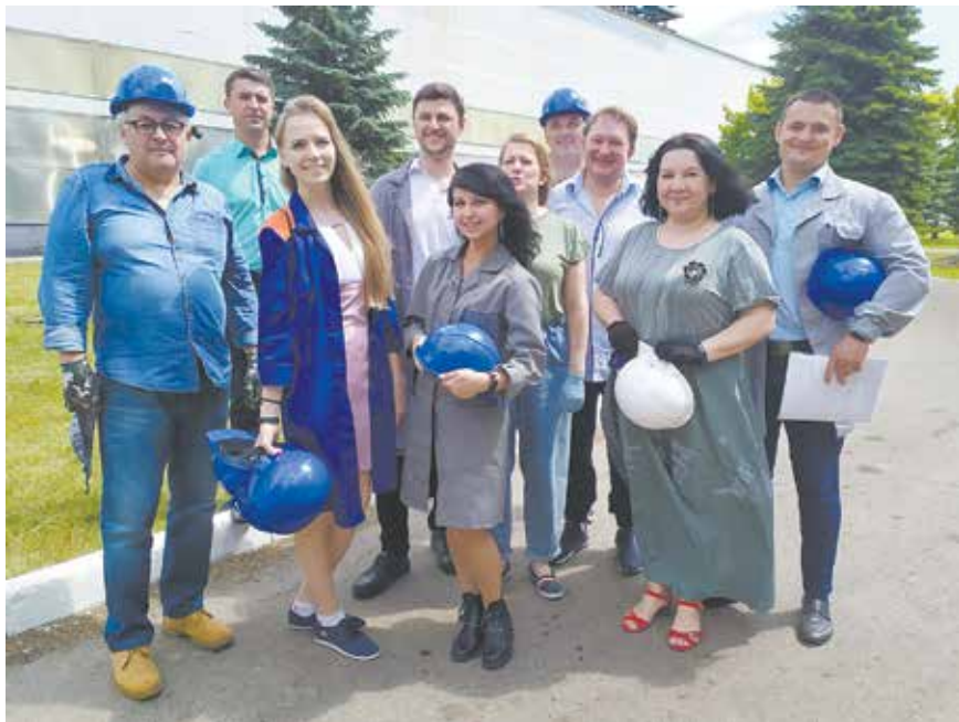
Наши заводские артисты скоро появятся на телеэкране

Творческая молодёжь «КАМАЗа» приняла участие в съёмках фильма «Герои нашего времени», посвящённого участникам Республиканского телевизионного фестиваля творчества работающей молодёжи «Наше время — Безнен заман».