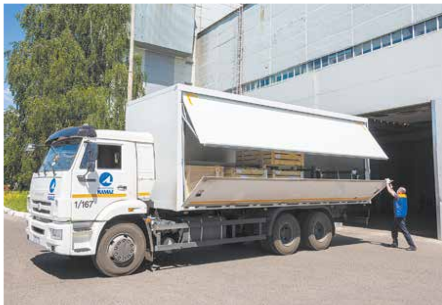
Водитель закрывает шестиметровый прицеп за 20 секунд