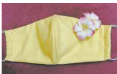
Милый цветок на тканевой повязке превращает её в удачное дополнение к гардеробу...