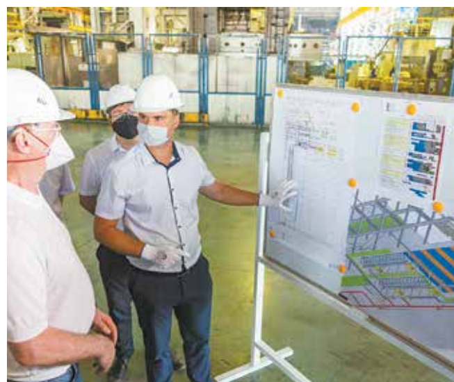
Каждый из руководителей подпроектов досконально изучил свой участок работы