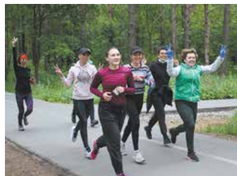
Забег реальный, хоть и онлайн

Все участники забега были награждены медалями.