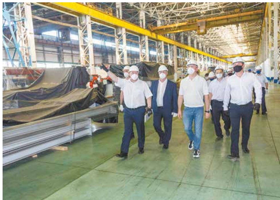
Знакомство с будущим производством рам начинается с осмотра площадки

— Это очень важный проект. Запуск новых линий избавит нас от необходимости закупок половины объёма лонжеронов, стоимость которых в два раза выше, чем на собственном производстве, — подчеркнул рулевой «КАМАЗа». — На этой площадке мы сразу решим несколько проблем по качеству: добьёмся стопроцентной гарантии геометрии рамы и втрое повысим стойкость лакокрасочного