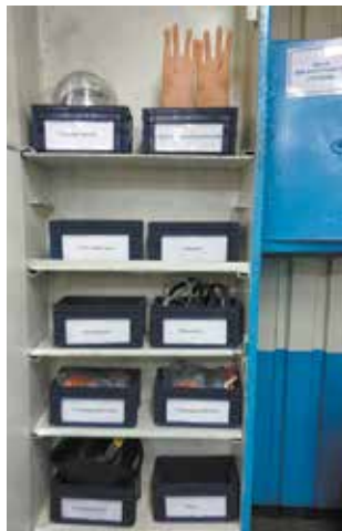
Необходимые средства защиты всегда под рукой

При транспортировке тяжёлых узлов и комплектов к месту ремонта