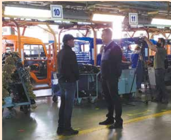
Показ 26-минутного фильма о Татарстане запланирован на телеканале «Россия-24» в конце июля