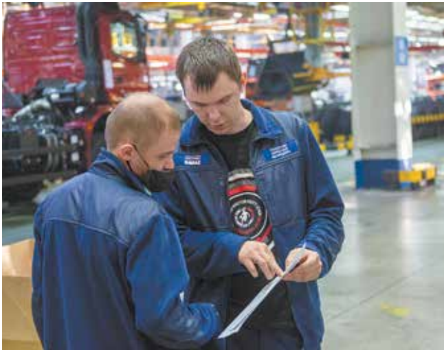
Техпроцесс создаётся прямо на глазах — во время обсуждения специалистами нюансов сборки...

Сразу после опытной сборки кабины для самосвала 6595 на АвЗ приступят к освоению других собратей нового семейства четырёхосного самосвала повышенной грузоподъёмности 65951 и полноприводного большегруза повышенной проходимости 65952.