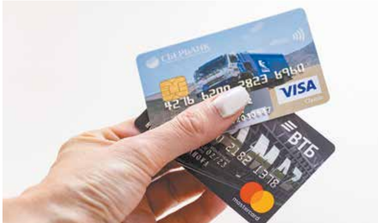
Перевод с карты на карту на кошелёк теперь не отразится

это сервис платёжной системы Банка России, позволяющий физическим лицам мгновенно (в режиме 24/7) перевести деньги по номеру мобильного телефона себе или другим лицам, вне зависимости от того, в каком банке открыты счета отправителя или получателя средств. Проект СБП направлен на содействие конкуренции, повышение качества платёжных услуг, расширение финансовой доступности, снижение стоимости платежей для населения. Банки-участники перечислены на сайте СБП: https://sbp.nspk.ru/participants .