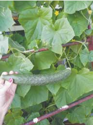
Огурец на балконе — и декорация, и витамины

Тепличный сорт «Зозуля» отлично прижился в балконных условиях. Возможно потому, что с заботливой хозяйкой ему повезло: «Я его поливаю