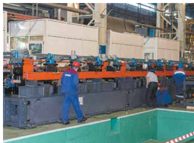
Монтаж оборудования линии профилирования лонжеронов ведут работники ПРЗ

Все работы идут в соответствии с графиком. Запуск нового производства намечен на первую половину 2021 года.