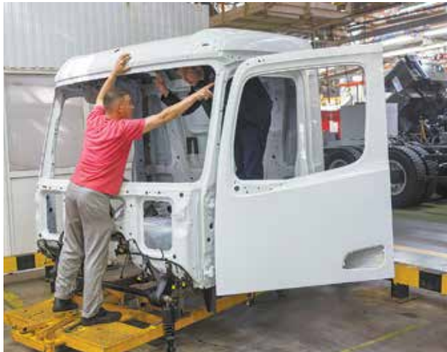
...и внутри каркаса, во время изготовления кабины