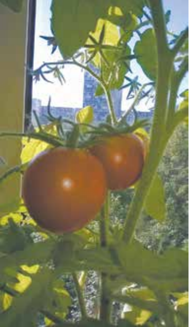
Дома можно вырастить не только карликовые сорта

А в этом году на шестиметровом балконе уместились 10 обычных томатных кустов. Растения посажены в пятилитровые цветочные горшки. Чтобы завязать плоды, традиционные сорта нуждаются в опыле-