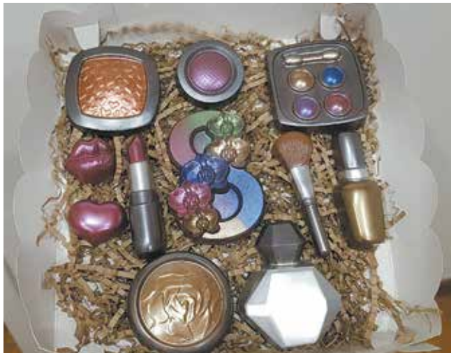
Любая девушка обрадуется косметическому набору, пусть даже съедобному