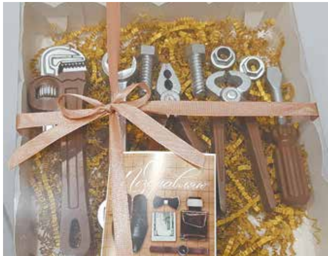
Шоколадные инструменты для мужчин ни за что не отличить от настоящих