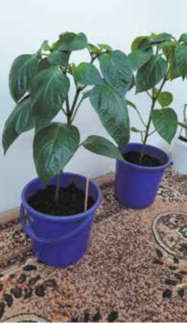
Пока только цветочки. Перчики будут потом

Саженьцы, около 20 штук, взошли из семян красного