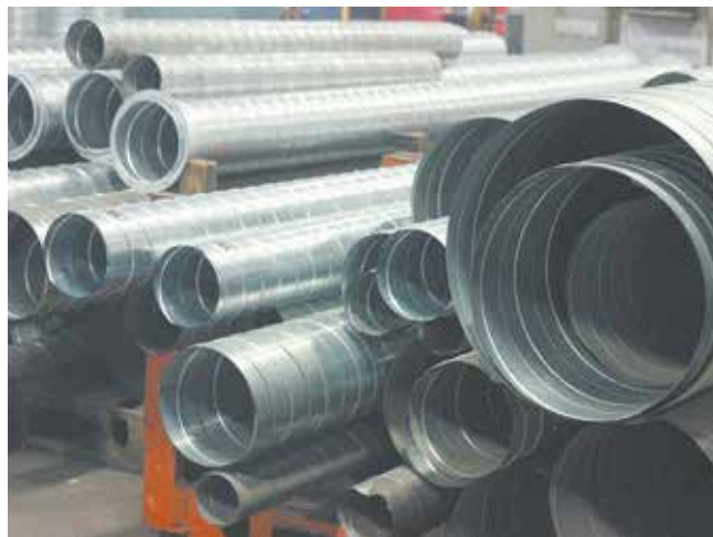
Без воздухопроводов сейчас не обходится ни одно промышленное предприятие