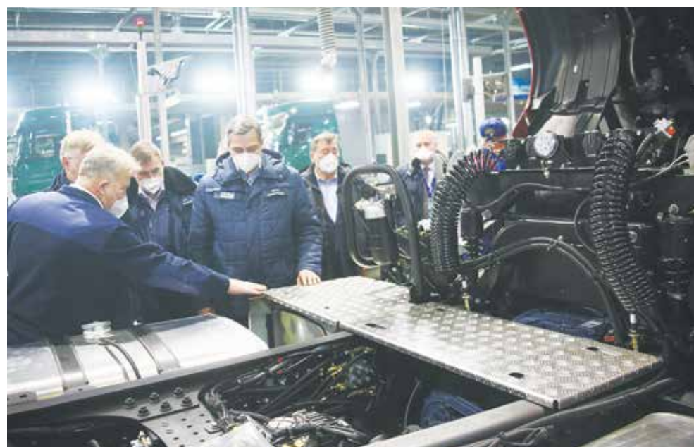
Серийный 54901 после доработки стал экономичнее и надёжнее