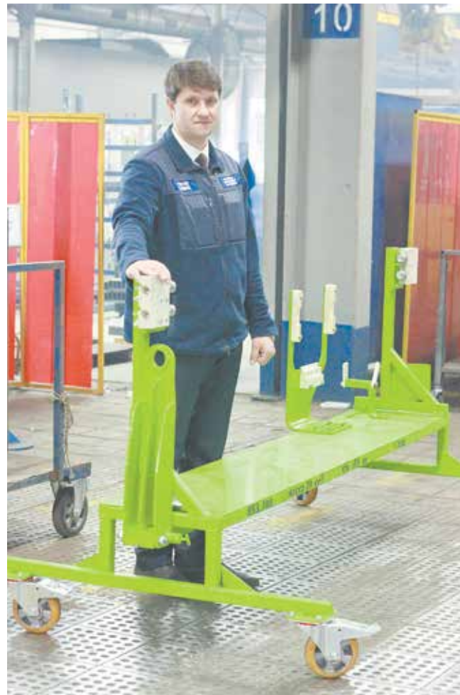
Эта тележка предназначена для перевозки панели приборов большегруза 54901