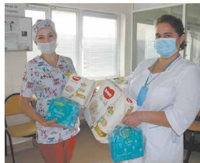
...в крайне нужные памперсы