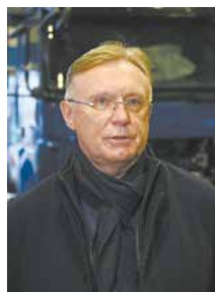
«В следующем году конвейер будет работать более ритмично», — уверен генеральный директор