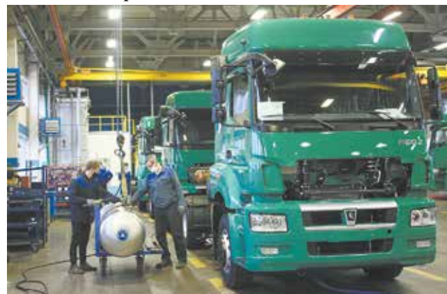
Освоенная этим летом модель КАМАЗ-5490 NEO 2 пользуется хорошим спросом