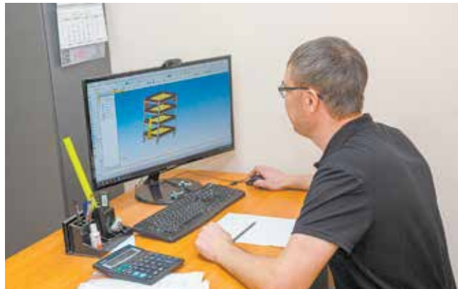
В «КАМАЗэнегоремонте» проектируют и изготавливают также шкафы, ящики, стеллажи и другую производственную мебель