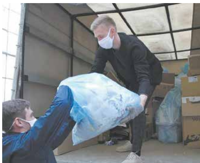
Ненужная бумага превращается...