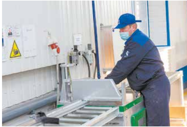
Изготовление продукции начинается с распиловки материала

Сейчас на участке ведётся сборка стоек и тележек для терминалов в рамках реализации проекта MES. Вслед за ГСК-2 их будут устанавливать на линии сборки перспективных моделей цеха сборки кабин и в цехе комплектации и сдачи автомобилей АвЗ. Есть заказы и на комплекты оборудования для организации эргономичных рабочих мест.