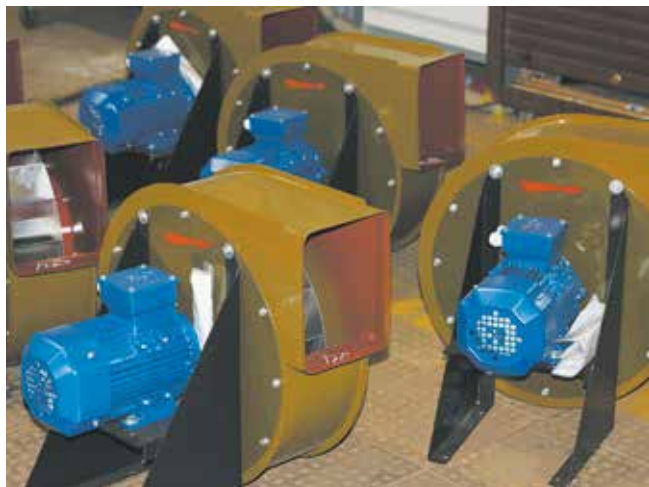
Вентиляторы готовятся к отправке в одно из камазовских подразделений

востребованы грузоносители для подборки узлов кабины нового модельного ряда К5.