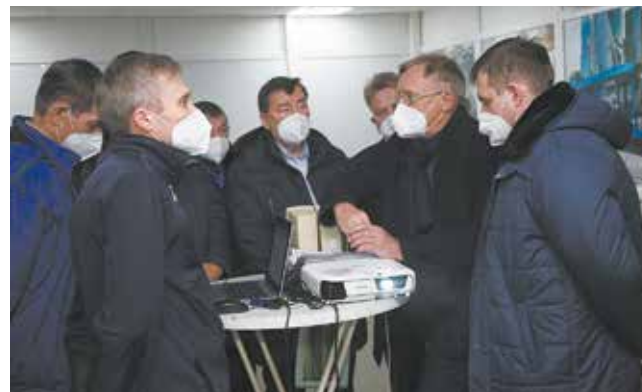
На совещании приняты решения по повышению ресурса автомобилей серии К3