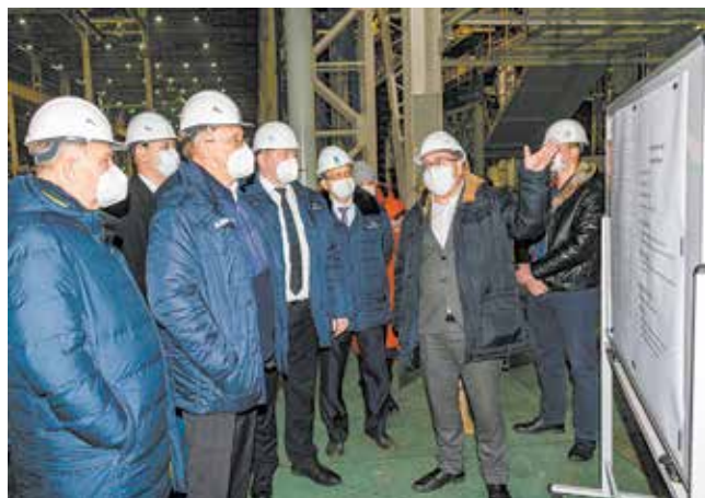
Монтажные работы должны вестись строго по графику

— После проведения картирования был составлен тактический план развития из 45 пунктов. Основные направления — снижение потерь при обслуживании установок лазерной резки и гибки металла и изготовление новых штампов. Чтобы уменьшить время загрузки и выгрузки металла, организованы склады рядом со станками. Повысить