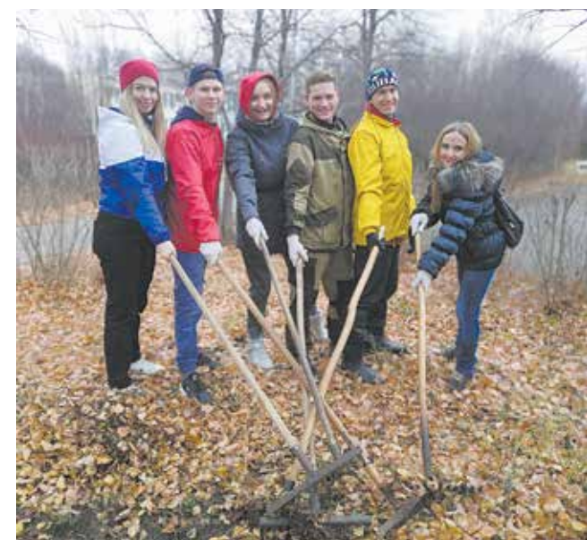
Несколько часов субботней уборки делают город чище