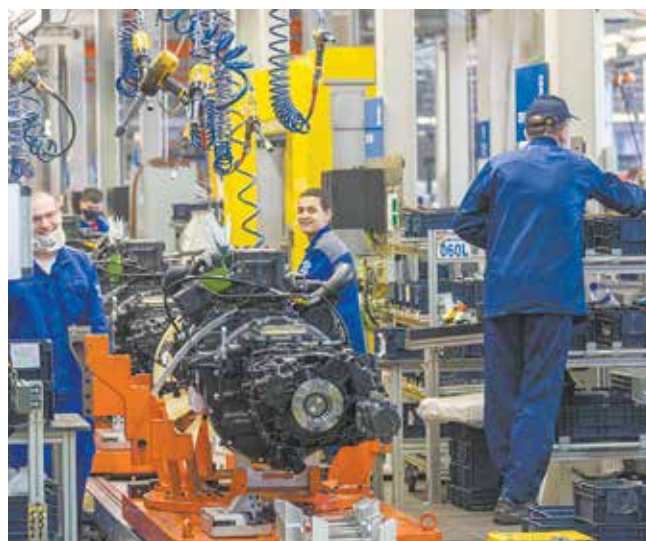
За тем, чтобы производство работало как единый организм, проследит тоже мастер

Набрав 258 баллов, первое место в конкурсе среди