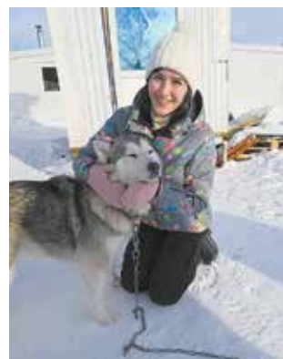
Четвероногие питомцы — одни из тех, кому присмотр нужен постоянно

морально тяжело. Но ты находишь силы, берёшь себя в руки, понимаешь, что сейчас всё зависит от тебя, и идёшь дальше.