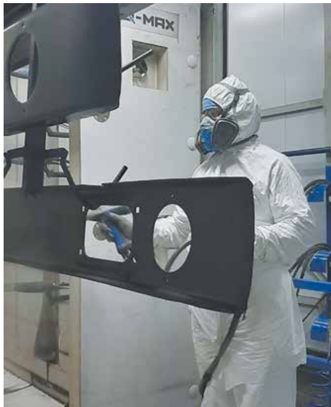
...а так в наши дни