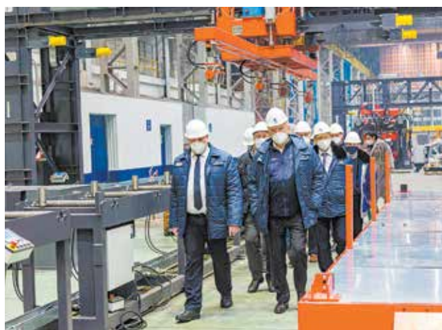
На линии профилирования лонжеронов крупноузловая сборка почти закончена