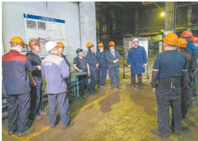
Любая работа начинается с планирования. А задачи ставит мастер

Конкурс, организованный Корпоративным университетом совместно с Комитетом развития производственной системы, хоть и проходил в заочном и онлайн-формате, заставил мастеров переоценить свой подход к делу. По традиции был организован личный зачёт для младших командиров основного производства и мастеров подразделений по ремонту оборудования. Вся их деятельность за прошедший год была отражена в показателях специально разработанных чек-листов. В первый необходимо было внести сведения об итогах работы по направлениям SQDSM и показатели текучести кадров в бригаде, его заверял непосредственный руководитель. Второй и третий контрольные списки содержали информацию об эталонном производственном или ремонтном