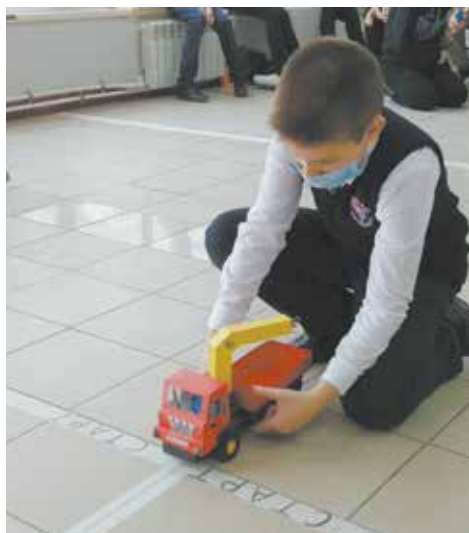
В Tatar Dakar на старт могут выйти КАМАЗы любой модели

Победители и призёры будут награждены грамотами управления образования города, остальные участники — сертификатами. Следующий конкурс «Битвы автогиганта» состоится через две недели. В ЦДТТ № 5 в знаниях и умениях будут соревноваться семьи, увлечённые техническим творчеством.