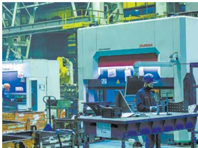
Чтобы снизить потери при транспортировке, в цехе малых серий отдельно сгруппировали станки по лазерной резке и гибке