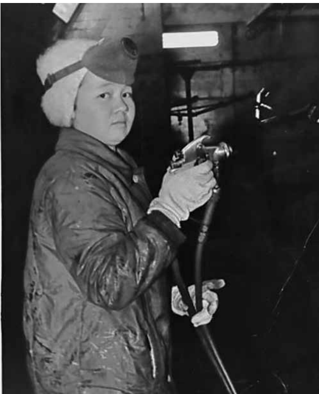
Так в цехе окраски работали раньше...

Накануне юбилея в цехе установили стенд со словами поздравлений и фотографиями работников, трудившихся здесь в разные годы. В социальных сетях разместили видеоролик с кадрами исторических событий. Каждый представитель этого коллектива получил памятный значок.