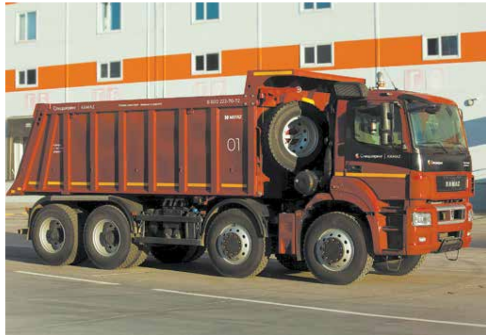
Аренда грузовика помогает клиентам хорошо экономить

«Спецшеринг» меняет рынок аренды спецтехники, делая сложный процесс аренды простым и добавляя в него прозрачность. Современная техника от лидера грузового автопрома теперь доступна в несколько кликов, и это по-настоящему новый уровень сервиса в аренде транспорта. Шеринг грузовых автомобилей — это альтернатива лизингу