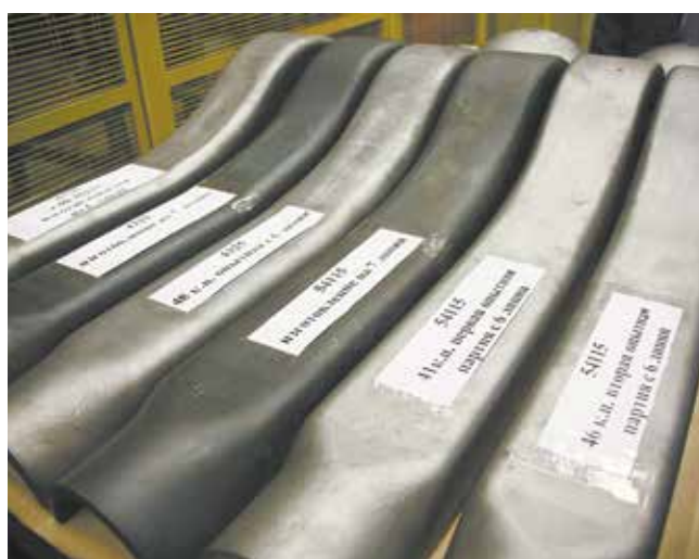
Нюансы изготовления балки картера лучше обсуждать на наглядном примере