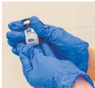
Синий флакончик — это первый компонент вакцины. Второй будет красным

— Мы уже приступили к подготовке здравпунктов к