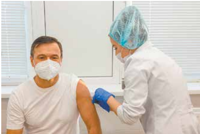
Вот он, щит от коронавируса

— Обычная прививка. Мне сделали укол, я считаю, что очень профессионально, я даже не заметил. Ощущения отличные. Я думаю, так будет и дальше. А то, что в прессе пишут насчёт повышения температуры, — это нормальная реакция. Организм начина-