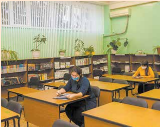
Заводчане приходят в библиотеку полистать книги и журналы во время обеденного перерыва

В фондах книгохранилища более 28 тысяч экземпляров книг и журналов. Каждому найдётся сюжет по душе — есть приключения, любовные романы, фантастика, большой выбор школьной и технической литературы, книг по психологии.