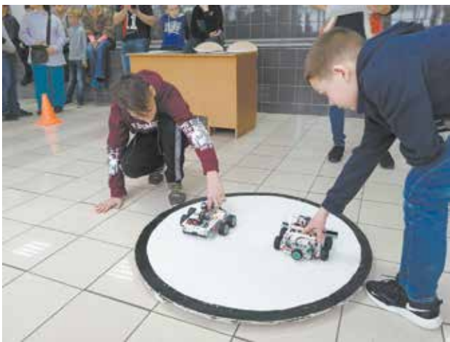
Борьба сумоботов (так называют роботов в этом виде спорта) начинается с обнаружения противника

Итоги соревнований подводились по трём но-