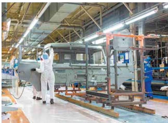
Производительность новой окрасочно-сушильной камеры выросла на 41%