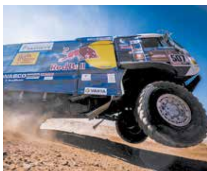
507-й экипаж мчит уверенно

Маршрут почти полностью состоял из дюн, достигавших третьего уровня сложности. Такие условия заставили выложиться на все сто каждого участника команды: пилоты старались преодолеть опасные и непредсказуемые участки, штурманы держали верный курс, а механики в постоянном режиме отслеживали показатели автомобиля и подбирали нужное давление в шинах.