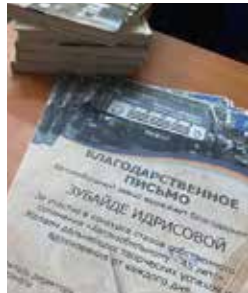
Эта награда станет ещё и напоминанием об историческом событии