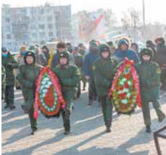
Среди возложенных к Вечному огню венков есть и от коллектива камазовцев