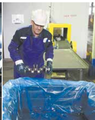
Организация поточной линии решила вопросы обеспечения качества поставок, упаковки и отгрузки продукции по принципу FIFO. В итоге в три раза возросла производительность финишных операций