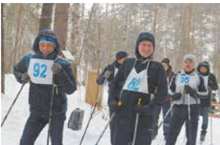
Пусть не все получили призы, зато зарядились отличным настроением!