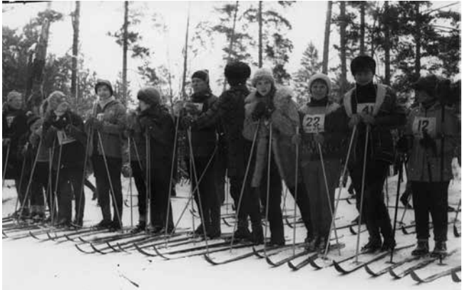
23 февраля 1971 года. Перед стартом первого лыжного забега

Слесарь-ремонтник АвЗ 20 февраля устранял неисправности в шпиндельной коробке станка. Тяжёлый узел соскользнул с подставки и придавил руку работника. У мужчины перелом костей правого запястья.