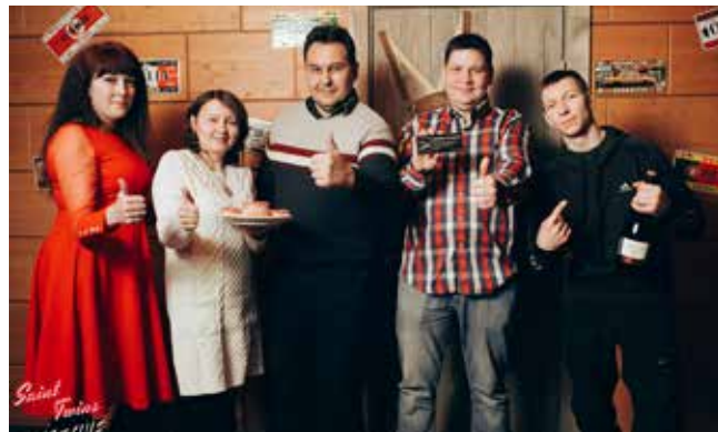
«Жак Клузо» — команда сильнейших детективов

Игра представляет собой расследование запутанного дела. Команды выступают в роли детективных агентств. В начале игры они получают брифинг, в котором к ним обращается клиент, а также свежую прессу, адресную книгу города и вопросы, на которые необходимо ответить для удачного решения кейса. Расследование проходит с помощью специально-