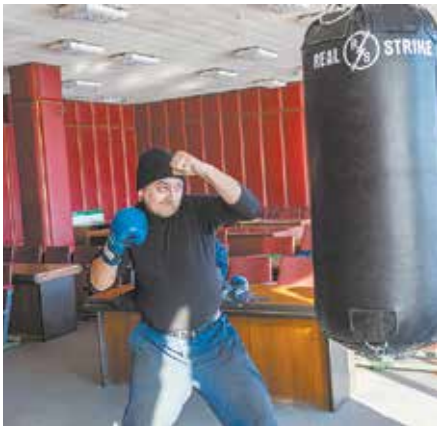
Силу удара участники могли увидеть сразу же — на табло