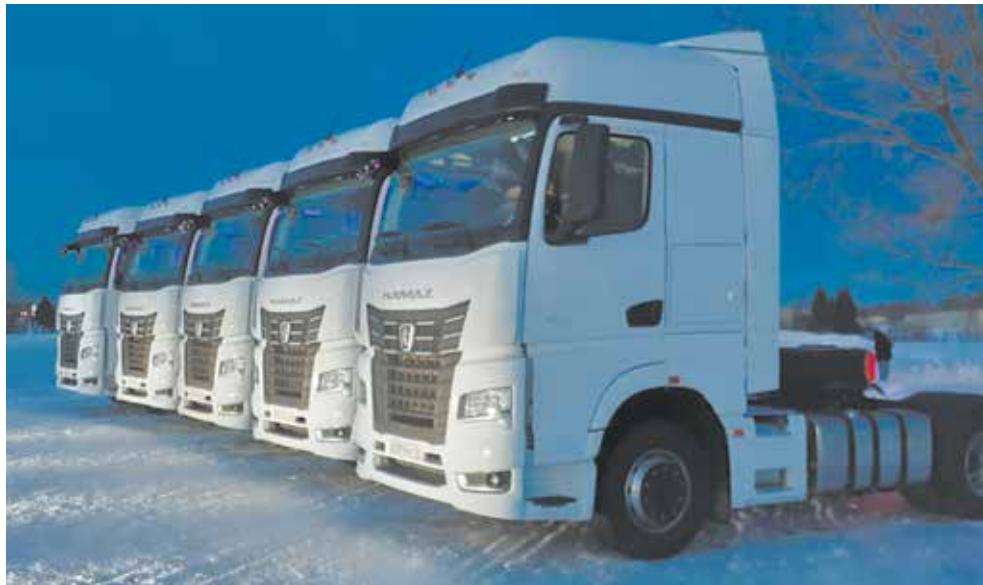
Настоящие профессионалы могут держать строй и на многотонных грузовиках

На вечере видеоклип, снятый в февральскую ночь, выглядел очень эффектно. Ведущие торжественного вечера сравнили увиденное на экране с компьютерной графикой. А «КАМАЗ» ещё раз показал: он может сделать достойную аранжировку и для музыканта-виртуоза. Ведь «Время, вперед!» написано для всех, кто стремится к новым высотам.