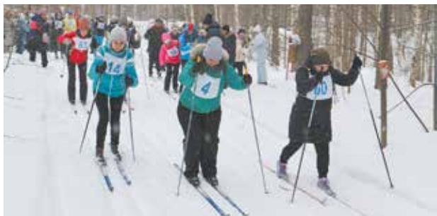
Морозная погода только подбодрила лыжников

Завершился спортивный праздник награждением победителей. Им были вручены ценные подарки. Кроме того, специальные призы получили самые активные и возрастные участники.