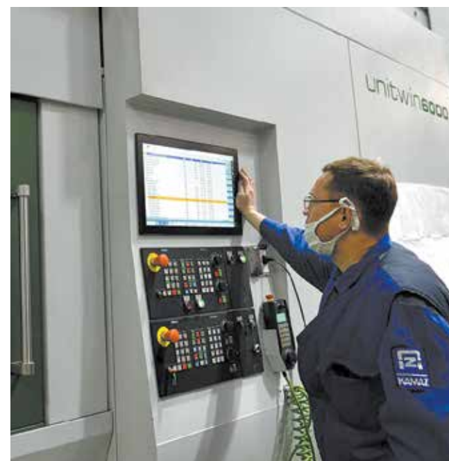
Запрограммировать цикл работы на таком сложном оборудовании по силам только опытному наладчику