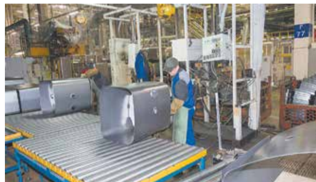
На одной площадке с новой линией расположена её предшественница, где варят только металлические баки. Уровень автоматизации здесь ниже, роботы старше. На участке трудятся 18 рабочих, которые изготавливают 16 видов баков ёмкостью от 125 до 500 литров