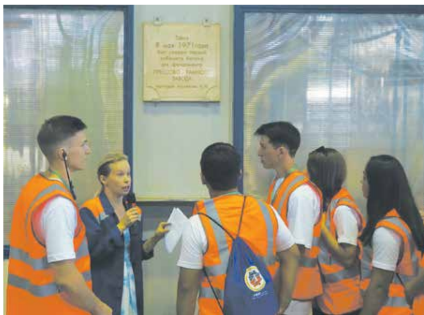
Место укладки первого кубометра бетона теперь считается историческим

2019 год. В рамках проекта «Локализация каркаса кабины K5 и поперечины панели приборов» организовано производство 188 деталей и узлов каркаса кабины. Уровень локализации составил 83%.