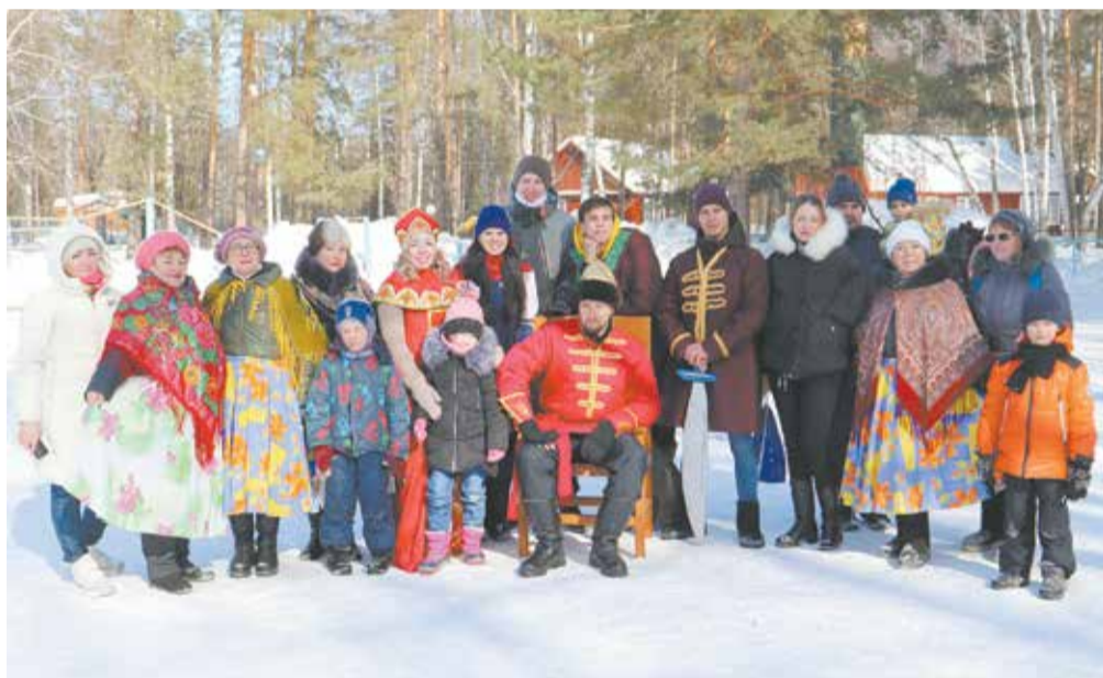
Масленица в «Дубках» завершилась фотосессией с героями театрализованной постановки

Ближе к кульминации праздника выяснилось, что ряженные в ярких кафтанах и сарафанах расхаживали среди народа не просто так: самодельные артисты завода двигателей представили коллегам театрализованную сценку о царевне Несмеяне. Как только капризную красавицу удалось если не рассмешить, то хотя бы заставить перестать плакать, настал час главного действия — сожжения чучела. Согласно поверью, оно символизирует изгнание Зимы и всех связанных с ней неприятностей. В костре сгорел дотла и ящик с описанными заводчанами невзгодами. Будем надеяться, что Масленица прихватила их все с собой, не забыв надоевший не меньше зимы коронавирус.