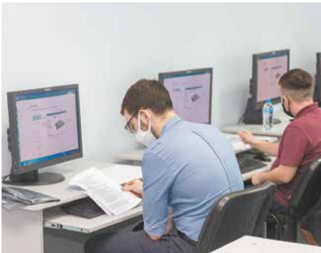
Чертежи есть. Задача — смоделировать и собрать подлодку

Итоги корпоративного чемпионата будут подведены в конце марта. Призёров ждут дипломы и солидные премии.