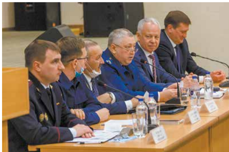
Руководители надзорных и силовых ведомств городских проблем не замалчивают

Камазовцы после докладов получили консультации у спикеров по персональным вопросам. Шамилов же со своей стороны отметил, что в контексте дистанционного мошенничества блок безопасности «КАМАЗа» активно ведёт и собственную информационную работу с персоналом компании: на корпоративном портале «Комета» регулярно публикуются рекомендации о том, как уберечь свои накопления от посягательств.