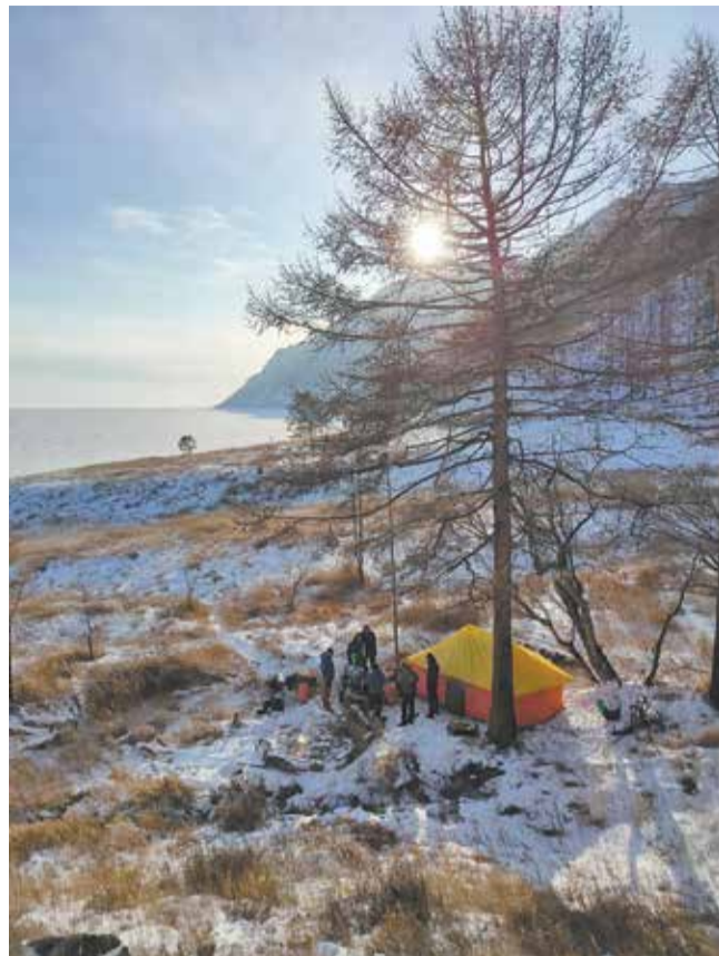
После дня пути туристы отогревались у костра и печки в палатке