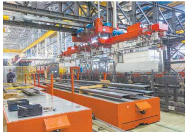
Уровень автоматизации новой линии профилирования лонжеронов — 90%

На линии окраски, расположенной на этой площадке, пока ведутся монтажные работы. Они выполнены на 69%. Срок запуска — первое полугодие 2021-го. Конвейер сборки рам практически готов к тестированию оборудования.