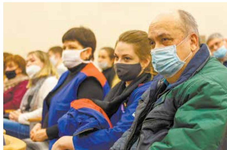
Камазовцы — люди вдумчивые, и предупреждения без внимания не оставят