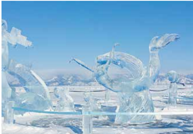
Фестиваль льда превратил окрестности Хужира в царство Снежной королевы

Зимний туристический сезон на Байкале составляет всего примерно четыре недели, когда выходить на лёд безопасно — его толщина составляет около полуметра. Длится этот период с середи-