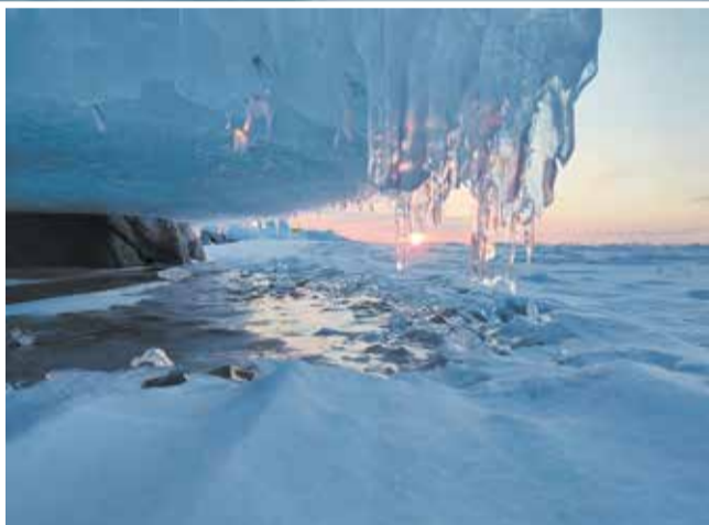
Рассвет раскрашивает окружающий ледяной мир в самые удивительные краски

Погода была изменчива: то солнечно и безветренно, то туманно-пасмурно и снег в лицо. В погожий день после обеда слышались взрывы и канонада вдали — так с грохотом и гулом расширяется и трескается лёд. Иногда происходят настоящие «байкалотрясения»: «Однажды во время обеденного привала мы ощутили такой толчок, что подскочили от испуга. Однако наш опытный гид