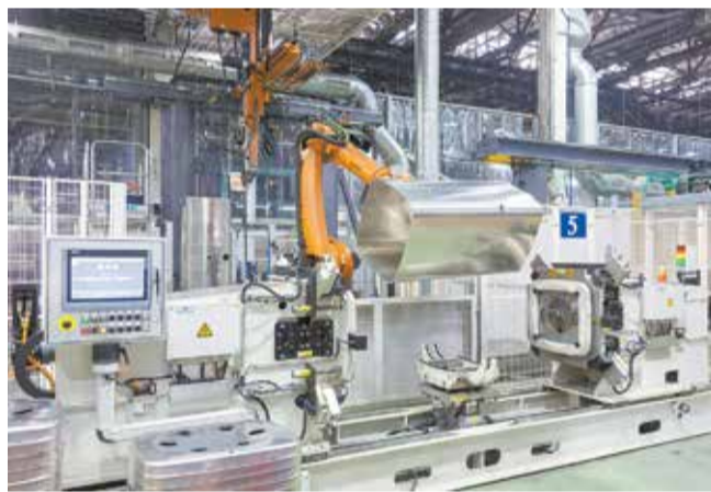
На новой линии самую тяжёлую часть труда взяли на свои плечи роботы

Состояние всех агрегатов постоянно контролируют наладчики. Перепрограммирование оборудования с алюминиевого на стальной бак занимает около полутора часов. Линию обслуживают шесть человек. В смену производится 50 баков, их ёмкость — от 260 до 800 литров. Сейчас каждый месяц на линии изготавливается около 1300 баков.