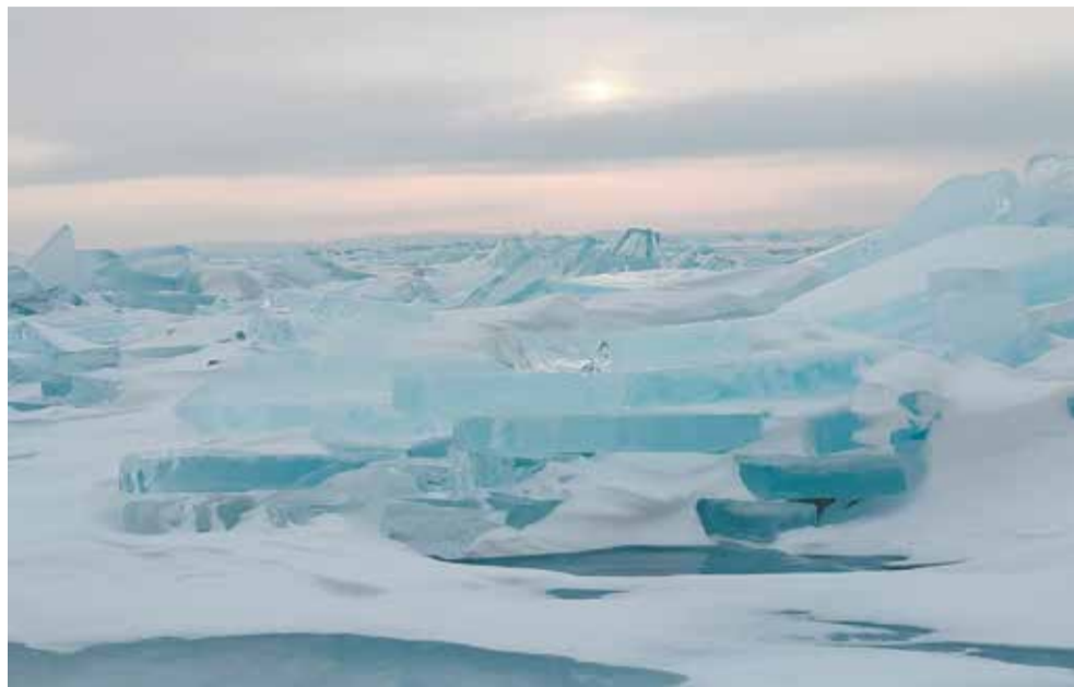
Живописные торосы — результат суточных перепадов температуры воздуха

В экипировку туристов также входили волокуши — высокие пластиковые ледянки, на которых перевозился весь скарб: восьмиместная палатка, печка, зимние спальники, провиант и прочее. Не везли с собой лишь воду для пригото-