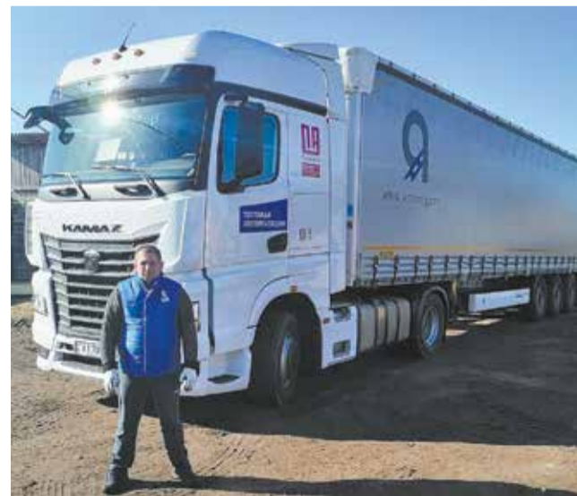
Для 54901 открываются перспективы на европейских дорогах

Водитель постоянно на связи и со своим работодателем «Янстронг», и с сотрудниками «ПарадАвто». Он докладывает, что получает удовольствие от комфорта этого автомобиля. Следят за движением автомобиля и в инженерном центре «КАМАЗа».