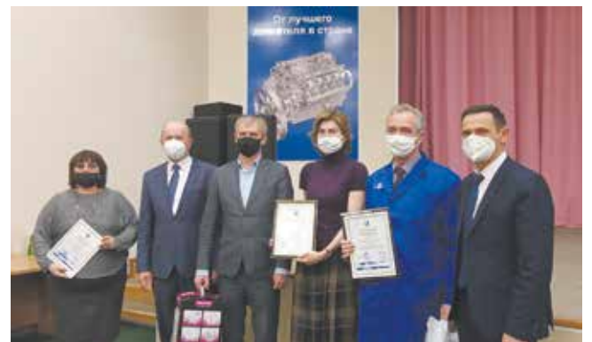
Дизелисты, отличившиеся в конкурсе на лучшую организацию труда, получили заслуженные награды