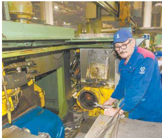
Ремонтники — это люди, обеспечивающие работоспособность всей технологической цепочки компании

— Каждый день — новые задачи, знания, достижения. Бывают такие сложные случаи, что приходится проводить настоящую исследовательскую работу, обращаться за информацией в архив,