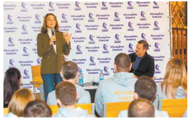
Депутат Госдумы и главный персональный «КАМАЗа» открыты к конструктивному диалогу