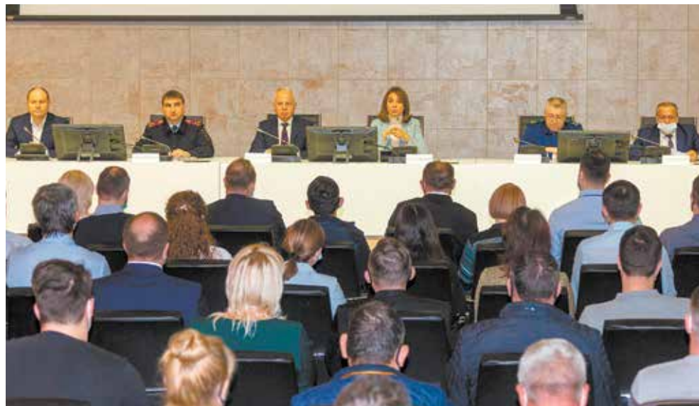
На встрече озвучили вопросы, с которыми челнинцы обращаются в прокуратуру