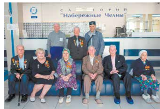
В санатории у ветеранов есть возможность и подлечиться, и пообщаться