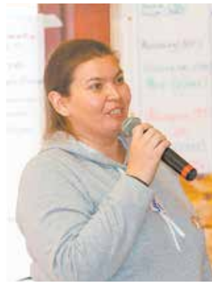
Введение «волонтерского часа» — это возможно?

воспитания ответственно-сти за происходящее вокруг. Кроме того, она помогает выявлять лидеров, которые впоследствии смогут проявить себя и в решении производственных задач.