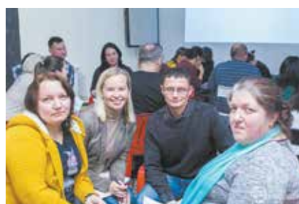
«Русские горки» готовы к любым вопросам

Франция — страна любви, архитектуры, высокой кухни и моды. Вместе с другими участниками игры на Кубок престижа заводчане вспомнили цитаты Экзюпери, осматрели Нотр-Дам и кар-