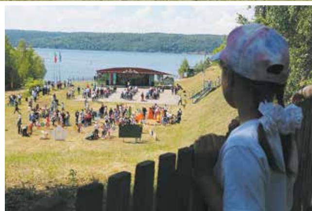
Праздник шумит и манит...

легко найти хорошую компанию: коллеги и за ребёнком присмотрят, пока ты на сцене выступаешь, и подскажут, где удачное фото сделать. В этом году лучшей фотозоной был признан деревенский «КАМАЗ» — сидя в его кузове на душистом сене, можно и чай попить, и байку рассказать про то, как на заводской Сабантуй ходил!