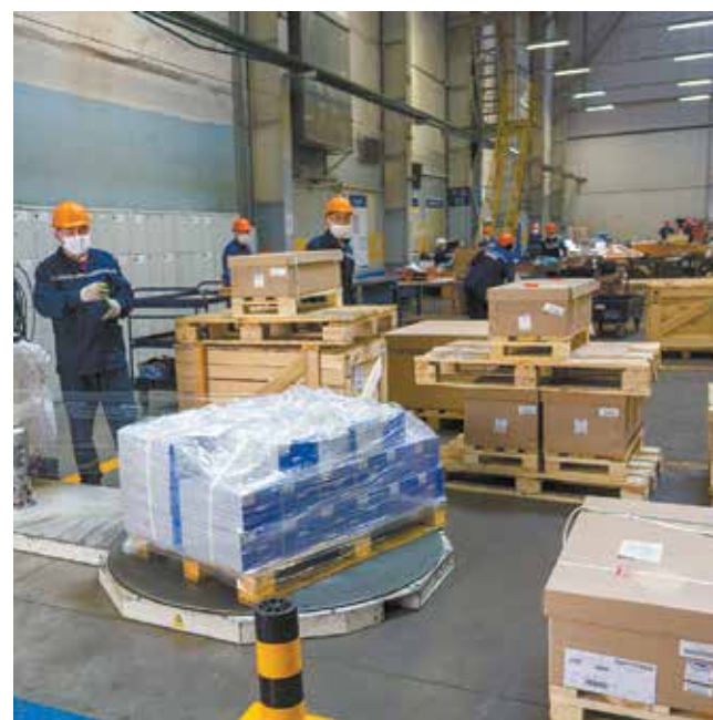
«АЗК» переходит от деревянной тары к гофротаре. При отгрузке в районы с жёсткими условиями доставки гофротара дополнительно обтягивается стрейч-плёнкой на паллетоупаковщике

Стараясь сохранить природные ресурсы, «АЗК» переходит от деревянной тары к альтернативной. Для этого создан участок сборки гофротары. Пока используется семь видов, скоро появятся упаковки и для крупногабаритных деталей.