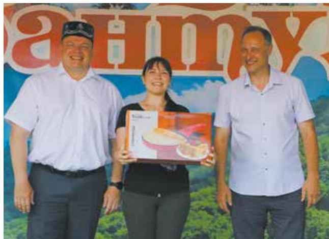
Каждому победителю — подарки от руководства завода и профсоюза

Победители конкурса «Созвездие талантов» (заявки на него подали 120 человек) радовали поклонников хорошей музыки, вокала и танца. Впервые в этом году была учреждена номинация «Талантливый руководитель». Оказывается, песня и сегодня строить и жить