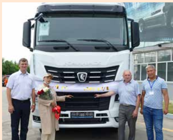
54901 — хороший выбор

Кроме того, на решение о покупке повлияли выгодные условия финансирования. В контрактную стоимость тягача 54901 входит пакет сервисных услуг на весь период действия гарантийных обязательств, который включает в себя гарантию на три года либо 540 тыс. км пробега и все предписанные заводом-изготовителем работы по регламентному техническому обслуживанию.