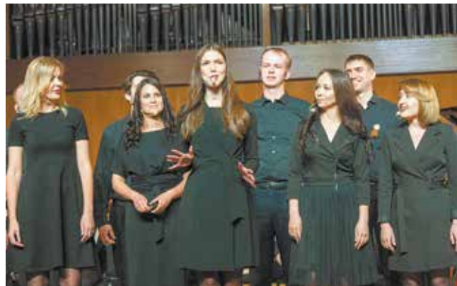
Сотрудники «АЗК» рассказали историю основания, становления и развития предприятия, вспоминая свои самые яркие впечатления

— Здесь собрались работники и ветераны «АЗК», сотрудники дилерских центров, заводов, которые производят нам запчасти, поставщики, а также те, кто обеспечивают деятельность «АЗК». Всем я говорю огромное спасибо. Хочу всем нам пожелать ещё много-много свершений. Электробусы, автомобили поколения К5 — это уже наше настоящее, а впереди — буду-