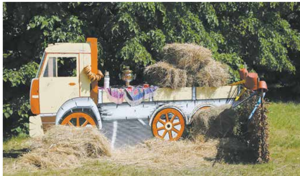
Этот КАМАЗ «собрали» специально к Сабантую

Чем ещё хорош Сабантуй прессоворамщиков? Здесь