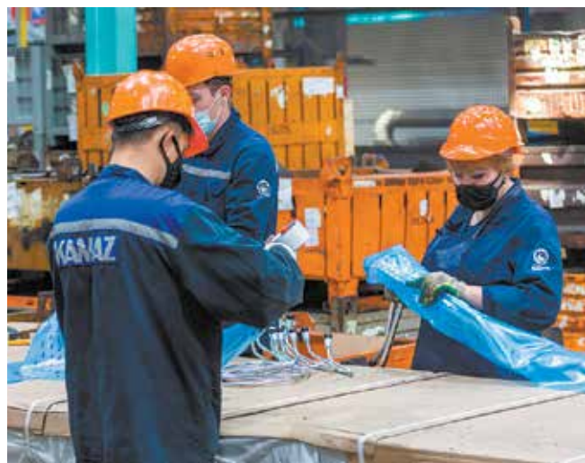
Пакеты из ингибированных плёнок — наиболее прогрессивный метод консервации. В них укладываются свыше 3200 позиций запчастей

Консервация и упаковка. До 90% запчастей собственного производства и 40% покупных изделий поступают законсервированными и упакованными, поэтому сразу направляются в зону стеллажного хранения. Остальные требуют обработки, предотвращающей коррозию и обеспечивающей сохранность при хранении и транспортировании. Порядка 350 наименований запчастей из чёрных металлов консервируются методом окунания в консер-