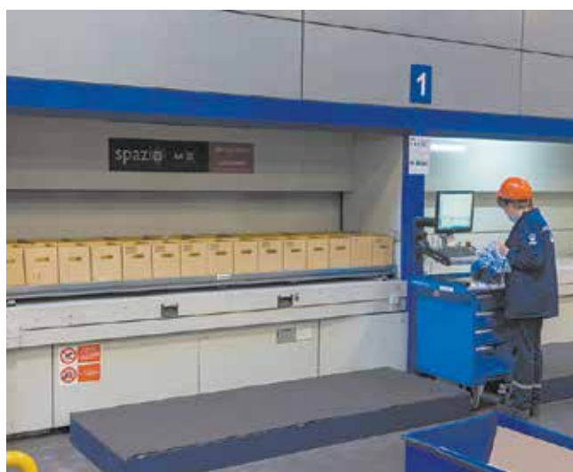
Для хранения мелких деталей используются автоматизированные стеллажи лифтового типа. Они состоят из 144 полок

Особо впечатлили гостей масштабы зоны стеллажного хранения . Её вместимость — 8400 единиц тары. Максимальная высота стеллажей 10,2 м. Средняя грузоподъёмность ячейки составляет 2500 кг, а таро-места — 830 кг.