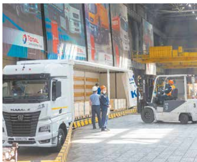
Разгрузка проводится не только с торца автомобиля, но и с его боковых бортов

Площадь корпуса свыше 56 тыс. кв. метров, и он по своей сути является центром запчастей, предназначенных для реализации в дилерскую сеть, для сервиса и по гарантии. Сюда поступают запчасти, произведённые на заводах «КАМАЗа», и покупные изделия от заводов-смежников. Важно не просто заполнить склад запчастями, а провести грамотное прогнозирование и планирование, чтобы то, что дилеру понадобится завтра, поступило на склад заранее. Работа подразделения по продажам запчастей с дилерами построена на профессионализме и доверии, испытанном годами. Продажа запчастей более чем на 140 млрд рублей — это результат, которым можно гордиться. Система складской логистики «АЗК» готова к таким объёмам за счёт выстроенного процесса от приёмки до отгрузки покупателям.