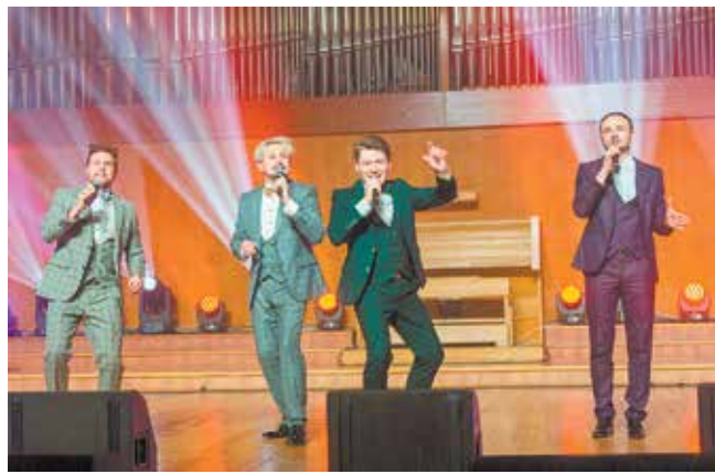
В исполнении известного московского квартета PER4MEN прозвучали мировые и отечественные хиты, а также оперные шедевры