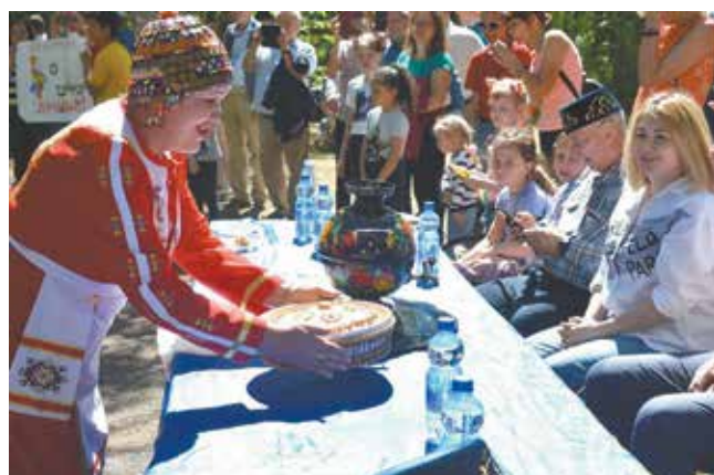
«Угощайтесь, гости дорогие!»

лантами автосборщики подготовили и свою программу. Порадовали ис-