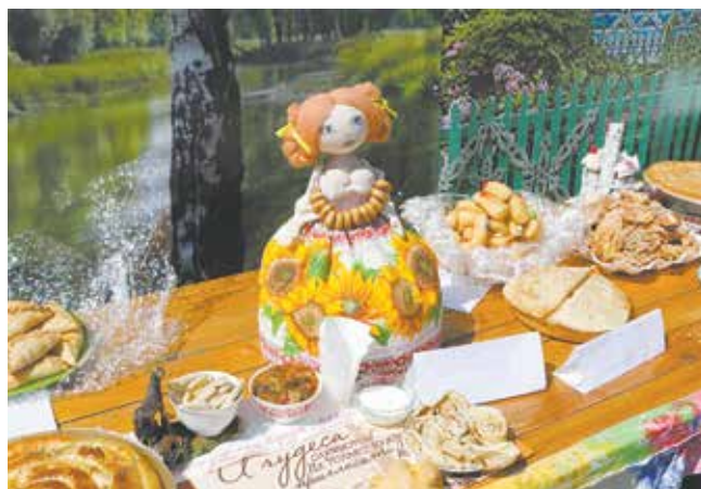
Угощение на славу!

Большой, шумный, красочный Сабантуй закружил в «Лесной сказке» неугомонных, весёлых, жадных до побед прессоворамщиков. Кто ж откажется «отведать радость прикосновения к празднику, сохранённому через века татарским народом?» Здесь по традиции чествовали самых трудолюбивых, талантливых, спортивных и готовых испытать свои силы на майдане.