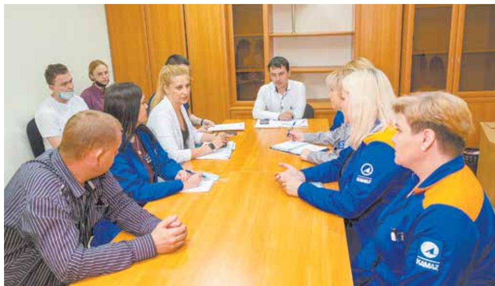
Реализовывать камазовские проекты Совету мастеров логистического центра приходится с учётом специфики своей работы