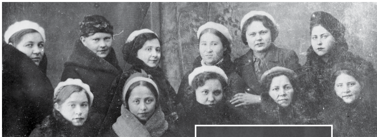
Партийные и комсомольские активистки, заменившие в Челнинском районе руководителей-мужчин