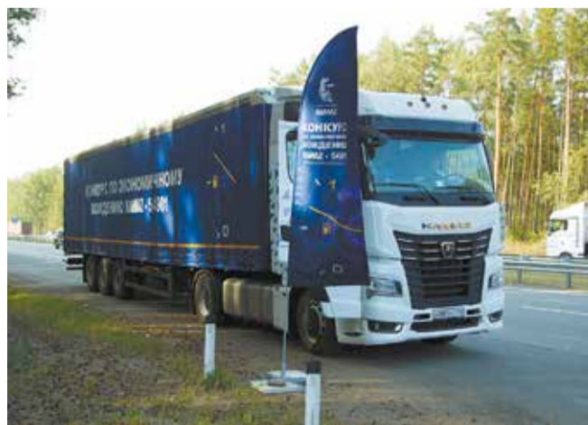
Каждый конкурсант прошёл 130-километровый путь