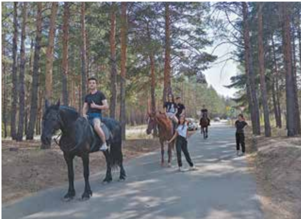
Конная прогулка удалась

Такое продуктивное утро — несомненный заряд энергии на целый день!