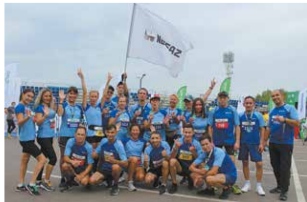
Нефазовская команда бегунов всегда на позитиве

И на достигнутом заводчане-олимпийцы останавливаться не собираются: 18 сентября их ждёт новый вызов — Альметьевский полумарафон.