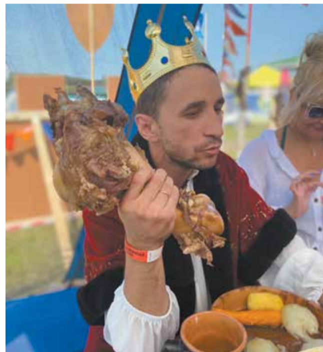
А мясо королю положено в любое время!