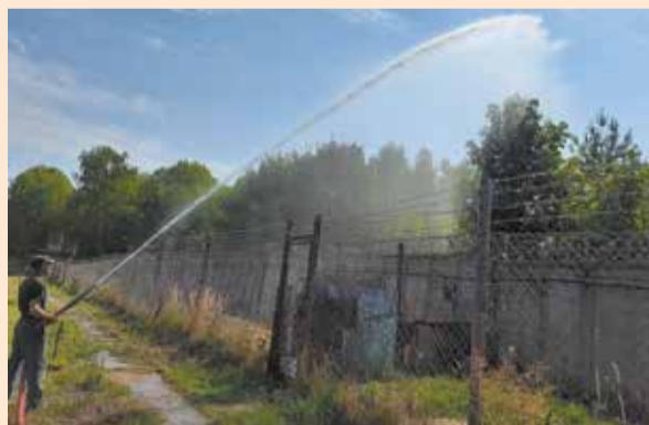
Жаркое лето-2021 напомнило об опасности пожаров

Необходимость в этой мере возникла после весенних возгораний сухой травы и листвы в опасной близости от водозаборных сооружений «ЧВК». Новая пожарная колонка установлена со стороны леса, где она соединяется с трубопроводом речной воды, однако пожарные рукава от этой точки смогут покрыть весь периметр водозаборных сооружений. Это подтвердили рабочие испытания, проведённые компанией 25 августа.