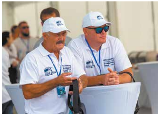
Скоро наш заезд

«Экономичное вождение — значимая составляющая цены владения грузовиком. Выполняя рекомендации, мы можем достичь существенного эффекта: экономия пяти литров топлива (это вполне возможно за счёт качества вождения) при пробегах порядка 10 тыс. км в месяц сохраняет свыше 2 млн рублей, что равно покупке нового седельного тягача раз в три месяца. В ряде транспортных компаний водителя поощряют за экономичное вождение. В год один водитель может сэкономить топлива почти на 150 тыс. рублей», — обрисовал перспективы Капитонов.