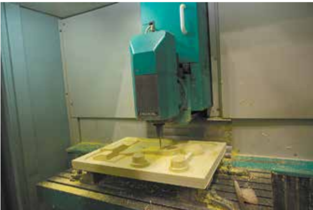
Так вытачивается форма для заливки