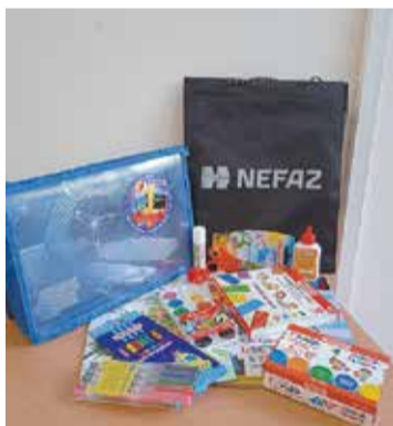
Вперёд, к новым знаниям

От торжественного вручения — прежде для детей автозаводчан проводилось «Первоклассное шоу» — в этом году пришлось отказаться в связи с неблагоприятной эпидемиологической обстановкой. Однако атмосферу праздника удалось сохранить благодаря прекрасному подарку. К 1 сентября готовы!