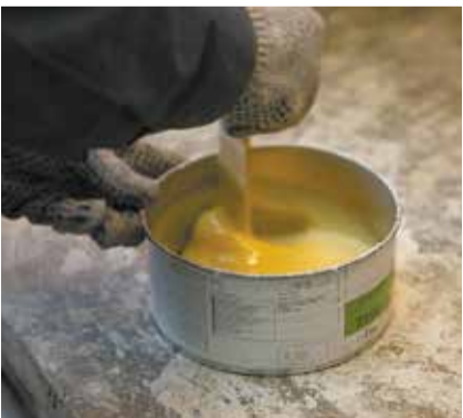
Эту смолу заливают в форму...