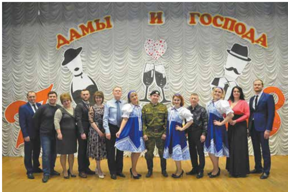
Март 2021 года. И сегодня профком активно поддерживает самодеятельное творчество работников завода

профком с достоинством выдержал все испытания лихолетья. Упор в работе пришёлся на защиту трудовых, профессиональных, социально-экономических прав и интересов членов профсоюза. Так, например, профком тщательно вникал и изучал вопросы сокращения штатов. Это был