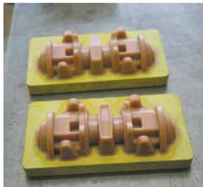
...и на следующий день оснастка готова

Как обычно, отправной точкой для проекта стала задача, поставленная руководством завода. На этот раз персоналу производства литейной оснастки (ПЛО) и технологической службы поручили найти возможность снизить себестоимость изготовления литейной оснастки.