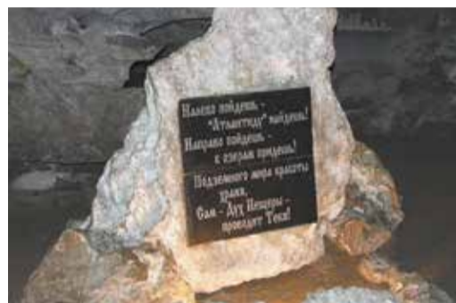
На развилке подземных троп есть выбор пути