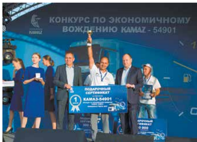
...а его компания «Кит Авто» — магистральный тягач 54901