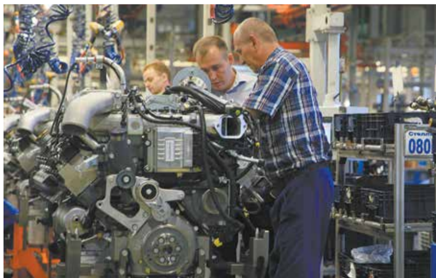
Опытным глазом Филиппов сразу отметит, где возникло несоответствие