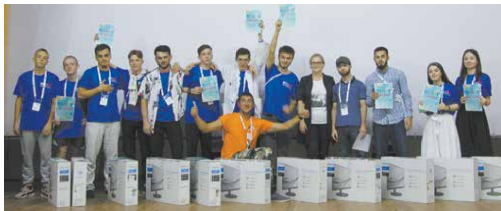
Команда из Грозного хоть и новичок, но уже уверенный победитель форума

В течение всего форума за выполненные задания участникам выдавались знаки отличия, которые они заносили в профайл отряда. Победителями стали отряды, в профайлах которых оказалось больше всего таких знаков. Абсолютным лидером форума стал отряд КМЗ, сформированный преимущественно учащимися Грозненского государственного колледжа. Делегация Чеченской республики впервые приняла участие в камазовском форуме. Ребята тщательно выполняли все задания организаторов форума и показали себя сплочённой, креативной и интеллектуальной командой. В качестве приза каждый участник команды получил 27-дюймовый монитор Philips.