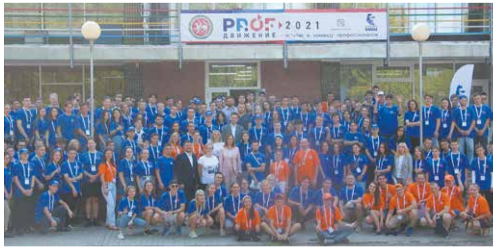
В «PROFдвижении-2021» приняли участие 200 студентов. Все они теперь представляют, что такое цифровое производство