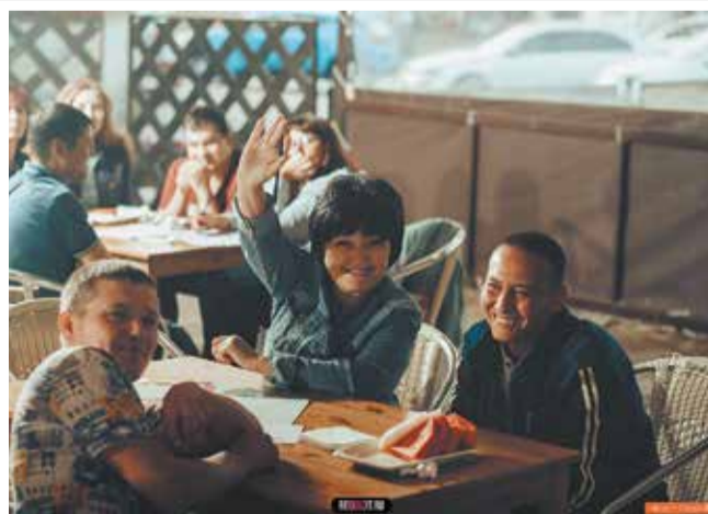
Лето, жара и ReQuizit — отличное трио

Победителю и призёрам были вручены призы от организаторов и спонсоров игры. Также по традиции поощрительными призами были награждены команды, занявшие последние три места. Ими стали «Эдельвейс» (отдел планирования товарной продукции), «Инструментальные палочки» (инструментальный цех № 11) и «Вахта» (цех сварки, сборки вахтовых автобусов № 35).