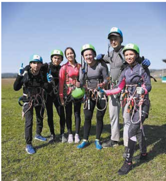
Такой экипировки в средневековье не было

По итогам соревнований команда «НЕФАЗа» выиграла восемь грамот и кубок за 2-е место. Резюмируя, решили: раньше было лучше, но и сейчас неплохо!