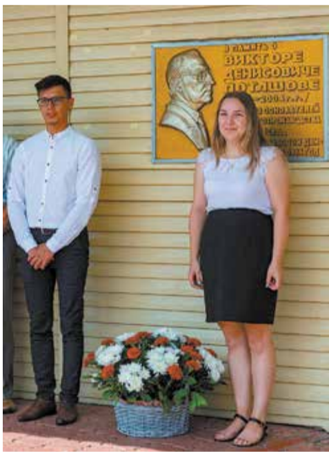
Цветы — дань уважения заводчан основателю «движков»