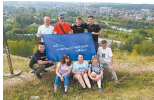
Путешественники из ВТК смогли увидеть Кунгур и сверху

Впрочем, прекрасные виды того стоили — красоты пещерных озёр и гротов, образования наледей и горных пород завораживали всех без исключения. А завершающими штрихами насыщенного дня стали подъём на колокольню Тихвинского храма и посещение музея купечества.