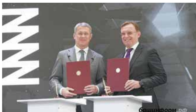
Сотрудничество с Башкортостаном обещает быть взаимовыгодным

Отдельные процессы — такие как термическая обработка и гибка рессор — на новом заводе полностью автоматизированы. Как сообщает Башинформ.РФ, по проекту производство сможет выпускать до 1200 тонн