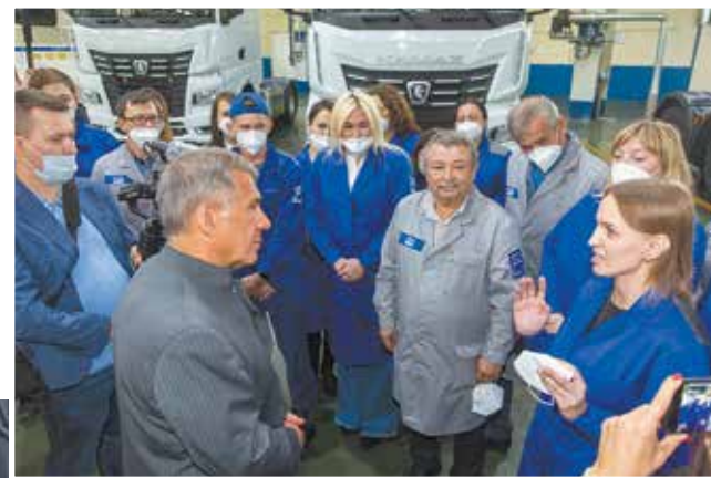
Президента интересуют не только рабочие темы

Обсудил с собравшимися Президент Татарстана не только рабочие темы. Так, с вопросом о строительстве