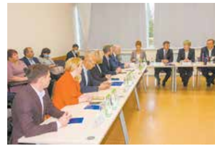
Итог встречи: все образовательные концепции «КАМАЗа» демонстрируют возможности и профессионалитета, и прикладного бакалавриата