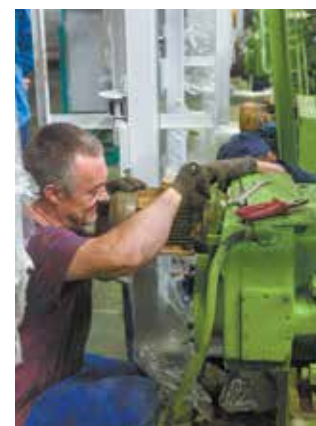
Работа ремонтников кипит, когда стоят станки

оси. Здесь демонтировали и вновь смонтировали накопитель для передачи передней оси с основного конвейера на карусельный для подрессоривания. Накопитель был разработан специалистами Технологического центра и изготовлен на РИЗе. Ремонтная служба АвЗ занималась установкой и привязкой к уже существующему оборудованию. Взамен старой