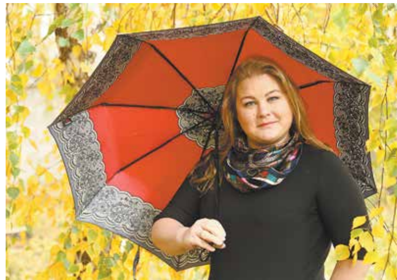
Участие в НПФ — защита от финансовых невзгод в будущем

Выписку о состоянии счёта можно получить, лично обратив-