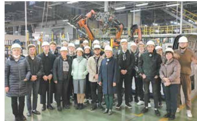
Прессоворамщикам такие коллеги нужны!