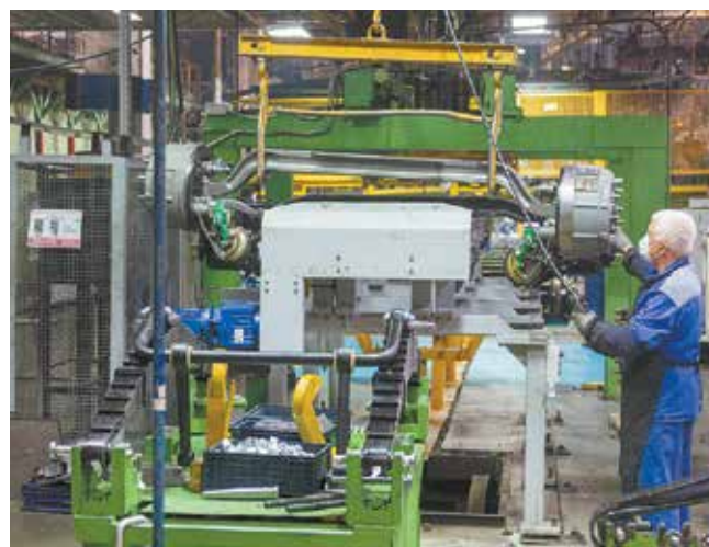
Участок сборки передней оси. Смонтированный вновь накопитель для передачи передней оси с основного конвейера на карусельный значительно облегчает работу