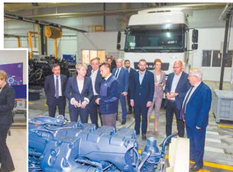
Представители делегации увидели: на «КАМАЗе» достаточно возможностей для приложения рабочих рук

Шмелёва, резюмируя дискуссию со своей стороны, отметила, что все образовательные концепции «КАМАЗа» демонстрируют