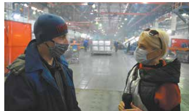
Все желающие могли получить индивидуальную консультацию врача