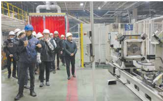
Студенты своими глазами увидели масштабы реинжиниринга

Так, 7 сентября прошла встреча студентов автомобильного отделения Набережночелнинского института КФУ с представителями «КАМАЗа». Учащимся подробно рассказали о деятельности основных структурных подразделений предприятия и о целевой подготовке, которая подразумевает совмещение образовательной деятельности с профессиональной. А 8 сентября на подобную встречу пригласили студентов-первокурсников отделения информационных технологий и энергетических систем.