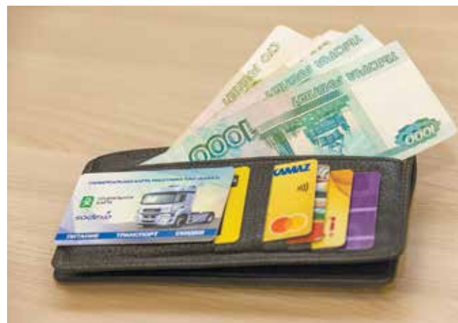
Прибавка в кошельке — всегда хорошая новость

на проезд вызвало споры среди камазовцев — не стоило ли предприятию организовать бесплатную вахту для работников взамен льготы? По словам Ушенина, адресная мера социальной поддержки эффективнее с точки зрения учёта расходов, поскольку вахтовыми автобусами могут пользоваться работники других предприятий. Промышленная политика «КАМАЗа» поощряет расположение производственных площадок поставщиков рядом с заводами — это позволяет со-