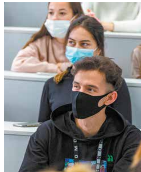
По глазам видно — заинтересовался!