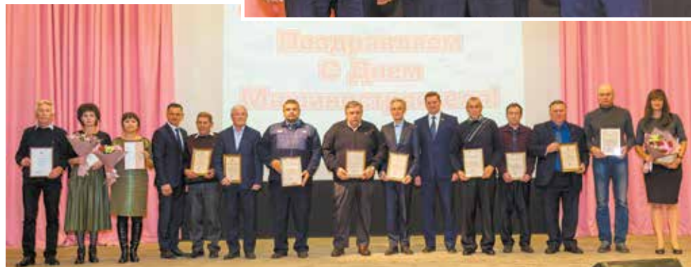
В 2021 году награждено более 100 дизелистов