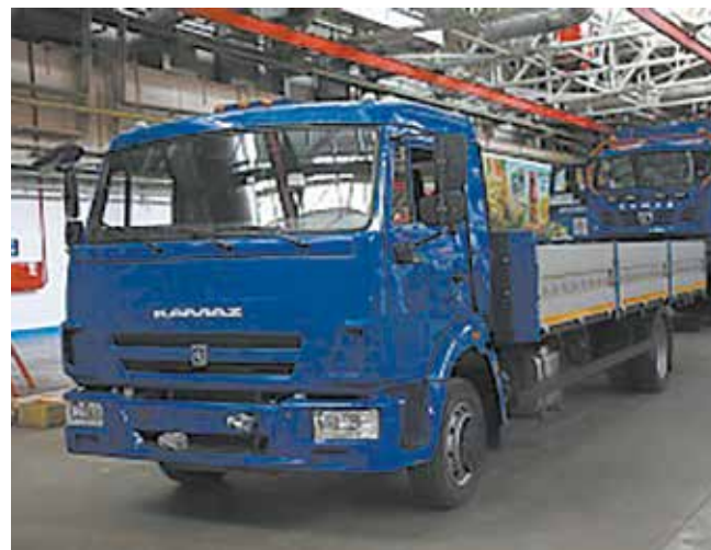
КАМАЗ-43083 осуществляет межзаводские перевозки

и сонары. У авторобота высокоточная навигация (с погрешностью не более 3-5 см) и система связи: промышленный Wi-Fi, 4G и специальный УКВ-диапазон на случай, если заглушены другие каналы связи. Все данные с датчиков поступают в мозг машины — компьютер, где происходит обсчёт входящей информации о параметрах движения. Исходя из этого, принимается решение, как машине себя вести и правильно выполнять задание.