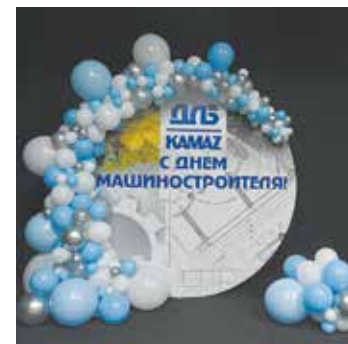
Эта инсталляция встретила димитровградских литейщиков в театре

После торжественной части заводчан порадовали комедийным спектаклем «Шикарная свадьба» от Димитровградского драмтеатра.