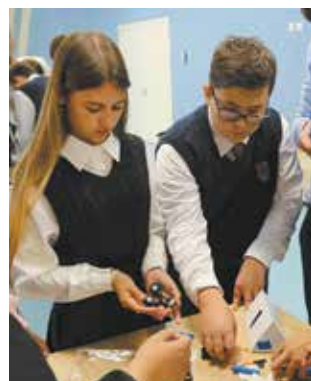
Кто в детстве любит собирать конструктор, потом и с техникой справляется

В заключение праздника организаторы подготовили детям сюрприз: во внутреннем дворе школы их ожидал настоящий автомобиль КАМАЗ-54901 — учебный