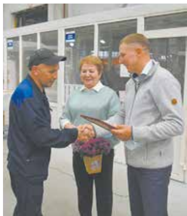
Награда из рук директора особенно дорога

А для всех заводчан — членов профсоюза предприятие подготовило особый подарок — стильный тёмно-синий рюкзак с фирменным логотипом NEFAZ. Изготовила их по индивидуальному заказу уфимская компания «Серебряный Пик» — крупный производитель галантереи под торговой маркой Silver Top.