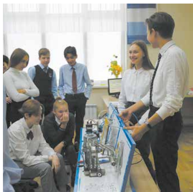
Нынешние студенты рассказали завтрашним, что учиться камазовским профессиям здорово

Уходя, обещали вернуться «Дни КАМАЗа» с новыми играми и конкурсами.