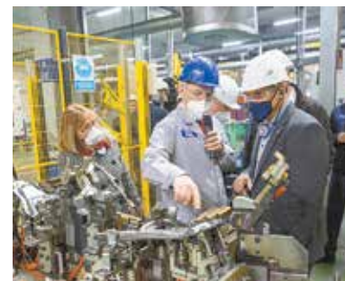
Представители фирмы KUKA работающие на «КАМАЗе» оборудование осматривают детально

Согласно стратегии «КАМАЗа» по роботизации производства, к 2035 году предполагается интеллектуальная роботизация на технологиях искусственного интеллекта и машинного обучения, широкое внедрение роботов во все процессы. Плотность роботизации