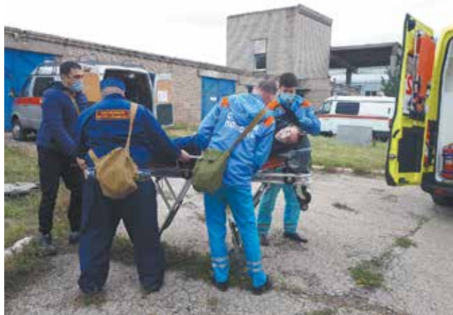
Оказание первой помощи пострадавшему

Аварийно-спасательное звено управления по ПФО Центра охраны объектов промышленности ФГУП «Охрана» Росгвардии вынесло пострадавшего из зоны заражения и передало бригаде № 28 Станции скорой медицинской помощи города Набережные Челны.