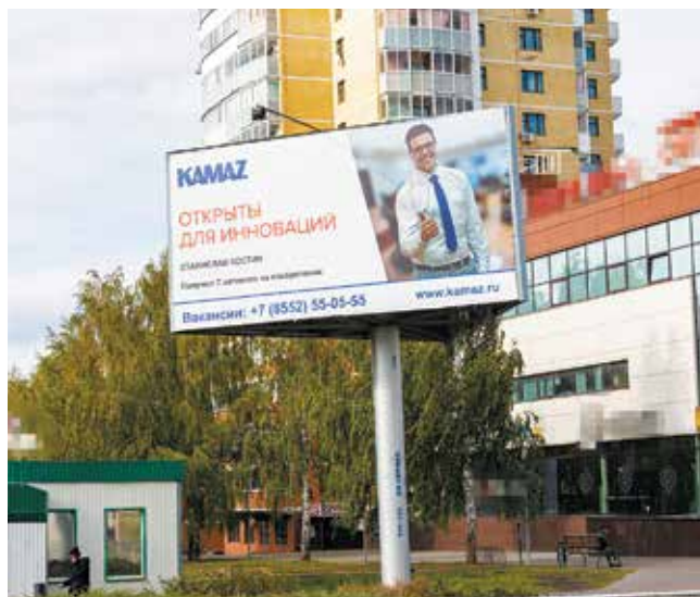
Кандидатов, достойных представлять ценности «КАМАЗа», выбирали сами сотрудники компании. Теперь о них узнает весь город

в НТЦ в конструкторский отдел трансмиссии бюро ведущих мостов. Так началась моя камазовская карьера. В процессе работы параллельно обучался, впитывал опыт на реальных задачах.