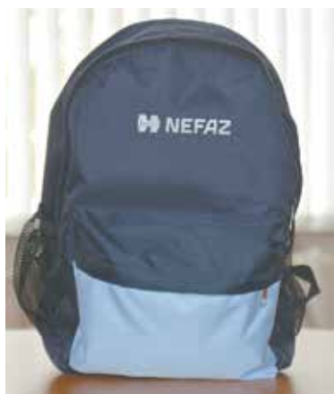
Всего роздано 6000 рюкзаков