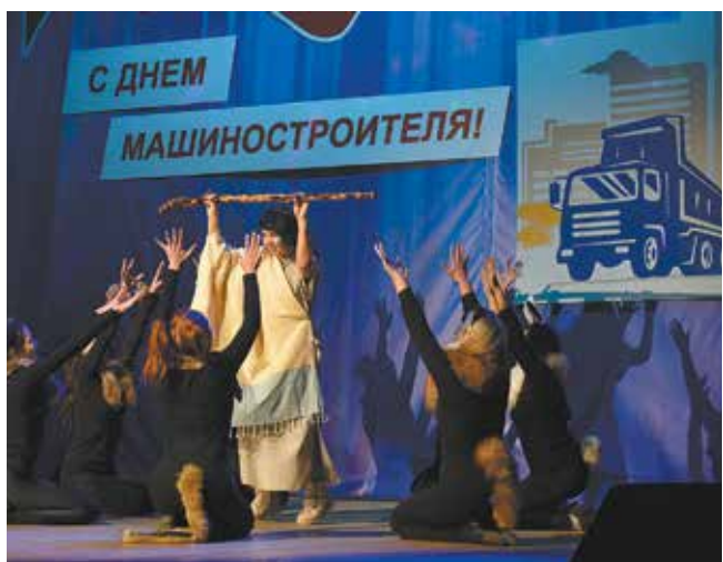
Основная мысль праздничной программы — даже в дикой природе надо оставаться человеком

Ну а после торжественной части заводчане вмиг очутились в дикой природе — начался концерт «В мире животных». Производственная саванна». «Сотрудники ПРЗ — как обитатели Красной книги, к сожалению, нас всё меньше. В дикой природе выживают лишь сильнейшие. Нас берегут и ценят, нам создают лучшие условия для жизни. И мы всегда рады каждому, кто захочет присоединиться к нашей стае», — такими словами начали свои выступления артисты художественной самодеятельности. Потому что эта стая — лучшая!