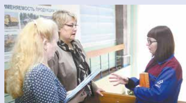
Специалисты подробно расскажут о корпоративной пенсионной программе

Подробную информацию о дате, времени и месте работы мобильных офисов можно узнать в кадровой службе и профкомах подразделений, организаций или в Набережночелнинском филиале НПФ «Первый промышленный альянс» по телефону 37-45-95 .