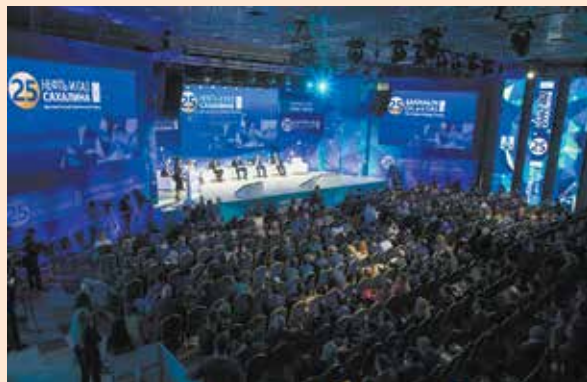
Форум «Нефть и газ Сахалина-2021»