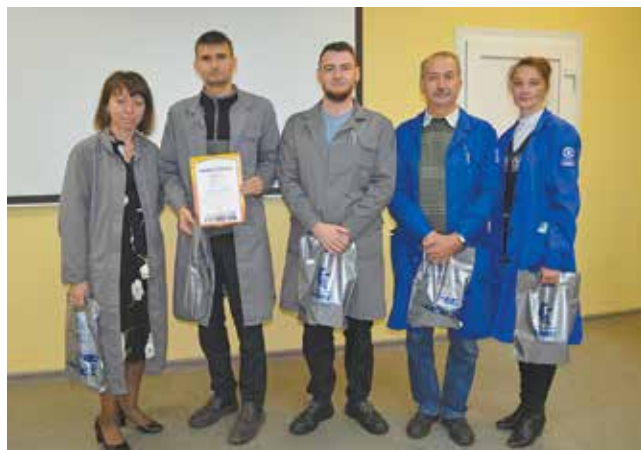
Самая эрудированная команда осенней игры «Пучок»

Почему-то никто из игроков не знал, что предновогодняя традиция наряжать ель у АБК-211 появилась в начале