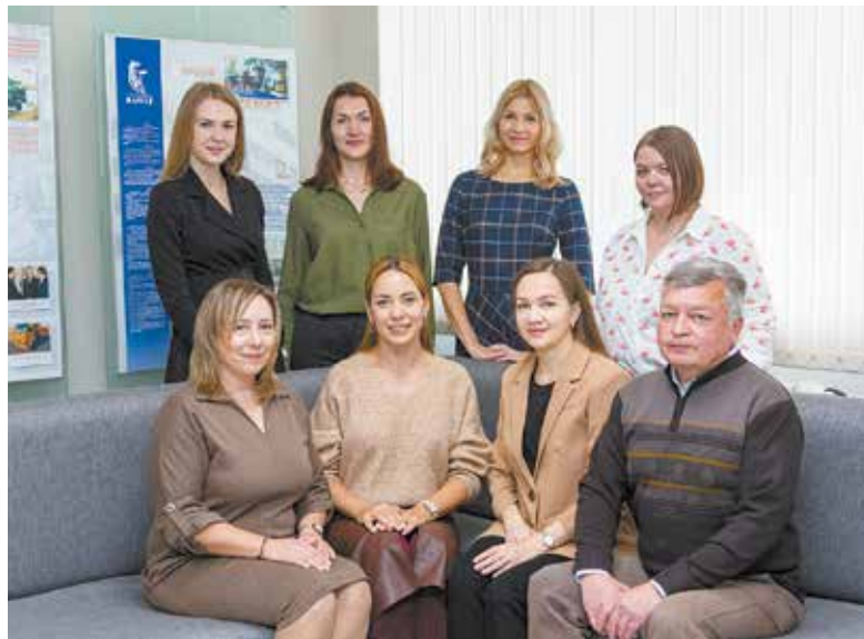
Команда технических переводчиков — люди образованные, культурные, умеющие логически мыслить

— От профессионализма технических переводчиков зависит успех