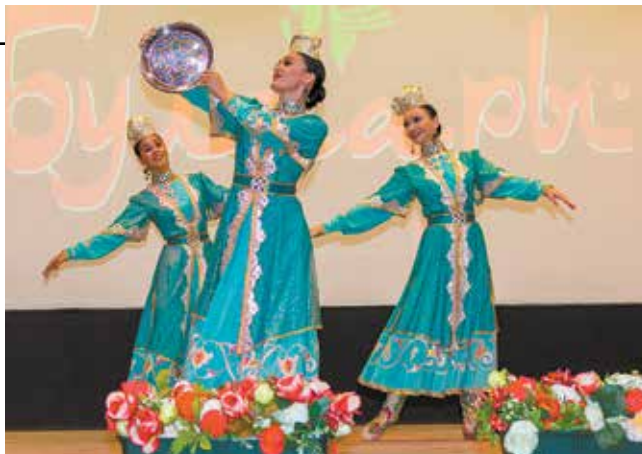
Грация артистки из «Булгар» пришлись по сердцу заводчанам

После официальной части перед заводчанами выступил прославленный челянинский коллектив — театр танца «Булгары». Артисты исполняли традиционные татарские танцы, пели песни и заряжали собравшихся позитивом. Движука на «движках» — мощнее некуда!