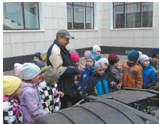
«Покажите, как завести грузовик!»

— Радость детей не описать словами, это проявлялось в восторженных взглядах и улыбках. Значит, с задачей рассказать о «КАМАЗе» мы справились.