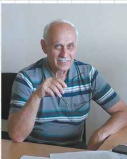
Отдел анализа качества и рекламаций

«КАМАЗ — великая машина. Завод — давно моя семья! Вот много лет мы с ним едины, КАМАЗ, завод — моя судьба!»