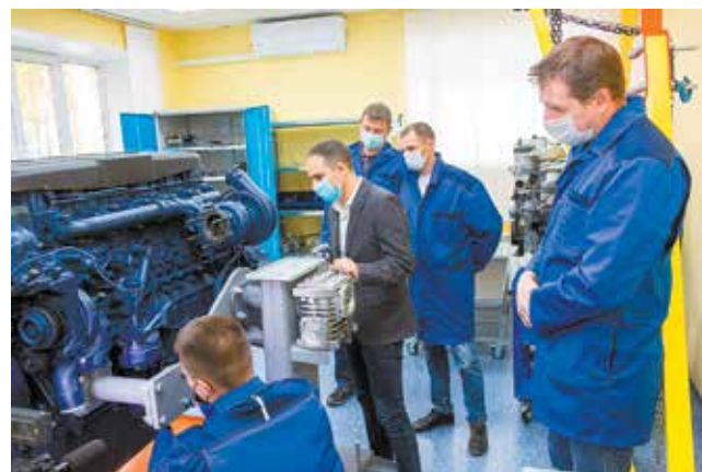
Идёт изучение двигателя

Обучают в МИТТУ и менеджмент «КАМАЗа» — с сотрудниками проводится либо предметная работа с каким-то оборудованием или программным обеспечением, либо курсы, связанные с коммуникативными навыками, управлением конфликтами, переговорами, бережливым производством, управлением качеством. И со сторонними ор-