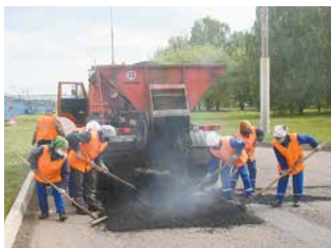
Укладка асфальта — одна из основных функций бригады

— В текущем году цех по ремонту и содержанию дорог, зелёных насаждений благодаря солнечной сухой погоде активно трудился весь сезон. Выполнены работы по ямочному ремонту дорог на территориях АвЗ, ЗД, ПРЗ, КЗ, ЛЗ. Произведён капитальный ремонт автостоянки № 4 около исполнительной дирекции, а также дорожные работы по инвестпроектам на ПРЗ. Расширена площадка стоянки № 3 для легкового транспорта, уложено асфальтобетонное покрытие на заездах к площадке КРИПАГЗ автомобильного завода. Также были выполнены ремонтные работы на территориях «КАМАЗэнергоремонта» и ТФК «КАМАЗ». Считаю, что коллектив с честью справился с поставленными задачами, и поздравляю всех с профессиональным праздником, желаю всем крепкого здоровья, успехов в труде и всего самого хорошего.