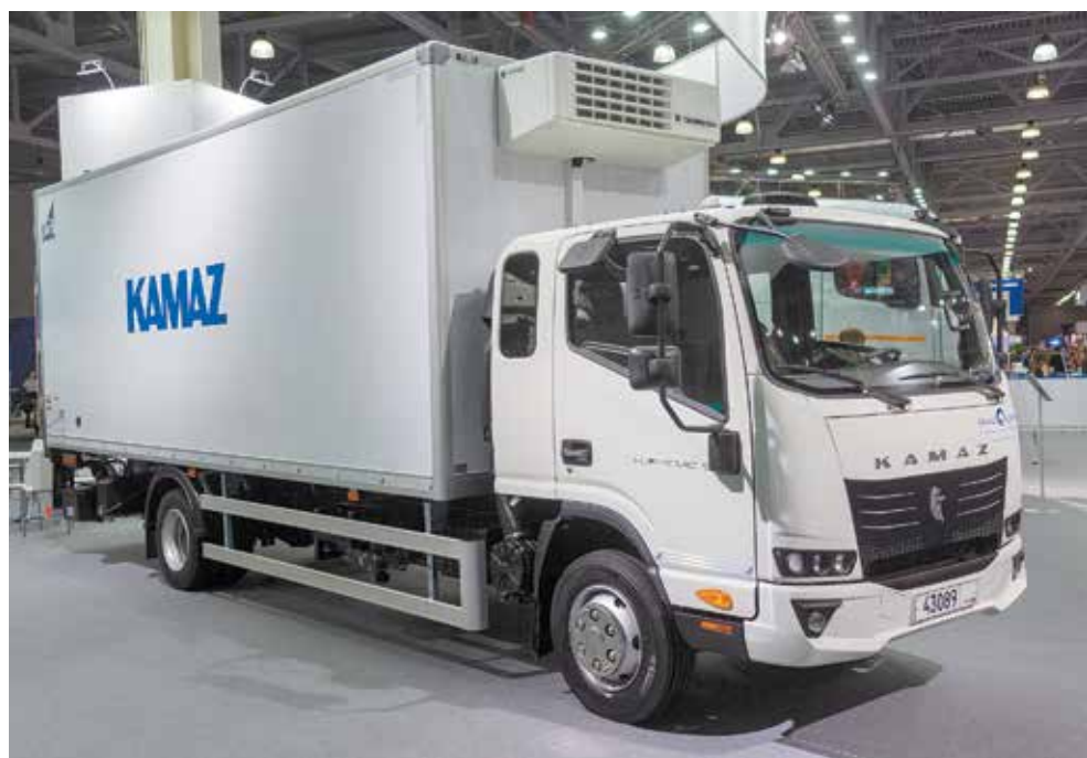
Среднетоннажный грузовик «Компас» был показан на «Комтрансе» в сентябре. А сейчас уже есть желающие обучиться работе на нём

— Мы всегда рады новым обучающимся. Потому что чем больше люди знают про «КАМАЗ», про процесс производства автотехники, тем лояльнее они к нам. И тем проще потребители принимают решение о покупке нашей продукции или о трудоустройстве на наши предприятия.