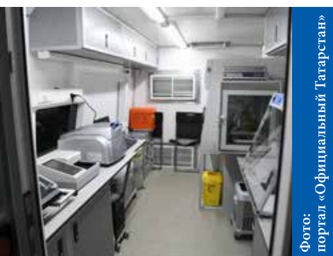
...а так внутри