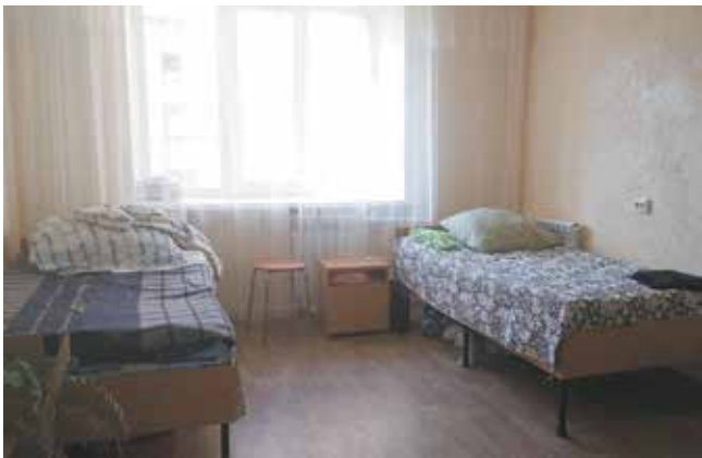
В комнате тепло и светло