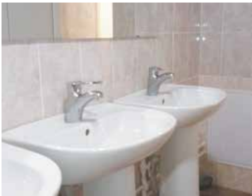
Санузлы чистые и просторные