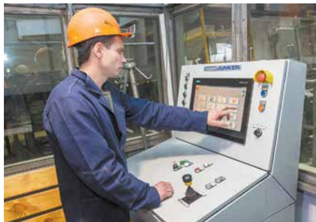
Автоматическое управление печью

Первые результаты и наблюдения выглядят многообещающими — литейщики задать жару готовы!