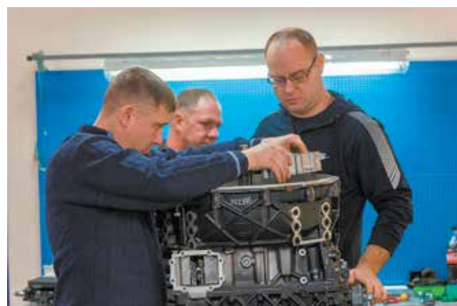
Разбор автоматической коробки передач

ганизациями тоже ведётся сотрудничество.