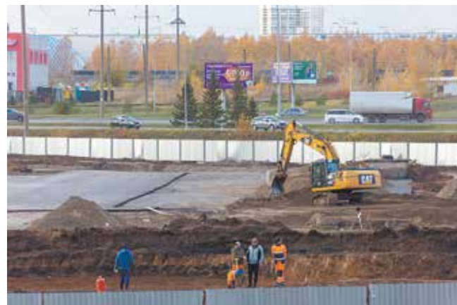
Строительство идёт полным ходом, и до конца года будет сдана первая очередь

— Окончание строительства — октябрь 2022 года. Но надеемся, что первая очередь, то есть несколько основных дорог, будут сданы уже в этом году, и мы начнём использовать полигон.