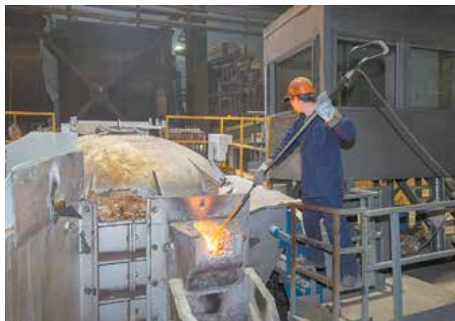
Идёт проверка температуры металла