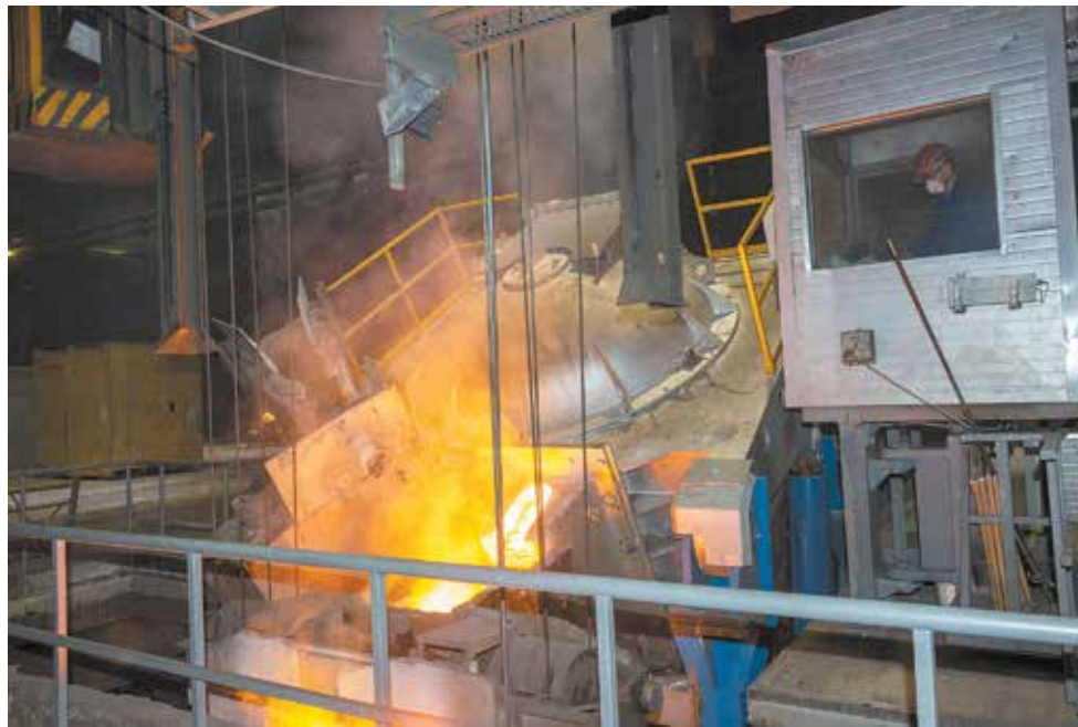
Благодаря этим печам высокопроизводительные формовочные линии снабжаются высококачественным металлом на постоянной основе

— Начнём с того, что новые печи работают намного