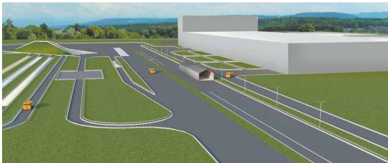
Так будет выглядеть готовый полигон