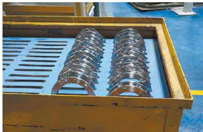
Спецтара не даёт крышкам соприкасаться, значит, до потребителя они дойдут без дефектов

И работа по улучшению на этом не заканчивается: в этом году усовершенствовали эргономику рабочих мест по сборке синхронизаторов. Были установлены дополнительные столы, стеллажи, ложементы для мерителя и инструмента, новые стулья с возможностью регулировки посадки индивидуально под каждого работника. Благодаря этим улучшениям производительность труда заводчан выросла, а работать стало удобнее.