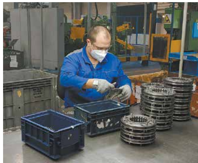
Работа сидя гораздо эффективнее — меньше устают руки, ноги и спина