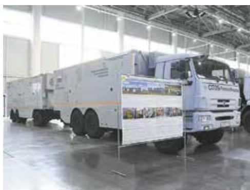
Так выглядит лабораторный комплекс снаружи...

По легенде в одной из стран, входящих в ВОЗ, произошла вспышка некой инфекции, и задача участников сводится к выявлению её возбудителя. Впоследствии отработанные на учениях действия определяют единые инструкции ВОЗ для противодействия распространению инфекции в любой стране.