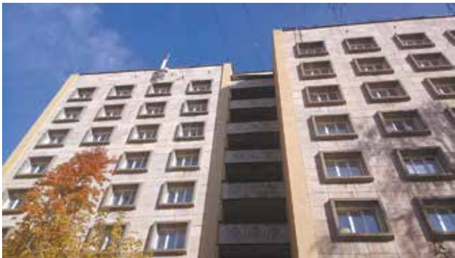
Общежитие 1/04, где проживают рабочие

Впрочем, заполняемость кампуса зависит от сезона. Зимой, например, и особенно в январские праздники общежития пустеют — большинство постояльцев уезжают к семьям. В целом же по году камазовский дом не страдает ни от недостатка