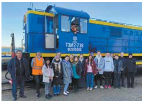
Рассмотреть тепловоз крайне интересно

После экскурсии было организовано посещение картодрома «КАМАЗ-карт».