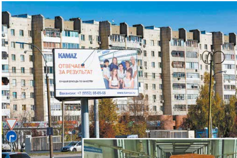
Лучшая бригада встречает при выезде с Сармановского тракта

Кабины грунтуют четыре работы, ещё восемь красят, а бригада № 121 задействована на грунтовке, окраске и дефектовке — они дорабатывают мелкие дефекты