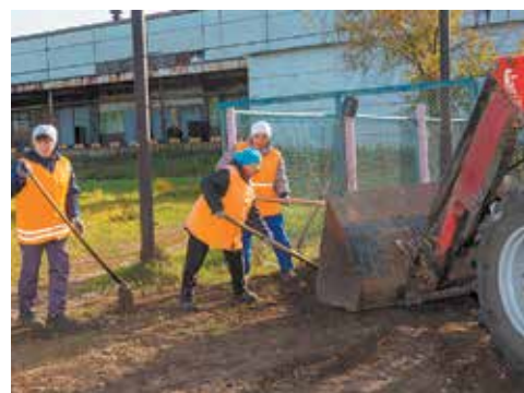
Придорожная территория тоже требует ухода