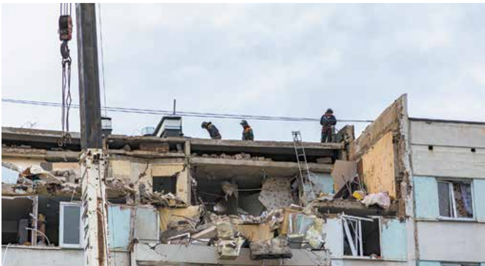
Четыре квартиры разрушены полностью

минали руины небольшого здания. Со стороны двора можно было разглядеть, что взрыв пробил дом насквозь: внешняя стена подъезда на несколько верхних пролётов была снесена напрочь. Дом тряхнуло так, что взрыв не только услышали, но и почувствовали все жильцы.