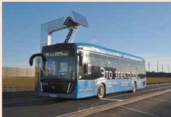
Электробус поехал и по Белгороду

Тестовая эксплуатация электробуса позволит на практике определить все плюсы этого вида общественного транспорта. А по итогам уже будет рассматриваться вопрос о дальнейшей закупке электробусов для Белгорода.