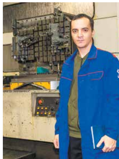
Багаж знаний у молодого рационализатора накоплен солидный

рами вас стали узнавать? Ваша жизнь как-то изменилась?