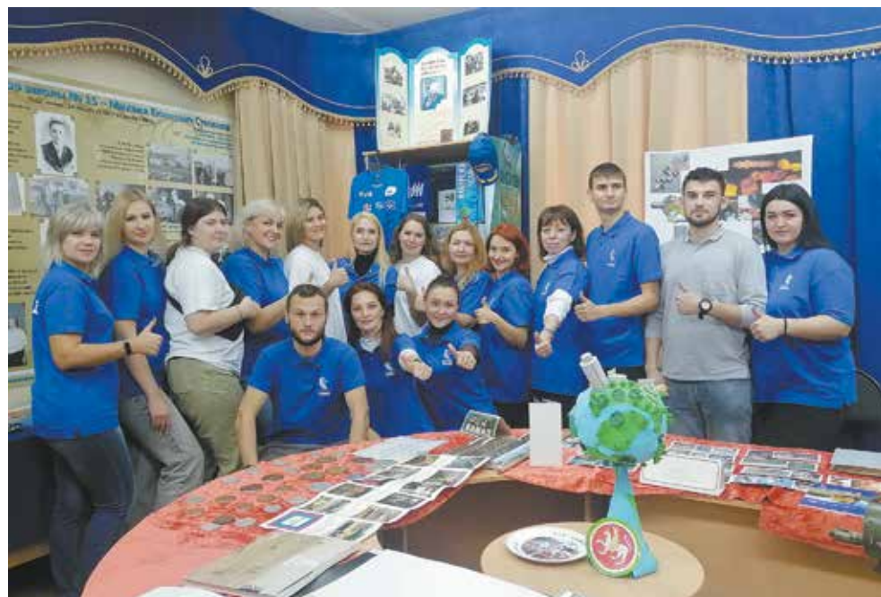
Молодёжный десант с кузнечного в подшефной школе № 15

Для учеников 5 и 6-х классов была предложена квест-игра «По-камазовски!» Семиклашки с удовольствием участвовали в спортивно-технической полосе препятствий «Авторалли». Кстати, это задание традиционно считается фишкой организаторов «Дней КАМАЗа» от кузнечного завода: оно спортивное и одновременно интеллектуальное. Так, на