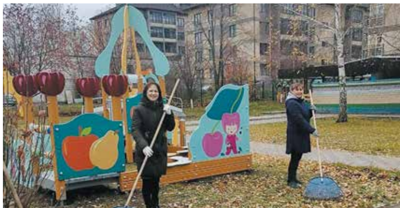
Здорово, когда есть возможность помочь!

С администрацией Дома ребёнка молодые прессоворамщики поддерживают тёплые дружеские отношения уже не один год. Коллектив учреждения в основном женский, поэтому сотрудницы рады любому содействию. И в этот раз они от души поблагодарили заводчан за оказанную помощь и пригласили в гости.