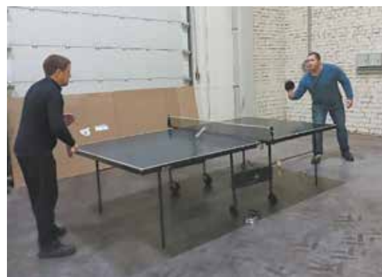
Победит тот, у кого реакция лучше