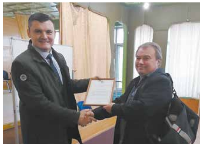
Накануне праздника 23 лучшим водителям были вручены награды