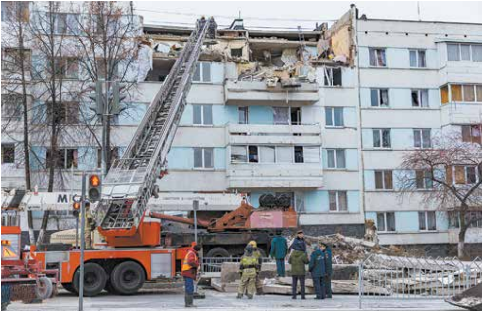
Утро после трагедии. Служба МЧС работает на месте происшествия

Финансовый ущерб от ЧП ещё предстоит определить, а также решить вопрос, какие из повреждённых квартир можно восстановить, а какие придётся демонтировать. Взрыв был такой силы, что крупные обломки железобетонных плит разлетелись с верхних этажей в радиусе не менее 60 метров, выбив даже стёкла киоска на противоположной стороне широкой улицы Татарстан. Остановка прямо напротив эпицентра, но тоже на другой стороне улицы, уберегла строения от больших повреждений, став преградой для летящих камней — внутри павильона, как в ловушке, оказалось множество осколков. Пострадали припаркованные на проезжей части машины, а груды бетона непосредственно под разрушенными квартирами напо-