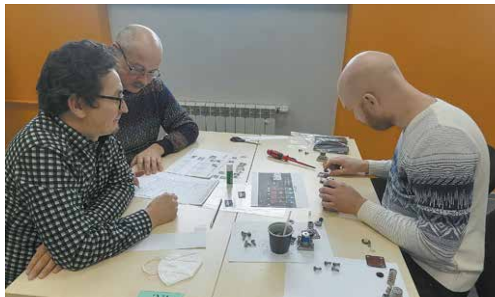
Чем лучше изучишь строение клапана, тем подробнее будет инструкция по его сборке

Первые итоги конкурса уже подведены — с видеокейсами справились все команды, а вот собрать клапан за отведённое время успела только половина. Имена победителей станут известны сегодня, 19 ноября, а главный приз — переходящий кубок — по традиции будет вручён на конференции мастеров и бригадиров.