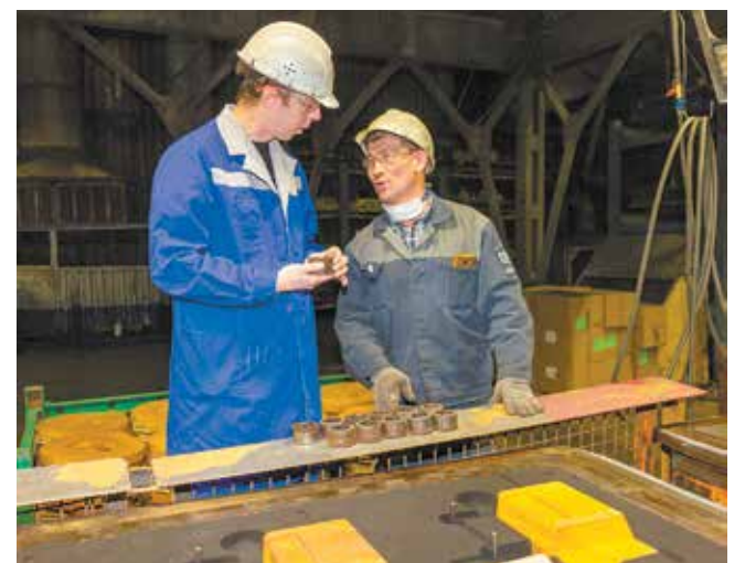
Без внимания начальника не останется ни один процесс

К слову, и наставник он тоже прекрасный: открытый, искренний. По словам