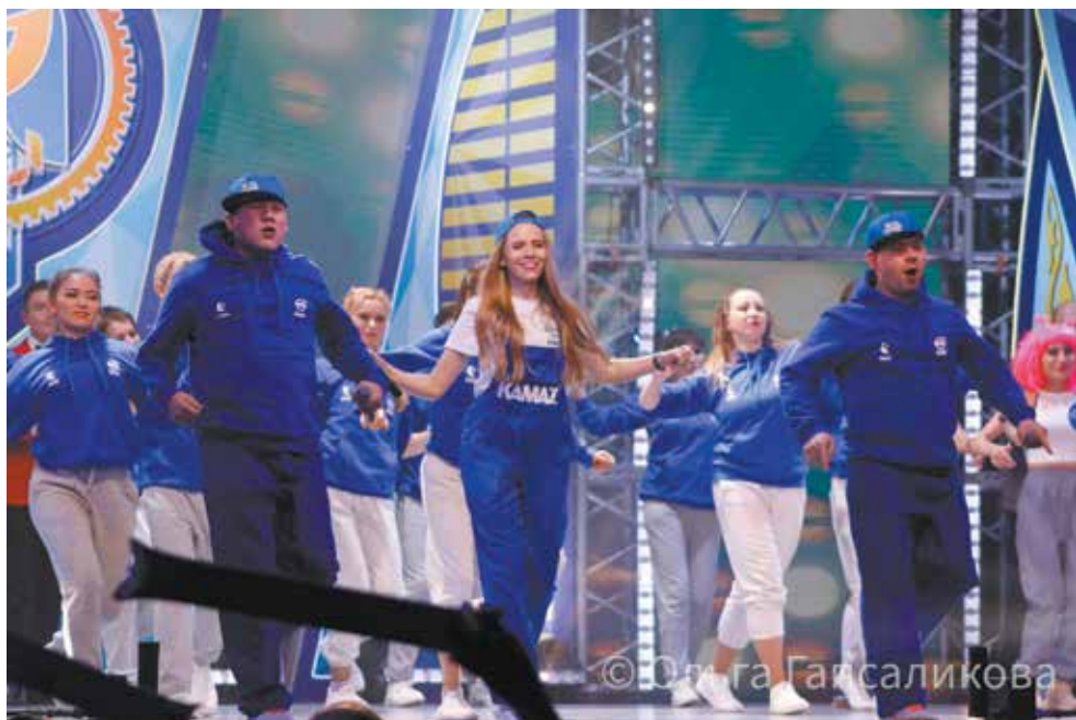
Камазовская команда завоевала победу талантом и напором