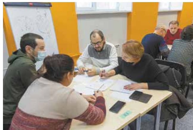
Командой решать видеокейсы проще