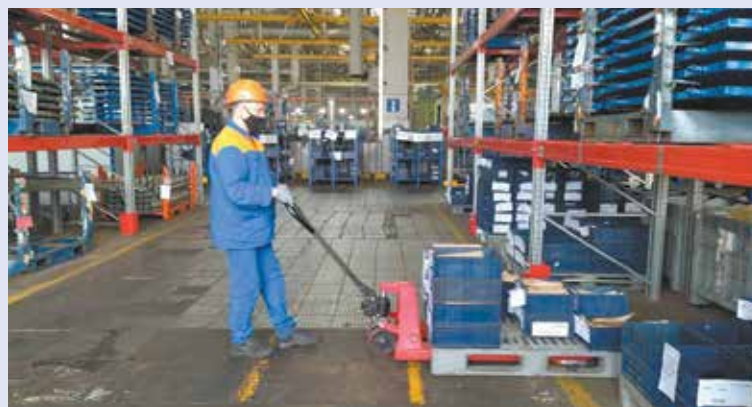
Новые приспособления экономят время

Благодаря применению тележек время выполнения операций транспортировки комплектующих изделий сократилось в среднем на 20%.