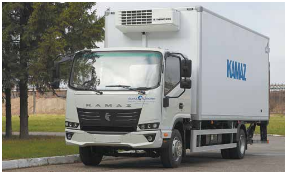
«Компас-9» — машина развозного класса

— У нас было несколько подходов. Один из них — собрать собственный автомобиль на узлах европейского производства. Тогда курс доллара был на уровне 33-35 рублей, и мы получали адекватную цену автомобиля на рынке России. Но из-за резкого двукратного повышения