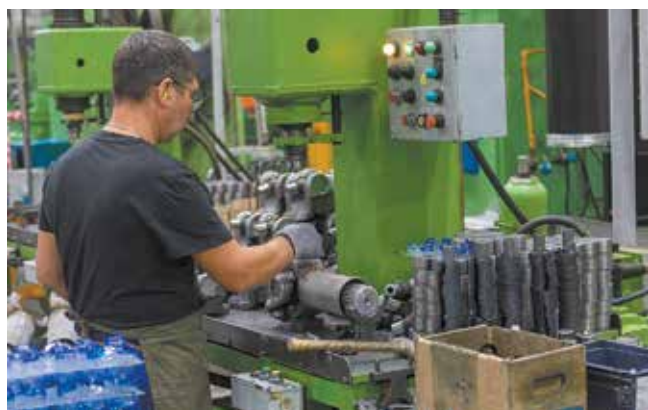
Охрана труда и здоровья работников — одна из задач профсоюза

— Сейчас проходят заседания колдоговорной комиссии, на которых рассматриваются новые предложения как со стороны профкома, так и со стороны администрации компании. Часть изменений уже были внесены в текущем году: например, компенсация затрат на проезд, также были актуализированы графики работ. На рассмотрении колдоговорной комиссии находится более 30 предложений.