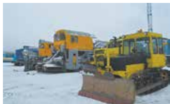
У «КАМАЗа» есть средства от непогоды

Тренировка проводилась на территории депо станции Автозаводская ООО «ПЖДТ-Сервис». По легенде учений в Набережных Челнах прошёл сильный снегопад, выпало 350 мм