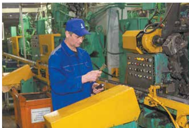
Доработанная линия обрабатывает детали самостоятельно, оператор занимается замерами

Присмотревшись, понимаешь: везде есть таблички, всё аккуратно, чисто и... ни соринки. Спрашиваем: это к нашему приходу субботник устроили? Работники смеются и говорят: «Нет, у нас так всегда. С нашим бригадиром не забалуешь: сам привык к порядку и нас приучил».