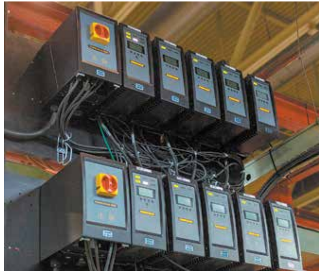
Если какой-то из гайковёртов выйдет из строя, система контроля даст знать световым сигналом