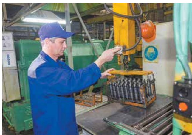
С таким приспособлением спина не заболит