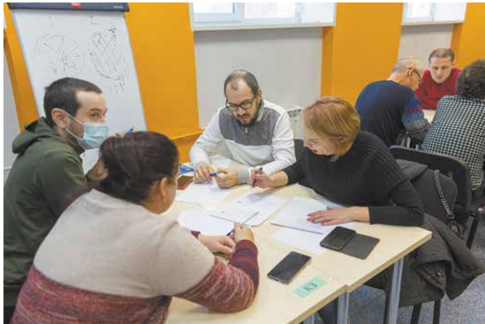
Команду кузнечного завода отличает основательный подход к решению задач

В этом году к конкурсу были допущены только те мастера, уровень компетенций которых соответствует требованиям компании. В следующем появятся дополнительные условия отбора участников. Рассматривается включение в критерии допуска к конкурсу показатель текучести персонала, поскольку работа с личным составом участка — одно из важнейших направлений профессиональной деятельности мастеров.