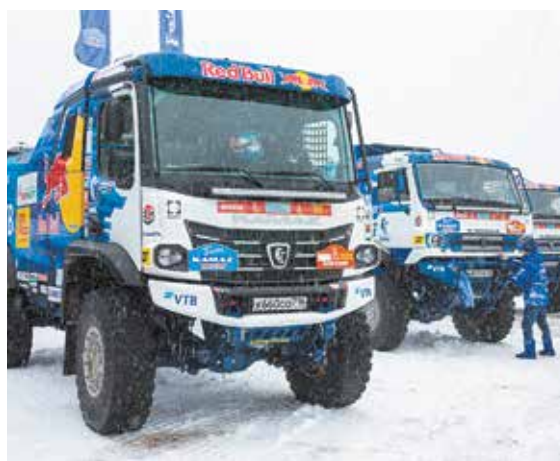
Новейшие КАМАЗы-435091 — серьёзная заявка на победу

После смотра машины команды «КАМАЗ-мастер» выдвинулись в Европу — к французскому Марселю, откуда на пароме отправятся на Аравийский полуостров.