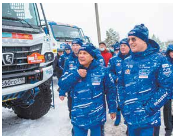
Если за рулём раллийного болида побывал Президент Татарстана, удача команду не оставит