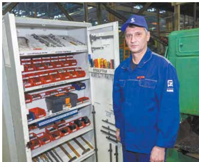
Доступ к шкафчику с инструментами разрешён каждому