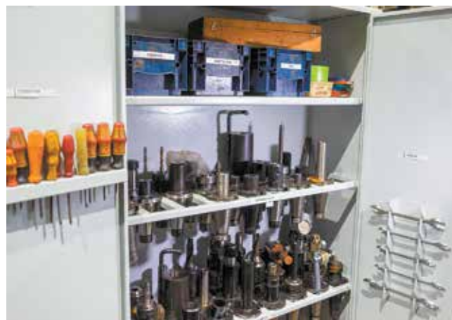
Когда инструмент разложен по полочкам, за его сохранность можно не волноваться

Появились здесь и шкафы для межоперационного задания и подготовки деталей на запасные части. Такое удобное место хранения ограниченным доступом позволяет при необходимости быстро найти нужные заготовки и запустить их в обработку.