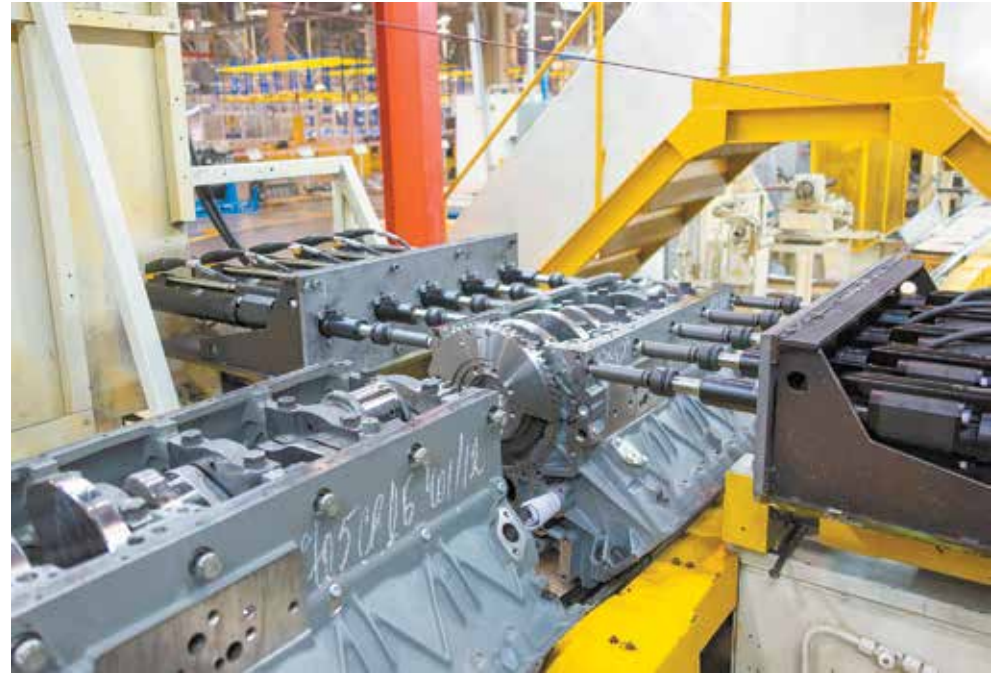
Atlas Copco в действии: боковые болты затянуты накрепко

Плюсов у нового оборудования множество. Система Atlas Copco строго следует параметрам, которые заложены в требованиях к кре-