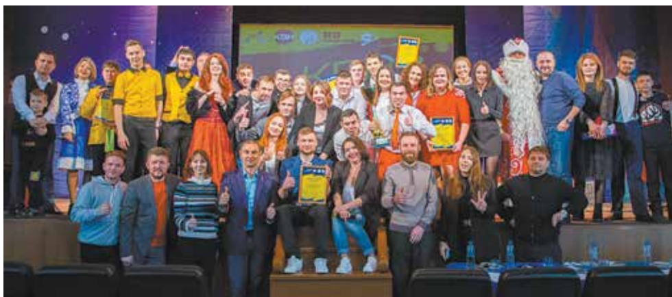
Все участники седьмого сезона Лиги работающей молодёжи КВН города Набережные Челны