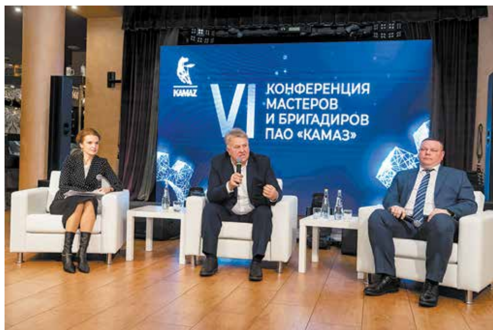
Прямой диалог — уникальная возможность получить от топ-менеджеров ответы на самые волнующие вопросы

— В компании всегда поддерживали мастеров, выросших из рабочих. Они хорошо знают и производство, и коллектив. Но молодые выпускники тоже нужны, у них