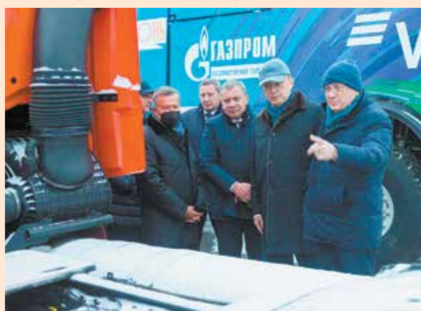
Стоит вопрос о масштабном внедрении газовой техники на рынок