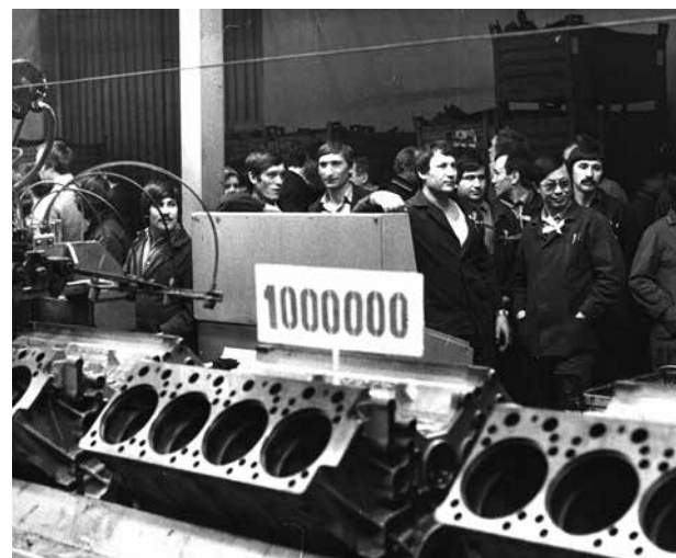
Миллионный двигатель встречали торжественно, с митингом

А ещё через 10 лет, 13 декабря 1986 года, был собран миллионный двигатель КАМАЗа. В честь этого события на главном конвейере завода был организован торжественный митинг, в память о нём были изготовлены специальные медали.