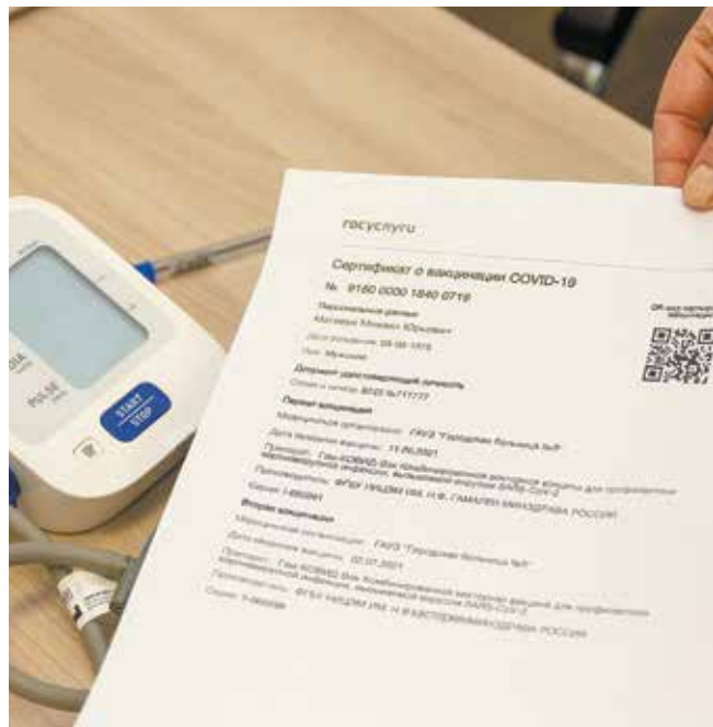
За подделку сертификата о вакцинации медработнику грозит дисциплинарная и уголовная ответственность. Не уйдёт от закона и купивший фальшивку

Однако покупатель может быть привлечён и по другой уголовной статье — «Нарушение санитарно-эпидемиологических правил». В зависимости от последствий за проступок может быть назначен либо крупный штраф, либо ограничение или лишение свободы. Если человек с «липовой» справкой заразит другого и тот погибнет от коронавируса, это можно трактовать как преступление, повлекшее по неосторожности смерть человека, а это уже до пяти лет колонии.