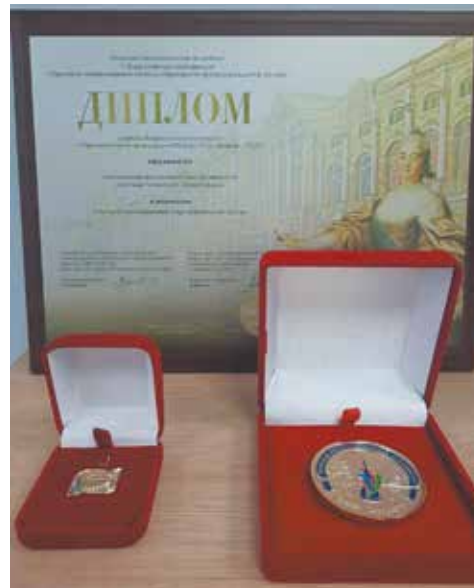
«Кванториум» признан лучшим в номинации «Лучший инновационно-образовательный центр»

А ещё АНО «Кванториум» стал одним из организаторов XII Всероссийского молодёжного форума «Профдвижение».