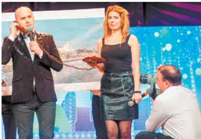
Съёмка новогоднего поздравления от Президента России: