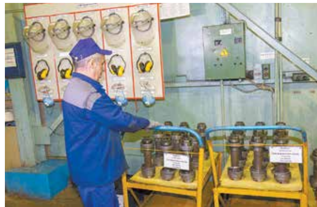
В бригаде 411 знают: порядок можно навести только своими руками

Что ж, когда везде всё в порядке, и детали получают отличные!