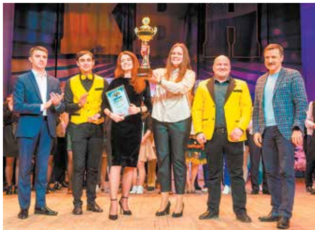
Своими шутками ребята из НТЦ завоевали кубка чемпиона КВН «КАМАЗа»