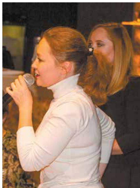
Автогигант всегда был в зоне пристального внимания журналистов

Сделали много, но в следующем году хотим сделать больше — таким кратким тезисом можно обозначить итоги прошедшей встречи.