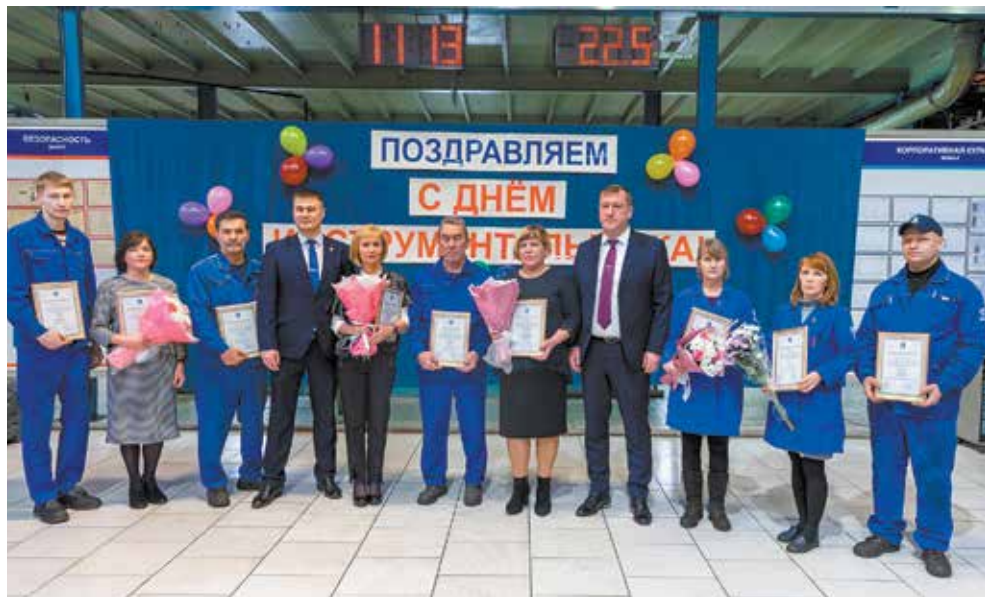
Успехи ризовцев отмечены наградами