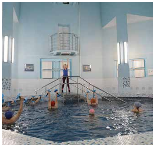
Занятия в бассейне придутся по душе многим

Объём услуг, входящих в стоимость путёвки по программе «Трёхдневный оздоровительный тур», в целом одинаков во всех санаториях и включает проживание, диетическое питание, терренкур, приём минеральной воды, бассейн, фиточай, тренажёрный зал, прокат спортивного инвентаря и вечерние развлекательные программы. Дополнительное обследование и иные лечебные процедуры предоставляются за дополнительную плату после консультации врача санатория.