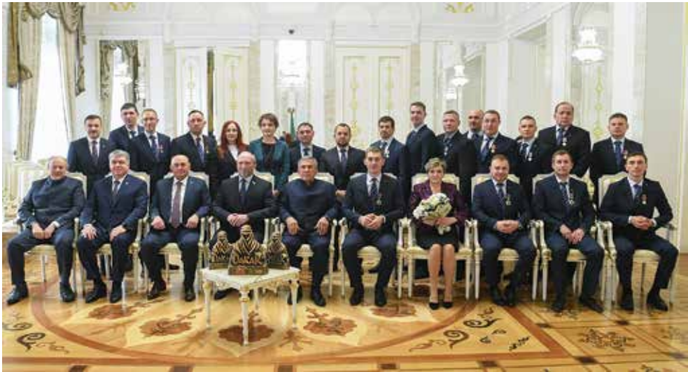
В Казанском кремле победителей «Дакара» встретили со всеми почестями

Напомним, «Дакар-2022» завершился 14 января, «КАМАЗ-мастер» одержал