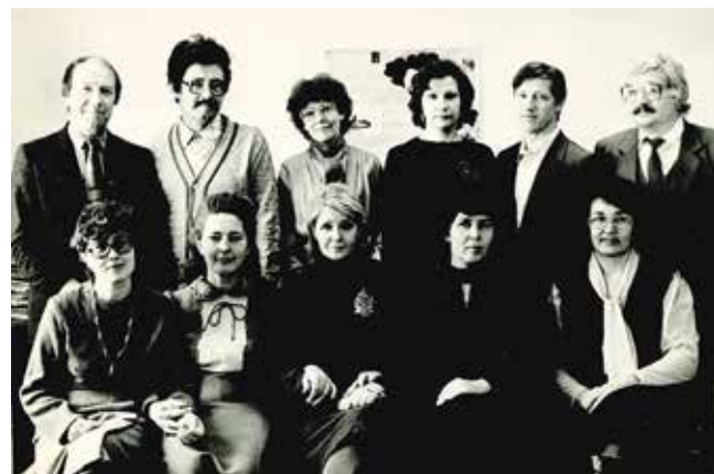
Основной состав редакции «Рабочего КАМАЗа», трудившийся во время строительства первой и второй очередей «КАМАЗа» и Нового города

Я придерживаюсь такой же точки зрения. Поэтому я старался вложить всё, что имел как журналист, в каждого из своих сотрудников. Надо сказать, что многие преобразались буквально на глазах: они стали понимать, что для того, чтобы хорошо писать, нужно, во-первых, много работать, а во-вторых, ориентироваться, что пишет редактор и как он пишет.