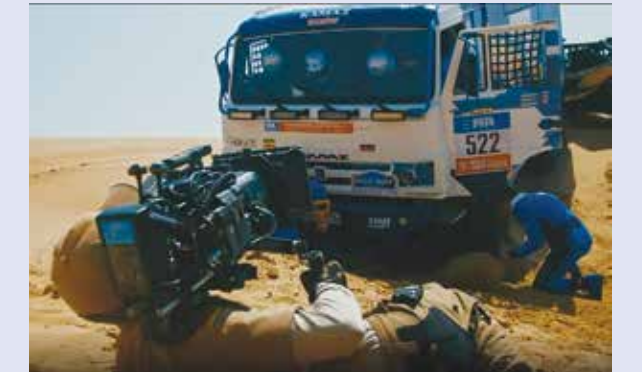
Легендарная команда гонщиков даёт режиссёрам обширный сценарный материал