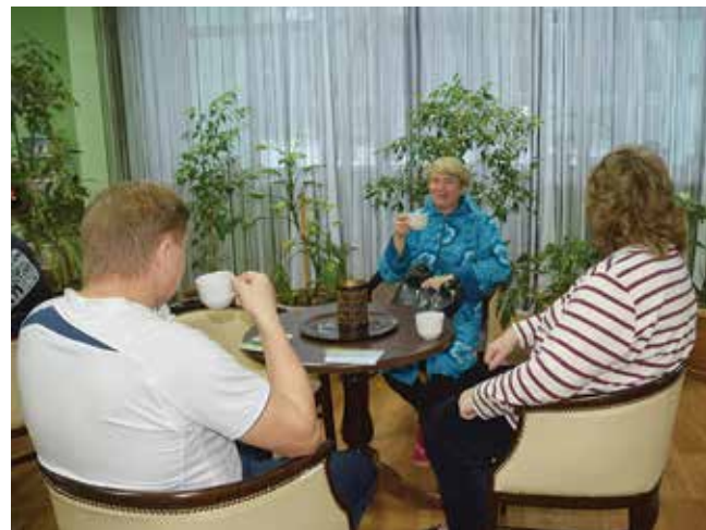
После активного времяпрепровождения восстановит силы лечебный чай