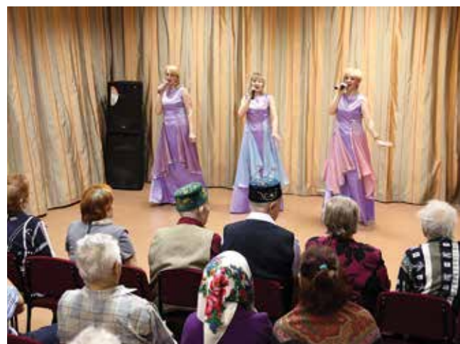
Выступления артистов всегда поднимают настроение