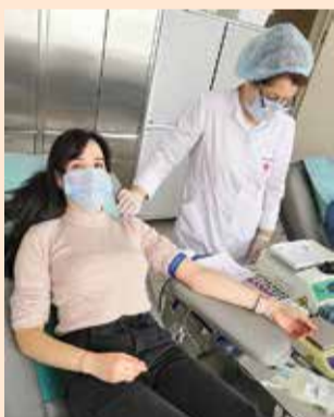
Сдача крови спасёт чью-то жизнь

В этот раз в акции приняли участие 25 человек. Из них пятеро — постоянные доноры, а остальные 20 камазовцев пришли сдавать кровь впервые. В общей сложности удалось собрать свыше 11 л крови.