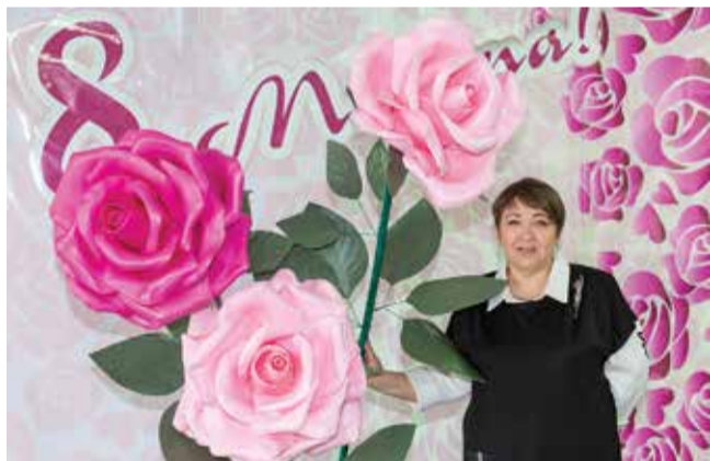
Фотозоны от Светланы Сaitхаджаевой создают настроение на все праздники

Впрочем, учитывая, какую красоту Светлана делает из обычных, казалось бы, вещей, можно быть уверенными: бумаге в доме быть!