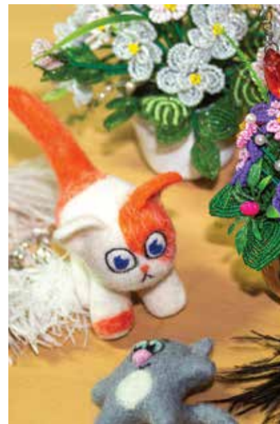
Сразу видно — сделано с любовью!

— Я сшила кукол для кукольного театра в ДК «КАМАЗа», когда девочки из «молодёжки» готовили спектакль. Детишкам очень понравилось! На Масленицу всегда куклы с меня. Правда, как их сжигают, не смотрю — жалко, хоть для того и создавались. Участвую в организации заводских праздников, к Новому году, например, занимаюсь украшением фойе в АБК-06, а в этом году к 8 Марта для фотозоны смастерила из изолон большие ростовые цветы.