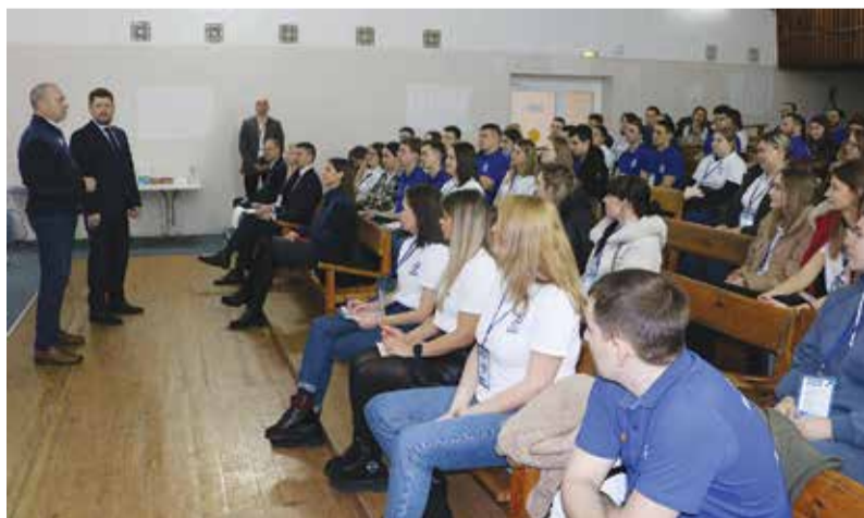
Молодёжный семинар поможет в личностном развитии, и в карьерном

На «КАМАЗе» состоялся VII молодёжный профсоюзный семинар. С 1 по 3 апреля на площадке оздоровительного комплекса «Саулык» молодые активисты и профлидеры отрабатывали навыки командной работы, решали кейсы по разрешению конфликтных ситуаций и не только.