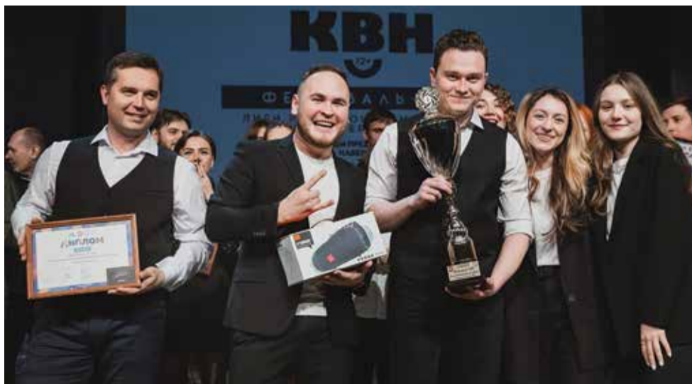
«Нелогичных» к вершине привели усердная командная подготовка и стремление победить

Ребятам удалось смешно обыграть современные жизненные ситуации, и неудивительно, что центральной фигурой при этом стал сахар. Также шутили на злободневные темы: санк-