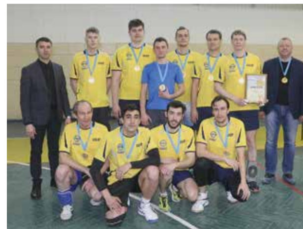
Чемпионы-2022 по волейболу — команда БЗГД — ДР

По результатам двух финальных матчей определились лидеры: 3-е место занял завод двигателей, на два очка обыгравший соперника, а 2-е осталось за автомобильным заводом. Победителем же турнира по волейболу стала команда БЗГД — ДР.