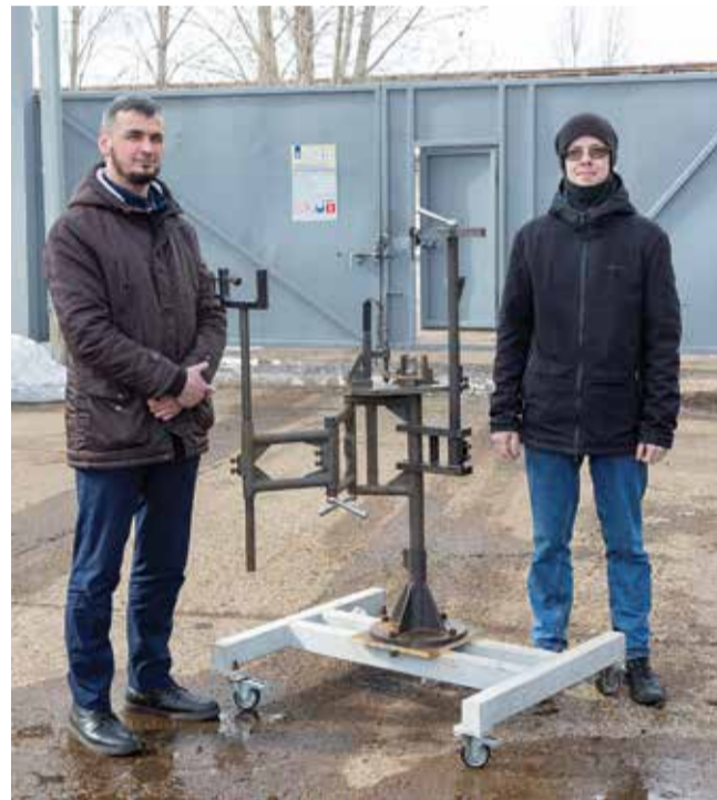
Стоимость изготовления приспособления составила примерно 250 тыс. рублей, заказ выполнили на РИЗе. В ближайшее время планируется тиражировать сварочное приспособление на рабочих постах