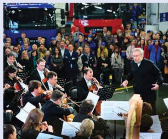
На заводских площадках maestro Гергиев уже выступал. На очереди — многотысячный городской майдан

Подготовкой площадки займётся муниципалитет: согласно регламенту мероприятия, город возьмёт на себя информирование населения, монтаж сцены, обеспечение порядка и медицинского сопровождения концерта.