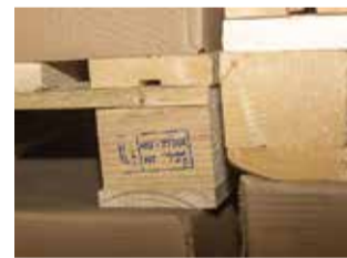
Печать стоит — значит, деревянные части тары прошли фитосанитарную обработку

За три месяца кроме испытания опытных образцов была собрана и проанализирована информация о разных видах упаковки, проведена закупочная процедура, заключены договоры с поставщиками новой тары, составлена справка