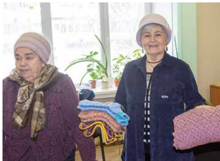
Ветераны «КАМАЗа» вложили в подготовку подарков и душу, и мастерство

Среди пар носков, принесённых в дар, нет одинаковых, каждая со своим орнаментом. Есть традиционного бежевого цвета, которые больше подойдут для мужчин, а бирюзовые, фиолетовые и оранжевые наверняка поднимут настроение дамам.