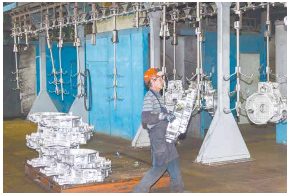
Транспортировка — вопрос, над которым ещё стоит подумать

было непросто, она потянула за собой изменение двух установок. Но с помощью конструкторов у нас это получилось. Вентилятор теперь нашего производства, и устанавливается он за счёт болтов, которые закручиваются гайковёртом. Теперь на линии для этого достаточно одного работника вместо двух. И для вентиляторов с электромагнитной муфтой не нужен провод — таким образом исключается дефект. В результате уменьшились трудоёмкость и время сборки, скорость конвейера выросла.