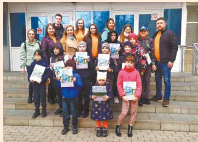
Этим ребятам сейчас очень нужны поводы для улыбок

Всего картину посмотрели 17 детей. Билеты были бесплатно предоставлены кинотеатром «Иллюзион».