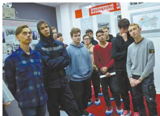
В музее студенты узнали об истории завода