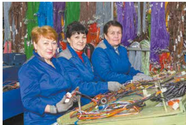
Конец ноября 2021 года. Видно, что в цехе пучков и проводов тепло, работа спорится, настроение отличное

Непосредственно с момента отключения подачи тепла начинается кропотливая подготовка к следующему отопительному сезону. Специалистам предстоит выявить потенциально слабые места, провести плановые ремонты и обслужива-