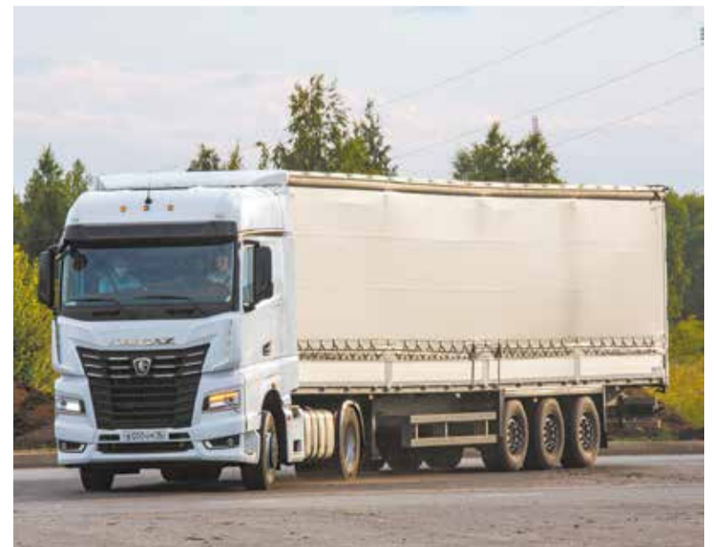
К5 — тот продукт, который позволит «КАМАЗу» зарабатывать и развиваться

Сейчас себе и «КАМАЗу» желаю мирного неба над головой. Это не пустые слова, погода в нашем общем доме определяет все решения по развитию. А ещё скорейшего возобновления производства К5. Выпуск этого продукта решит вопросы и обеспечения занятости, и повышения заработной платы, и развития технологий. Каждый месяц мы включаем в план по сборке порцию тягачей этого поколения в количестве 50-60 штук. Чтобы руки помнили, как их собирать надо.