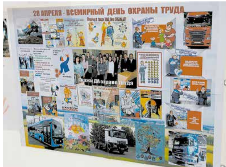
Тема охраны труда может заиграть, если в газету включить вместе с плакатами пословицы, поговорки и коллективный портрет

Победители награждены медалями, памятным кубками в виде сов, а все участники — презентом от профсоюза блока развития.