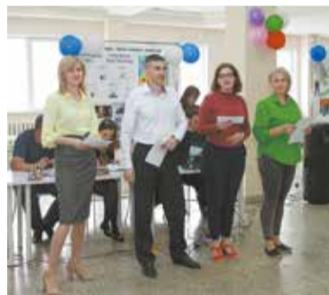
Творческий номер растопит сердца и ююри, и коллег

Фотоколлажи, стенгазеты с слозунгами и поэтическими строч-