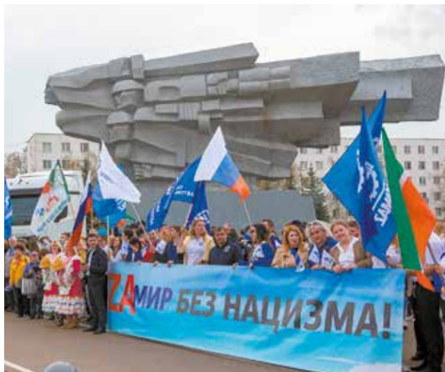
Автоград искренне поддержал идею автопробега

ске, Красноярске и Екатеринбурге. И везде её горячо приветствуют: внешняя угроза сплотила народ и вовлекла в общероссийскую повестку. «За мир! Труд! Май!», «За мир без нацизма!» — для всех нас это особенные, очень важные слова.