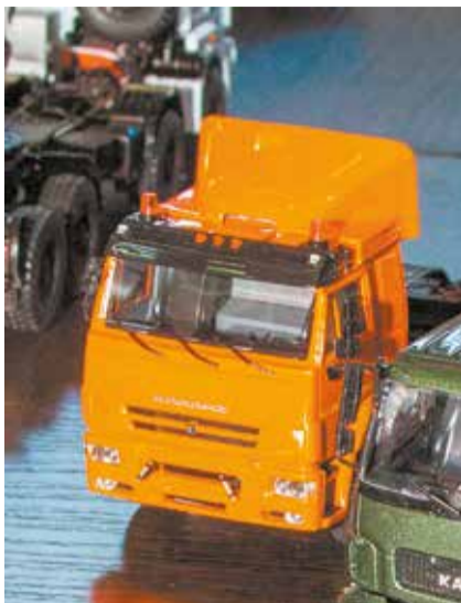
Седельный тягач КАМАЗ-6460 Максима Пономарёва лучший

который представил седельный тягач КАМАЗ-6460 третьего поколения.