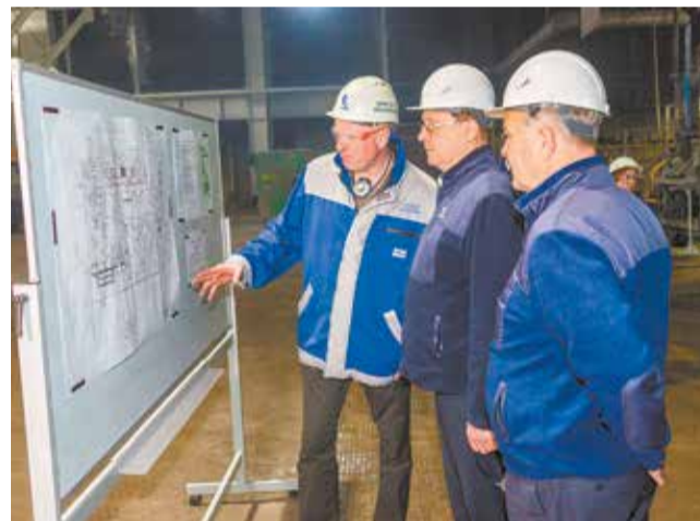
Согласно задумке, закупленное в рамках модернизации оборудование многофункционально: и нужды «КАМАЗа» обеспечит, и для клиентского проекта подойдёт

казалось невозможным. Все работают с азартом и понимают, что нам не нужно ни у кого ничего