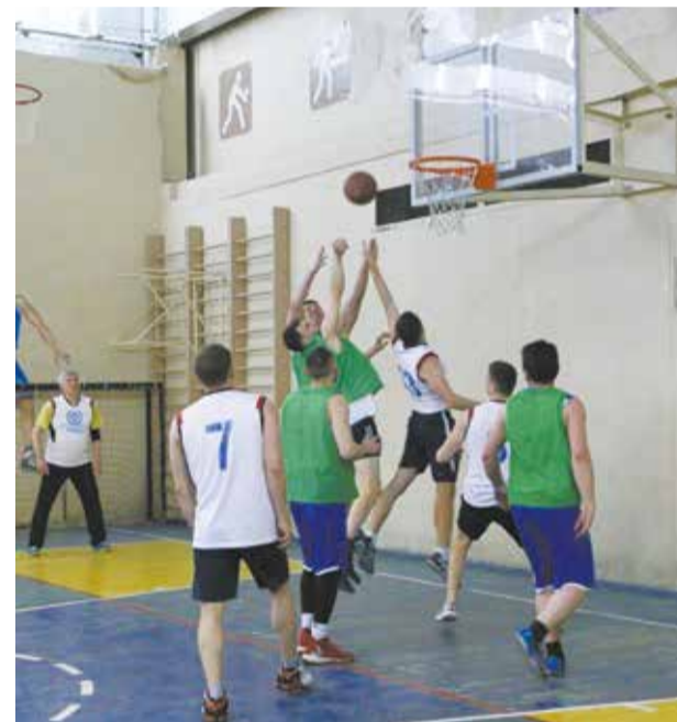
Первенство в баскетболе «движки» не отдали

Продолжится Спартакиада после майских праздников первенством по мини-футболу и легкоатлетическим кроссом.