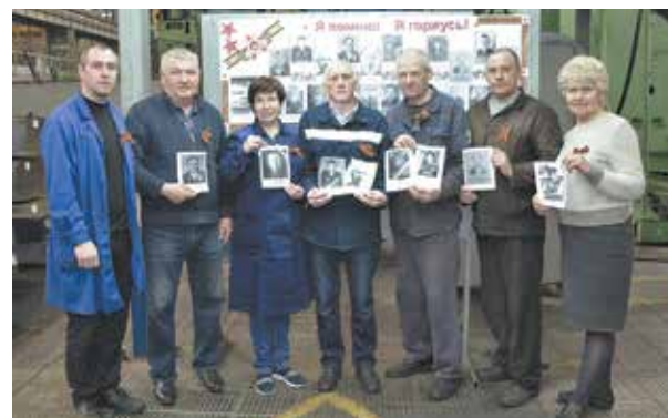
Благодарные потомки сквозь года несут священную память о героях войны