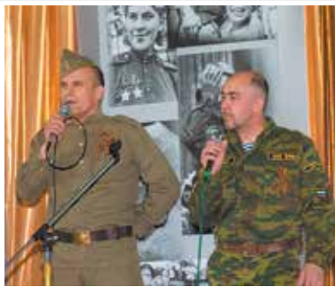
Даже знакомые песни в канун Дня Победы звучат по-особенному

Отечественной войне почтили минутой молчания и возложили цветы к мемориалу — ставшему уже родным солдату, отлитому из стали.