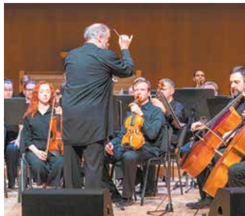
Взмах палочки маэстро — и звучит музыка

усилия, чтобы «КАМАЗ» по-прежнему работал, выпускал необходимые России грузовики и продолжал музыкальные и культурные традиции праздника диджи нашего города при содействии замечательных музыкантов симфонического оркестра под управлением Валерия Гергиева.