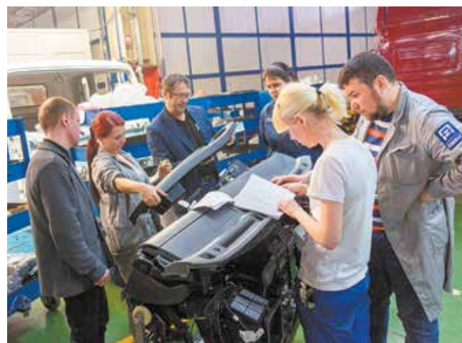
Изучение крепления панели приборов

собирать внутри кабины. Чтобы изучить процесс, мы это делаем на отдельной позиции, а позже, возможно, часть сборки будет производиться отдельно, часть внутри кабины.