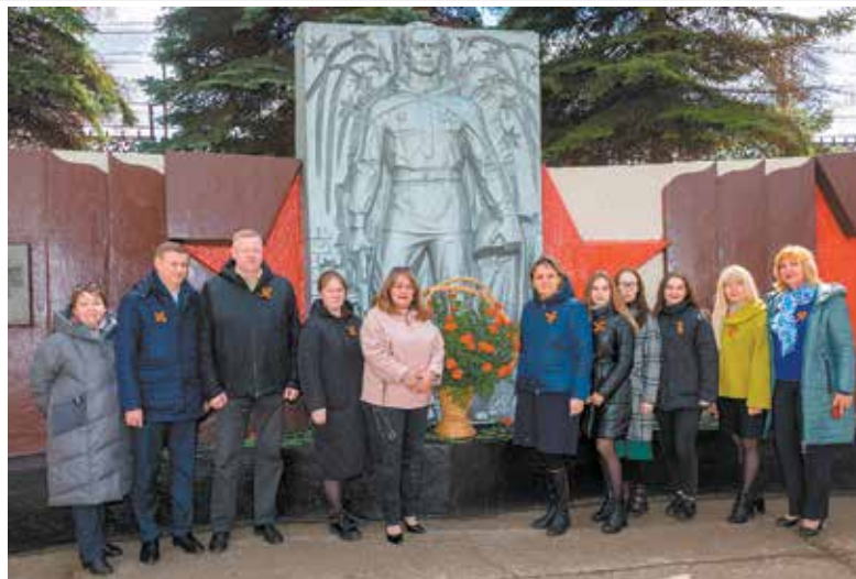
Традицию собираться у мемориала Славы литейщики не нарушают

А после состоялся праздничный концерт — заводчане в трогательных стихотворениях и песнях говорили о любви к Отчизне, о том, как важно нести сквозь года память о тех, кто боролся за наши жизни и свободу ценой своих по-