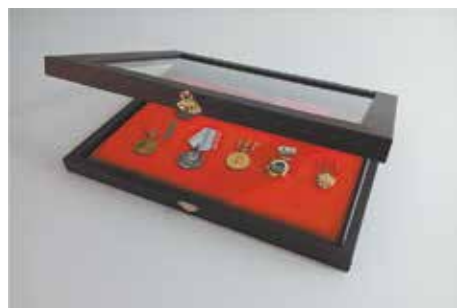
Все ветераны ПРЗ получают такие медальницы

После праздничного концерта для Тамары Фёдоровны была организована экскурсия по заводскому музею. На память о встрече ей вручили медальницу для хранения наград. Семь шкатулок заводчане изготовили специально к празднику. В ближайшие дни они будут вручены и другим ветеранам войны, работавшим на ПРЗ.