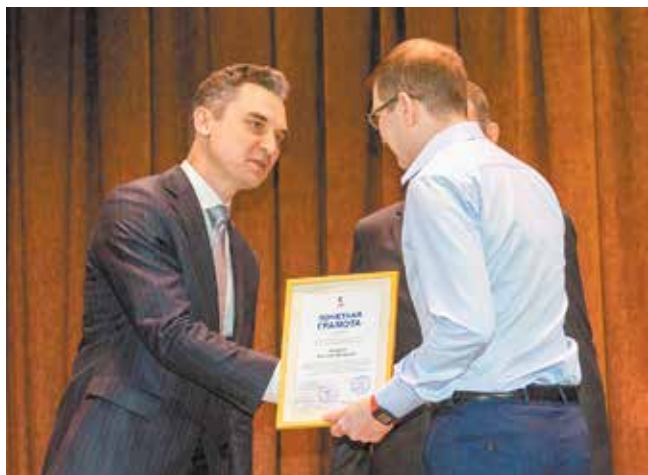
Почётной грамотой ПАО «КАМАЗ» наградили десятерых конструкторов

Конструкторы «КАМАЗа» уже в 52-й раз отметили свой профессиональный праздник. 28 апреля они собрались в актовом зале «КАМАЗ-мастер».