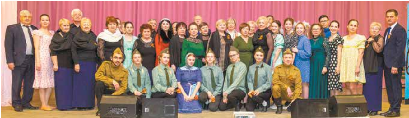
Руководство завода и творческая группа постарались сделать 77-ю годовщину Победы яркой

Много песен на концерте было спето о войне — русских и татарских, грустных и задорных. А в завершение вместе с артистами выступил хор Совета ветеранов завода двигателей с песней «День Победы». Мы — помним!