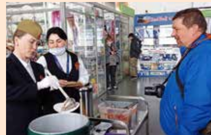
Отведаете солдатской каши!

В честь празднования Дня Победы с 1 по 31 мая для ветеранов Великой Отечественной войны действуют специальные условия обслуживания от аэропорта в VIP-зале, предоставление питания и напитков перед вылетом, прохождение контроля безопасности в приоритетном порядке. Для получения услуги пассажиру достаточно предъявить документ, подтверждающий его статус. Вместе с ветераном VIP-зал может посетить один сопровождающий.