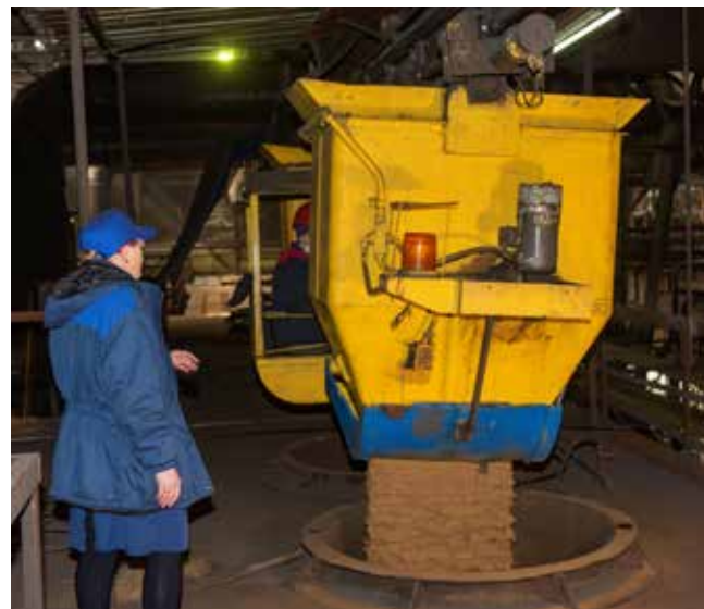
Один из этапов приготовления стержневой смеси

И это только малая часть из внедрённых в производство улучшений — всего сразу и не упомянуть. Но очевидно одно: лучшим эталонным производственным участком смесеприготовления назван совсем не просто так. К слову, в целом