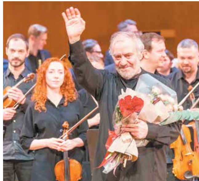
Валерий Гергиев: «До новой встречи, Челны!»

— Музыка, которая звучала в лучших залах мира, зву-