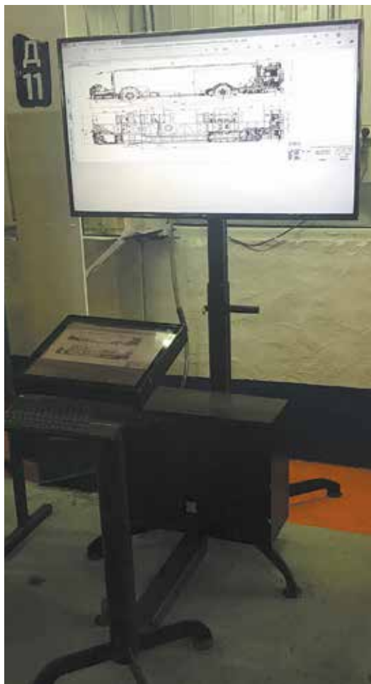
Набери вопрос — и получишь соответствующую видеоинструкцию

В дальнейшем база знаний будет пополняться, охватывая всё большее число сборочных операций. Также посредством информационных центров нефазовцы смогут получать доступ к корпоративным ресурсам, в частности информационной системе «ОМЕГА» и сайту «Орбита».