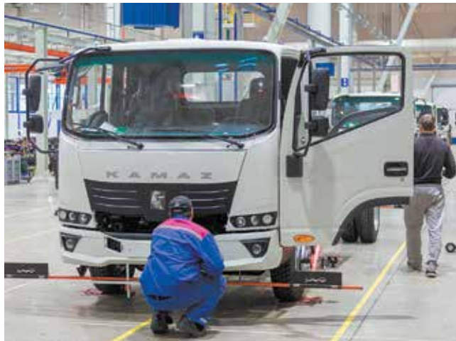
Готовая кабина выглядит так

Сборка первой кабины для 12-тонного «Компаса»