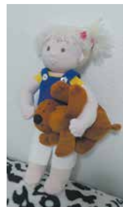
Питомцы есть и у кукол

— Когда-то пробовала рисовать на имбирных пряниках — увидела в интернете, заинтересовалась. Ну и я художественную