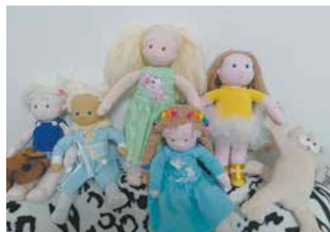
Эти малыши с нетерпением ждут встречи со своими владельцами

можно сказать, на техобслуживании — для каждой она постоянно обновляет гардероб. Шьёт платья, футболки, брюки и юбки.