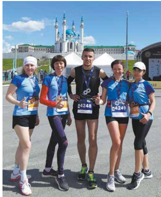
Эта пятёрка — лишь часть большой команды «НЕФАЗа», участвующей в Казанском марафоне. Дистанцию взяли!

— Ещё год назад я и представить не могла, что осилю 10 км. А теперь уже задумалась о полумарафоне. В этом немалая заслуга нашей профсоюзной организации, что регулярно проводит беговые мероприятия. Особенно проверил нас на выносливость проект «Бегущий НЕФАЗ».