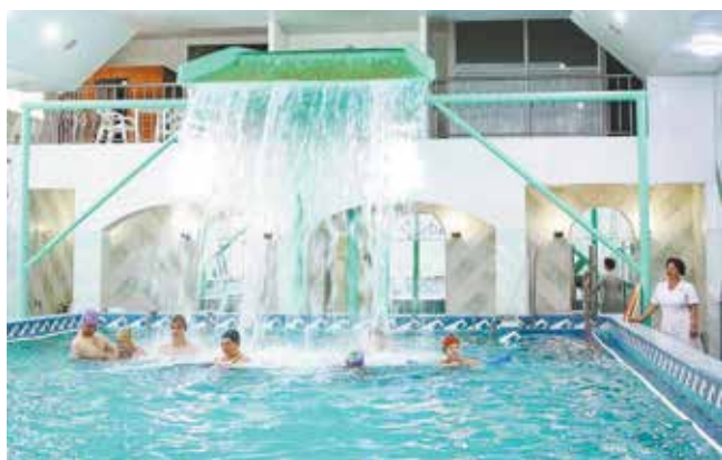
В сложный коронавирусный год укрепление здоровья сотрудников приобрело особое значение

В ПАО «НЕФАЗ» состоялась конференция по итогам выполнения Коллективного договора за 2021 год. О наличии кворума говорило участие 118 из 130 делегатов — представителей трудового коллектива, заявленных от всех подразделений предприятия.