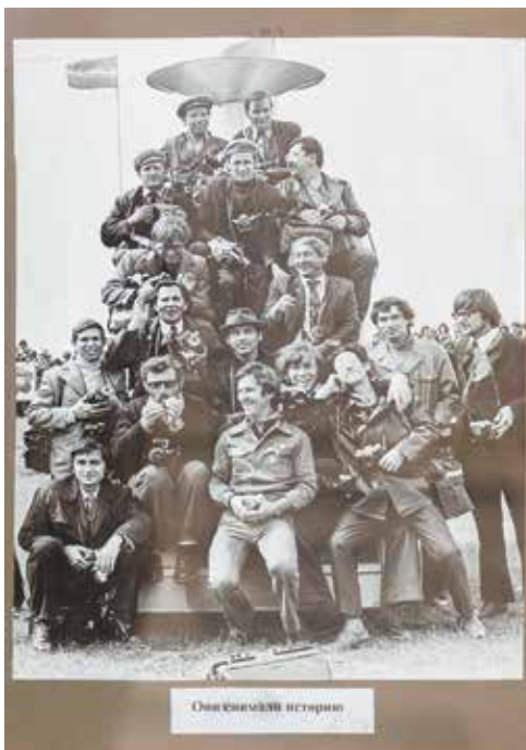
Коллективный портрет челнинских фотографов

вам по душе приятная атмосфера Дворца, неторопливая оценка и обсуждение работ с друзьями, приходите на выставку. Она будет работать до середины июня.