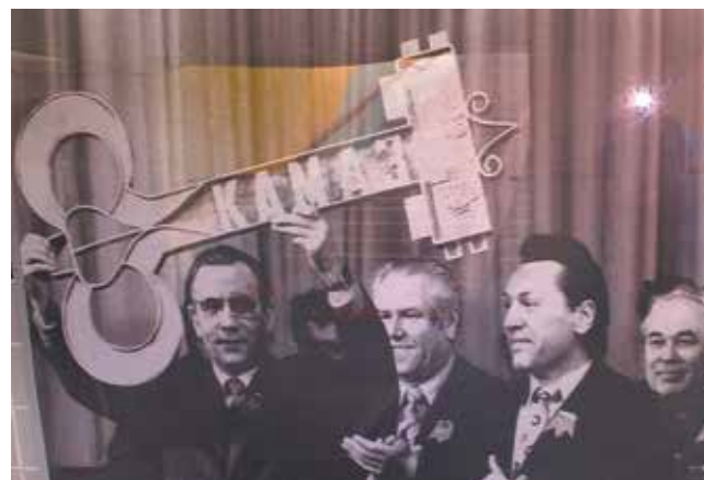
Этого снимка могло и не быть, если бы фотокор вовремя не включил голову