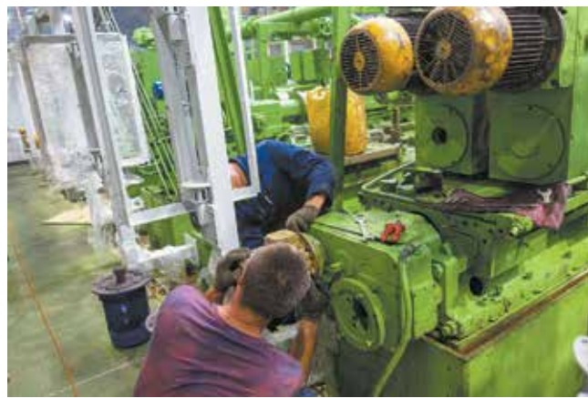
Оборудование тоже требует ухода и восстановления

машине Лаемре заменили четыре направляющие колонны и нижнюю часть стола, а на монорельсовой системе ПЧЛ совместно с ДСТиСАД произвели за-