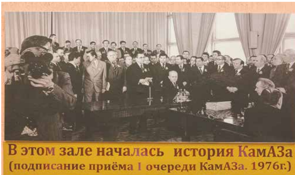
На фото запечатлён момент поворота судьбы Челнов: после подписания акта о приёме I очереди строительства «КАМАЗа» город станет неудержимо развиваться

Есть здесь и кадры встреч высоких гостей — по литейному заводу шагает первый секретарь ЦК ВЛКСМ Евгений Михайлович Тяжельников,