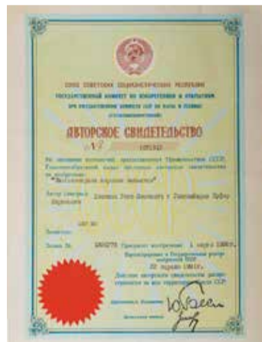
Авторские свидетельства и патенты подтверждают права Хакимова на изобретения