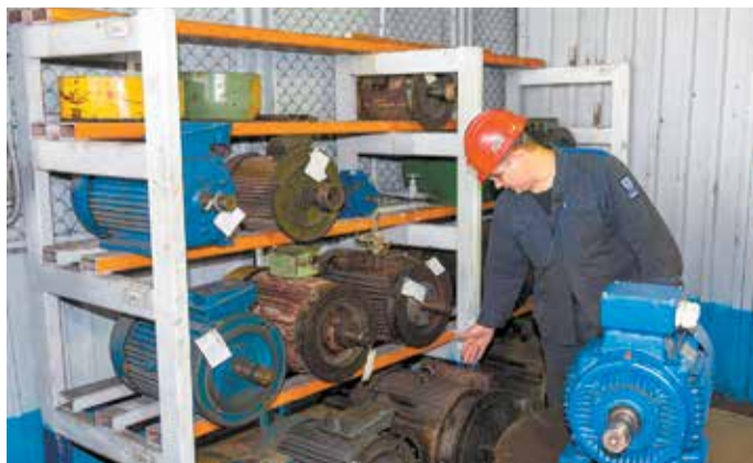
Электрооборудование на литейном не обходится без присмотра ремонтника

А для успешного выполнения практической части слесарям-ремонтникам нужно было прочесть гидравлическую схему, а электромонтёрам —