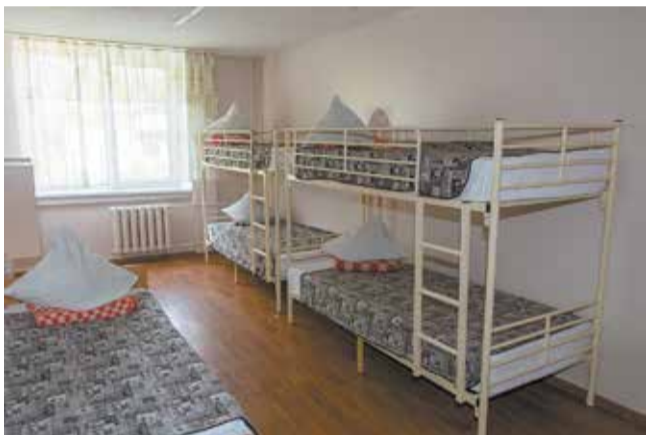
Есть варианты комнат с двухъярусными кроватями — мальчишкам они пришлись по душе

1 июня откроют двери «Солнечный», «Крылатый» и «Звёздный». Здесь будет работать четыре смены продолжительностью 21 день, в каждую смогут отдохнуть по 2000 детей. Путёвка стоит более 30 тысяч рублей, но «КАМАЗ» отправляет своих детей бесплатно.