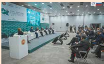
В форуме приняли участие 65 стран

А топ-менеджеры «КАМАЗа» приняли участие в переговорах о перспективах поставок автотехники в Королевство Бахрейн, Республику Таджикистан и Кыргызскую Республику.