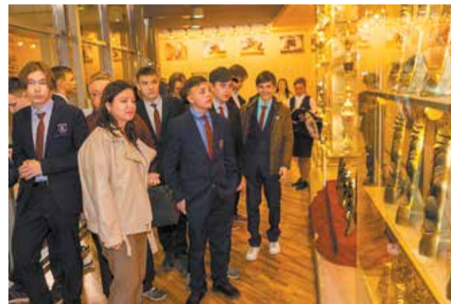
Надо же, сколько «Золотых бедуинов» принёс челнинским гонщикам «Дакар»!