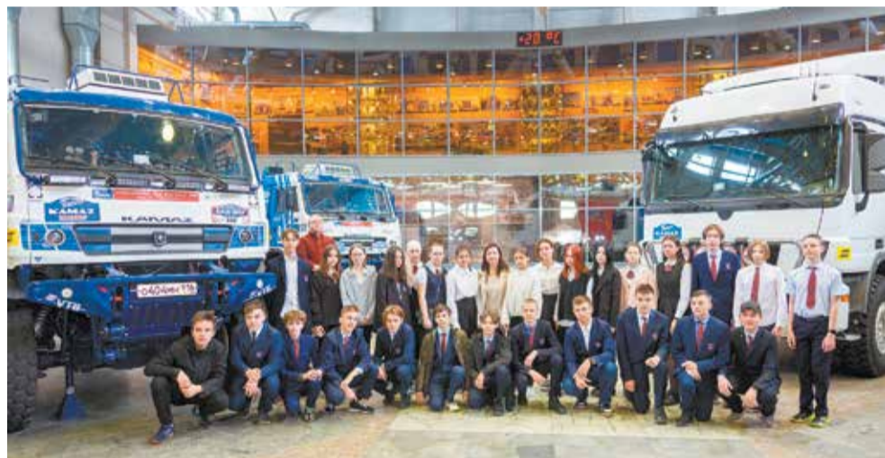
8 «М» школы № 41. Наверное, здесь есть и будущие инженеры