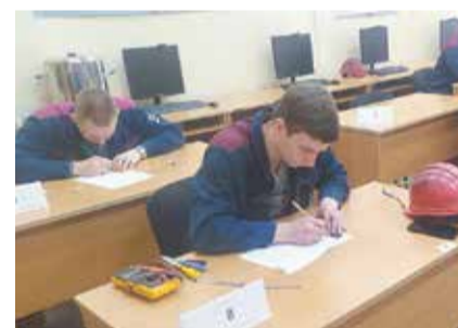
Нарисовать электрическую схему было непросто, но конкурсанты справились

Да, настоящего профи в электрогазосварке новой задачей не напугать — приварит всё!