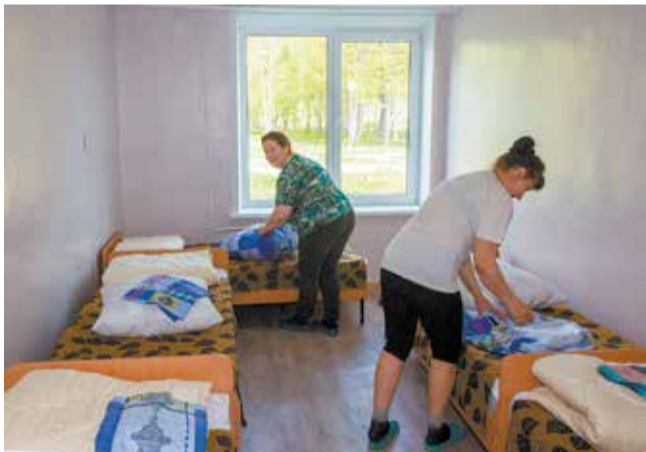
Последние штрихи: осталось постелить новые бельё, разложить подушки и одеяла