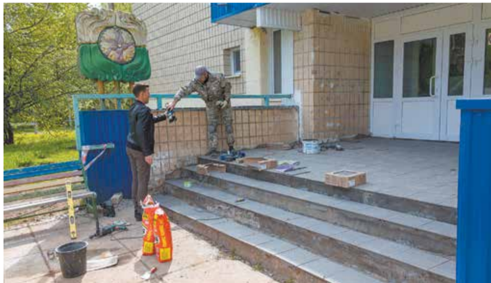
Идёт обновление напольной плитки на крыльце корпуса