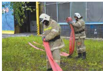
Профессиональные спасатели работали оперативно

По вводной штабной тренировки 27 мая в 6.20 начальнику смены поступила информация, что произошли взрыв сигнального устройства и разрыв газопровода. Вводная тактико-специальных учений дополнила картину — повреждена задвижка газопровода, имеются очаги возгорания, разбиты стеклянные строительные конструкции, образовался