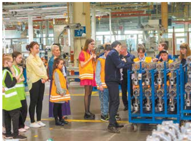
Интересно было даже девочкам

Рабочие места родителей после экскурсии сумели увидеть все ребята. Чуть позже дети вновь собрались все вместе на чаепитие, а затем отправились по домам. А их родители — трудиться дальше. На «движках» движение не останавливается никогда!