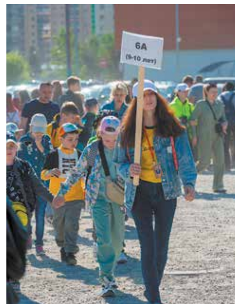
Отряды построены. В путь!