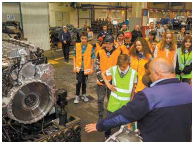
Сердце автомобиля — то, на что приходили посмотреть