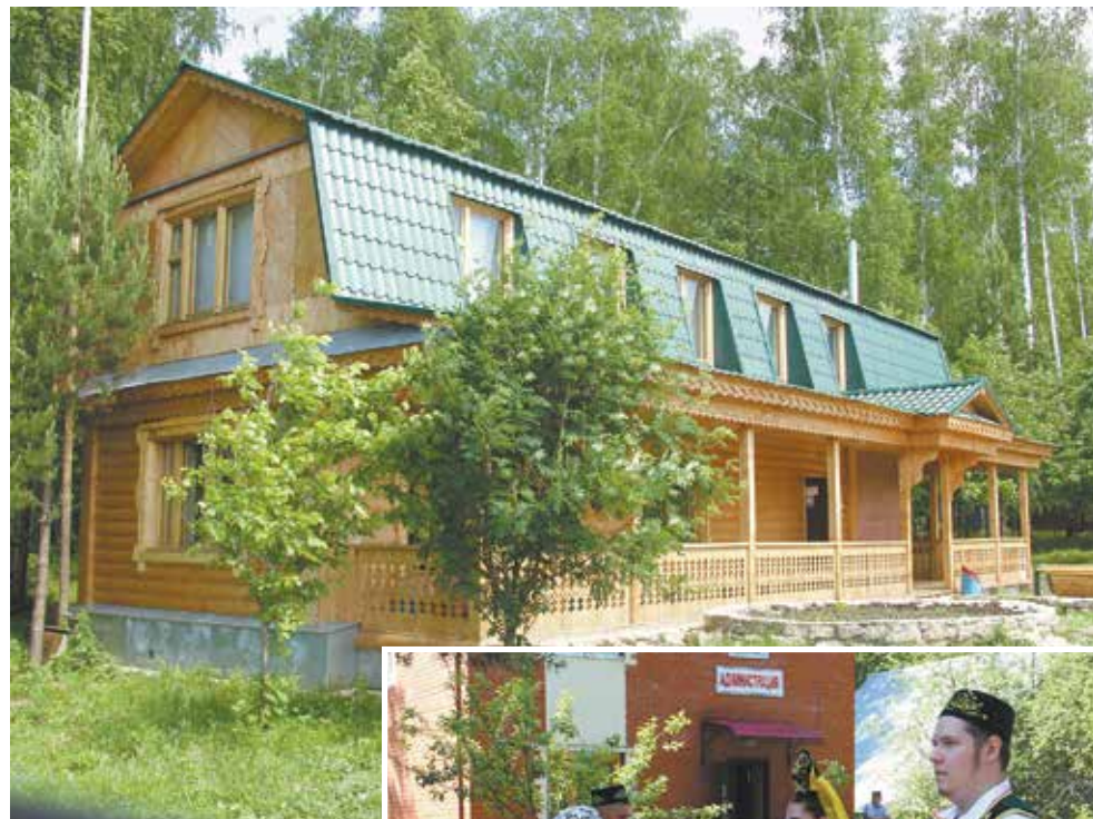
Домик в окружении зелени — ну чем не лесная сказка?