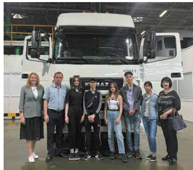
Фото на память вместе с родителями

Праздник, посвящённый Дню защиты детей, продолжится 4 июня. На площадке рядом с автомобильным заводом будут организованы игры и конкурсы для маленьких камазят.