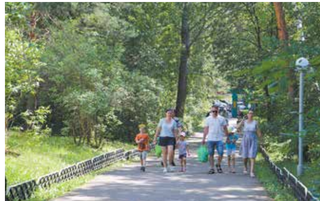
На заводские базы приезжают не только семьями, но и целыми коллективами