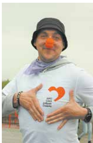
У камазовских волонтеров большие сердца

Каждый представлял, как по этим дорожкам после открытия лагеря будут бегать дети, многие вспоминали отряды камазовского форума «PROдвижение», в которых были кураторами. Дружная работа вдохновляет!