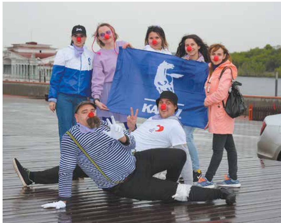
Эти клоуны больше не болеют, их вылечили ребяташки

обдумывал процесс лечения. Действенный, конечно: клоун обязательно выздоравливал!