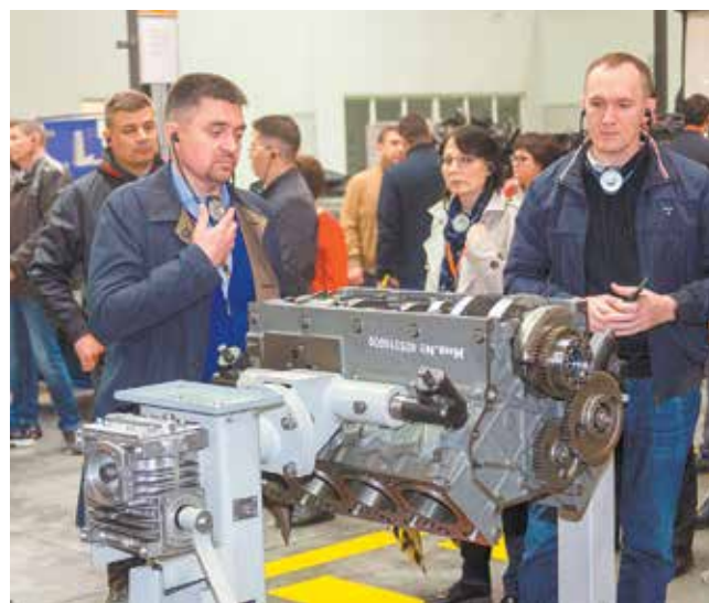
В УТК воссозданы реальные условия производства — например, на этом стенде можно обучаться сборке двигателя

смоделированном реальном производстве попробовать эти инструменты на практике и убедиться, что при грамотном применении они