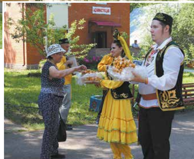
В праздники на базах отдыха трудовой народ приветливо встречают