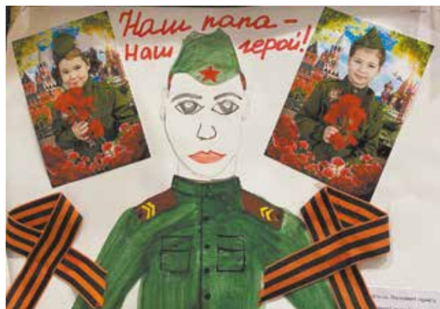
За героями далеко ходить не надо — они рядом

Все участники выставки получили от заводского профкома билеты в кино.