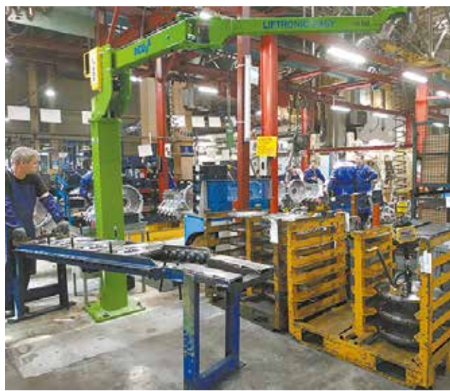
40-килограммовые маховики на двигатель кран переносит в считанные секунды

Деталь, к слову, совсем не маленькая и не лёгкая. Это маховик на двигатель, вес которого — 40 кг. Прежде порой приходилось перемещать маховики вручную, затем на участок поставили кран старого типа, который постоянно нужно было ориентировать и регулировать