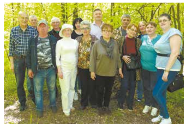
Повидаться с бывшими коллегами — добрая традиция