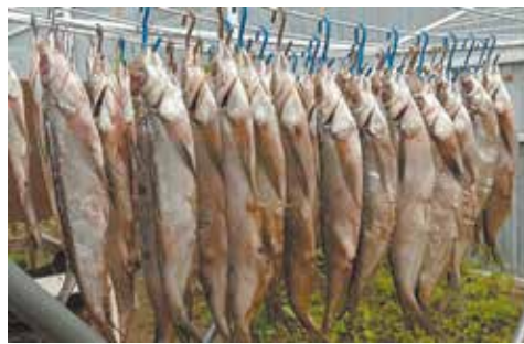
Так вялится чехонь

такая рыбка не залёживается, предупреждает он, месяц от силы, потому что полакомиться солёной жирной чехонью любят все.