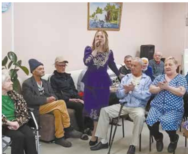
Хорошая песня находит отклик в любом возрасте

Наградой для самых активных участников стали призы, подарки, а для всех — чаепитие со вкусными пирогами.