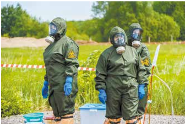
Противочумный костюм — необходимая защита медработника в подобных ситуациях

Подобные учения в Бегишево проходят ежегодно, это неотъемлемая часть работы по предупреждению и ликвидации чрезвычайных ситуаций. Благодаря грамотным и оперативным действиям служб аэропорта учения прошли успешно, все поставленные задачи выполнены.