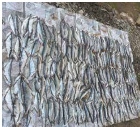
Здесь 21 килограмм свежей откалиброванной рыбы