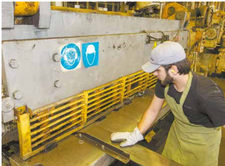
Сэкономленные после рубки куски металла тоже пойдут в дело

состава автомобиля 54901-0024-94 проанализированы детали кабины оперения и выявлены две детали с низким коэффициентом использования материала — это правый и левый кронштейны крепления бампера. Поэтому был предложен комбинированный