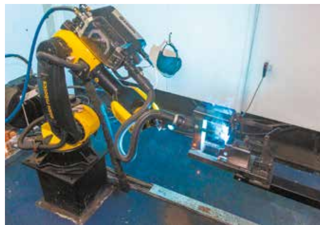
На ПРЗ успешно варит робот «Эйдос» казанской фирмы Eidos Robotics. Сварочная оснастка изготовлена Кашаповым