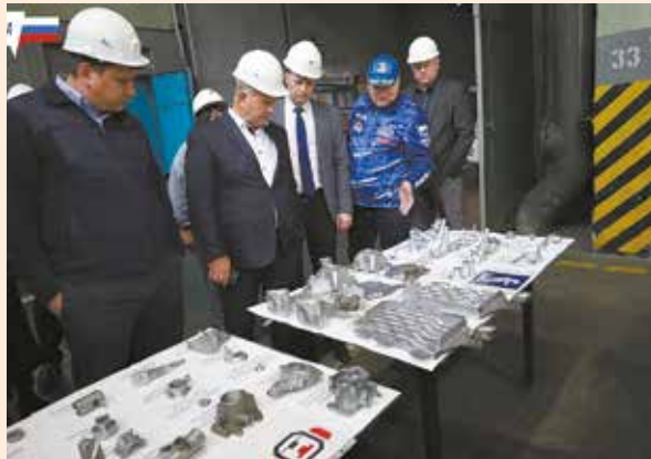
Выпуск цинковых и алюминиевых деталей вскоре будет освоен на ДЛЗ

А на июль запланирована стратегическая сессия «Перспективы развития «ДЛЗ» до 2025 года.