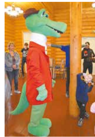
Танцы с Крокодилом Геней совсем развеселили

Сопровождали ребят аниматоры в образах всем известных персонажей — Крокодила Гены и Чебурашки. С ними можно было сфотографироваться на память и даже к играм привлечь — старые добрые мультяшки не откажут!