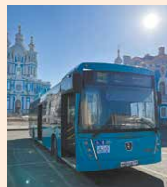
Газомоторные автобусы сохраняют чистый воздух Северной столицы

Новые автобусы пополнили парк петербургского пассажироперевозчика АО «Третий парк», а маршруты их следования уже определены.