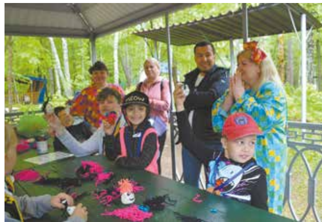
И капитошек мастерить научились

Ну и без активностей, конечно же, не обошлось. Для детей на празднике были открыты своеобразные станции, на которых можно было заняться определённым делом: рисовать, танцевать, мастерить капитошки, делать игрушечного зайчика на пальчик, собирать апплика-