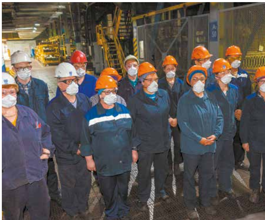
Литейный завод, 3 августа. Рекомендация ношения масок в местах массового скопления людей соблюдается