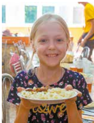
После активностей обед особенно вкусный