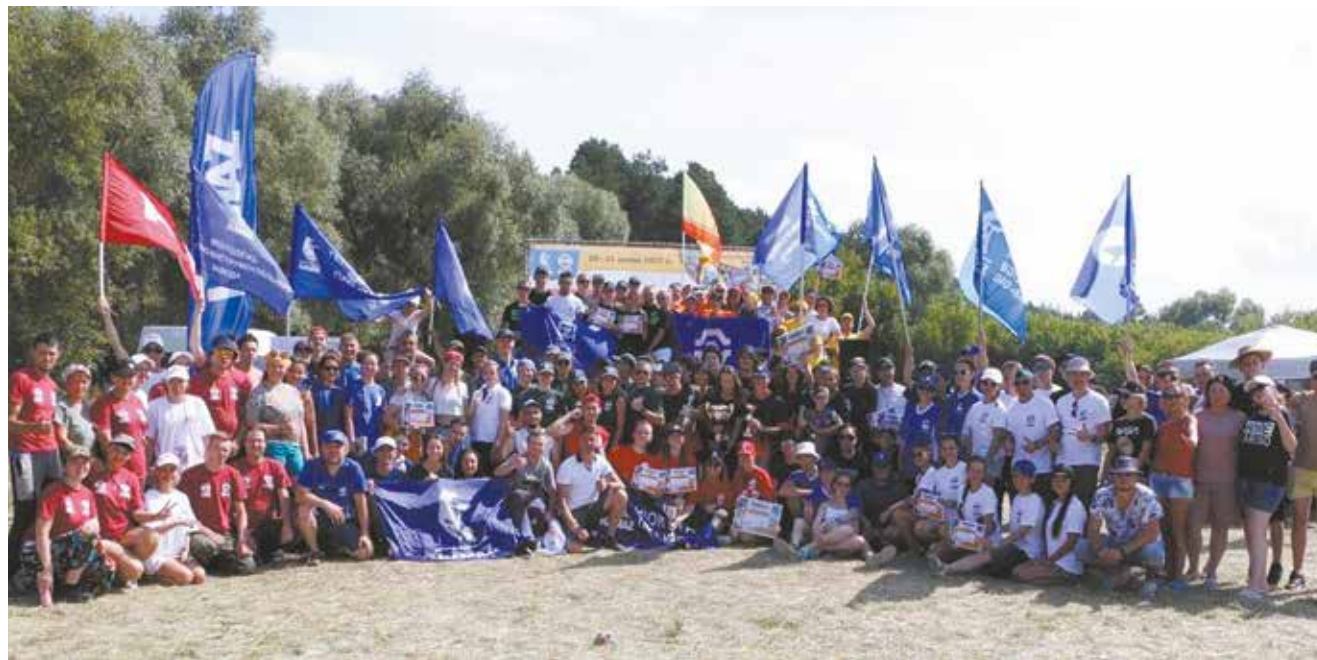
В камазовском турслёте-2022 поучаствовало 15 команд