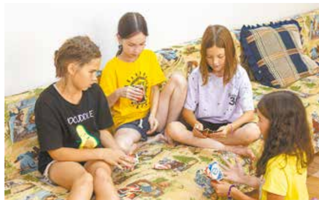
За играми время пролетает незаметно