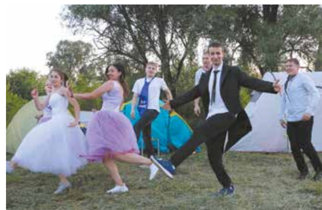
Артистизм тоже принёс баллы в копилку каждой команды

Следующий номер газеты «Вести КАМАЗа» выйдет 19 августа