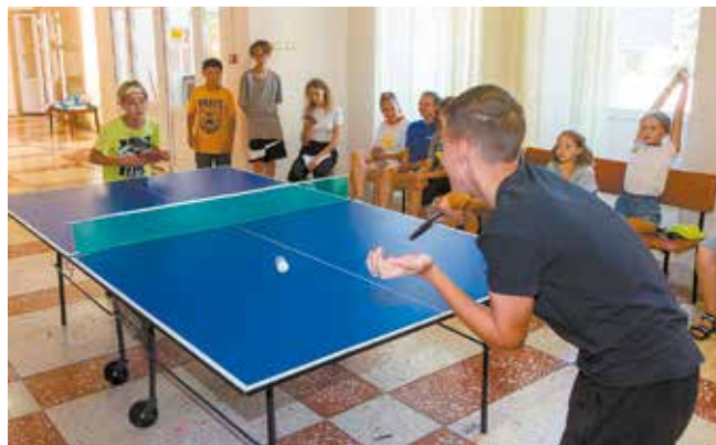
Пинг-понг интереснее телефонных игр

И нам было хорошо взглянуть хоть одним глазком в особый лагерный мир. Впереди ещё одна, последняя, смена, так что, ребята, оторвитесь хорошенько перед новым учебным годом! А обо всём остальном позаботятся педагоги и вожатые оздоровительного комплекса «Саулык».