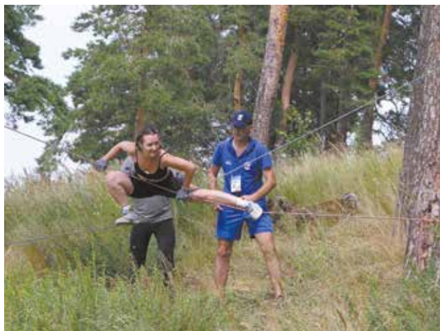
Это испытание под силу только ловким