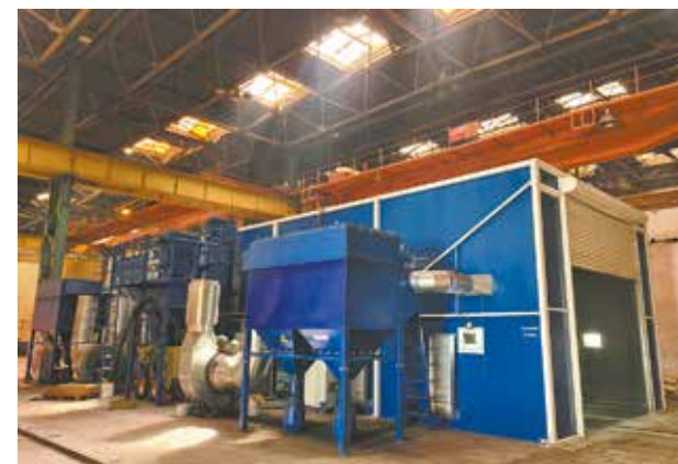
Линия дробеструйной обработки и окрасочно-сушильная камера

Всё оборудование изготовлено с применением современных технических решений и отвечает всем требованиям и нормам СанПиН. Контракт на поставку и монтаж оборудования был заключён с ООО «АЛЬФА-ТЕК». Работы по монтажу были начаты в начале этого года, сейчас оборудование установлено в окрасочном цехе.