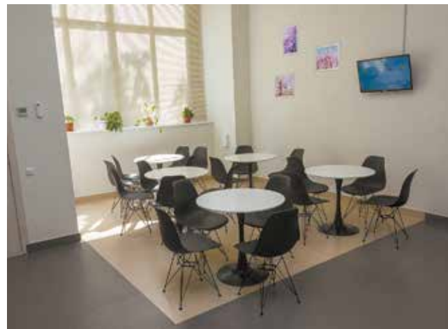
В зоне отдыха одновременно разместится до 20 человек

работников сделана шумоизоляция и установлена система климат-контроля. Разделена она на две зоны: бытовую, в которой находится кухонный островок, и хозяйственную со столами и стульями. Таким образом, заводчане смогут разогреть себе еду и отдохнуть в тишине и покое. И даже книжку полистать — шкаф с небольшой пока коллекцией классической литературы уже ждёт будущих читателей.