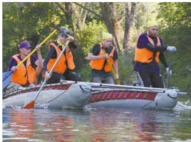
Прохождение водной дистанции — задание не из лёгких