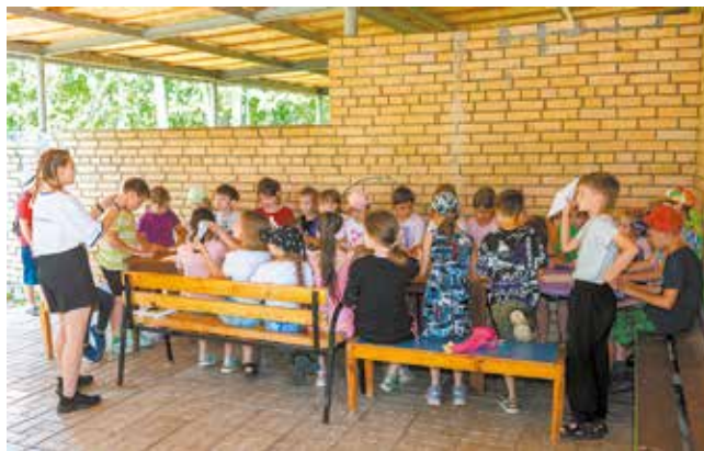
Вожатые умеют увлечь подопечных — ребята и от солнца спрятались, и оригами складывать научились