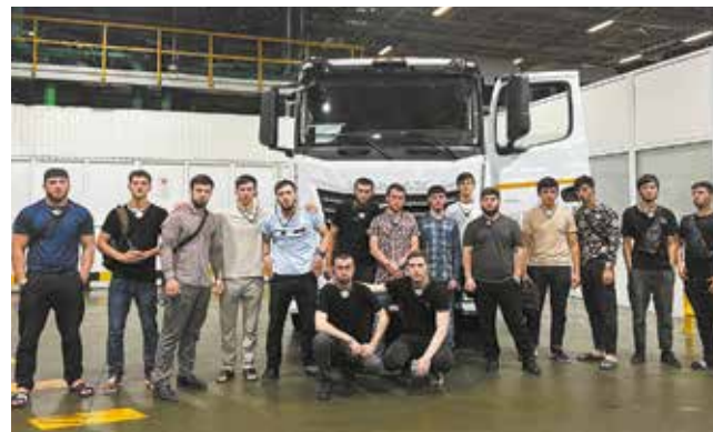
Студентам из Чечни на «КАМАЗе» открываются хорошие перспективы

Делу — время, но и на потеху часок нужно выкроить. За несколько недель, проведённых в Набережных Челнах, студенты успели и поработать, и отлично отдохнуть: они познакомились с городом, съездили на экс-