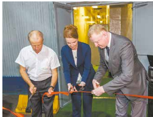
Торжественный момент открытия

Для студентов провели экскурсию по автосборочному производству, где они своими глазами смогли увидеть процесс работы и готовые автомобили. А после прохождения обучения в МЦПК и УТК будущие технари смогли и сами поучаствовать в создании КАМАЗов — они включились в работу слесарями МСР цеха сборки кабин и цеха мостов.