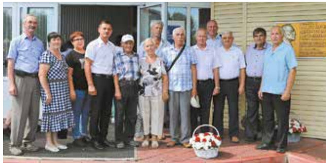
День рождения первого директора «движков» — повод собраться и нынешним, и бывшим, и будущим работникам завода