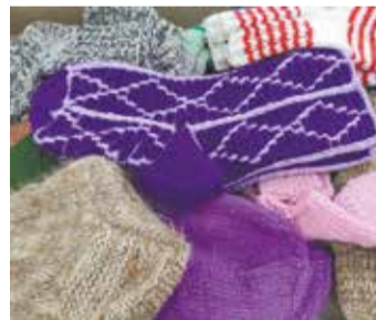
Такие вещи могут создать только заботливые руки

Акция продлится до 31 августа. Все переданные изделия будут доставлены в Центры гуманитарной помощи партии «Единая Россия» в ДНР и ЛНР.