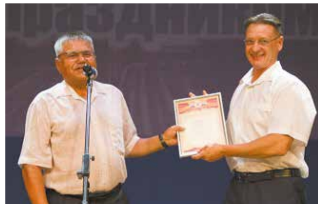
Получить награду из рук директора — особая честь

Отметили на празднике и победителей конкурса «Лучший по профессии», который провели в преддверии праздника. Лучшими составителями поездов