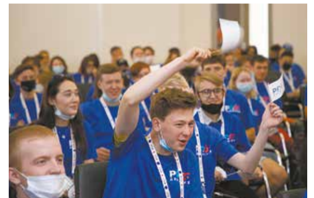
Встречаемся на «PROFдвижении-2022»!

«PROFдвижение» раскрывает новые таланты среди молодёжи. Тренинги, мастер-классы, профпробы помогают развить компетенции для карьерного роста, сформировать интеллектуальную элиту региона и молодёжного движения страны. Участники с наиболее высоким потенциалом получают приглашение работать на «КАМАЗе» — крупнейшей автомобильной корпорации России.