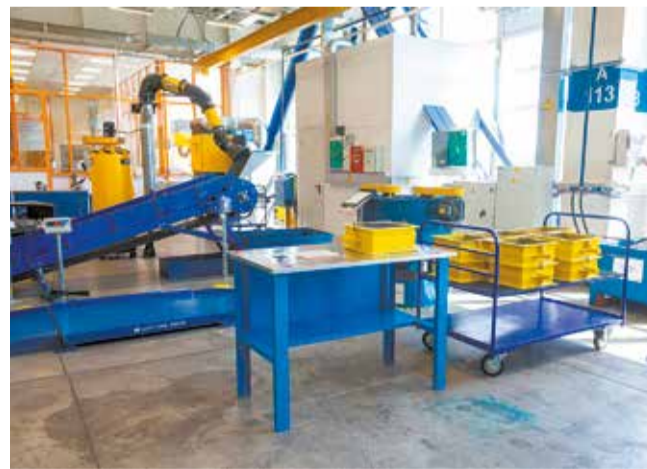
Так оборудован УТК