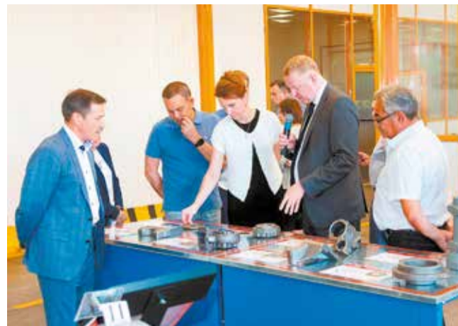
Чтобы получить такие отливки, надо пройти долгий путь обучения и практики

— Этот проект был реализован в рамках инвестпроекта «Развитие модельного ряда автомобилей КАМАЗ и модернизация производственных мощностей для его производств». Он — часть инвестиционной стратегии компании, его реализация позволит нам иметь лучше подготовленные кадры, а в перспективе — улучшить