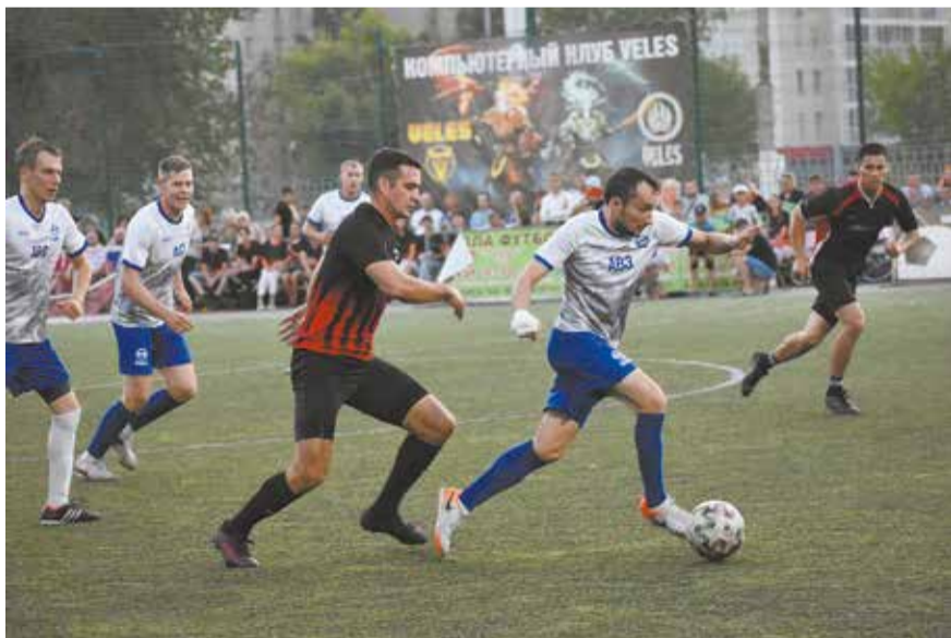
Футболисты АвЗ были настроены только на победу

автосборщикам сдержать натиск соперника и отразить волну атак. А дальше они начали прощупывать фланги, искали слабые места в обороне. И под занавес первого тайма нашли