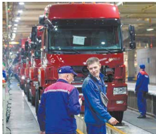
Только слаженная работа позволит назваться коллективом высокого качества труда

Знать, конечно, мы не знаем, но удачи нашему герою обязательно пожелаем. И послушных проводов!