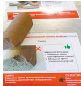
Все возможные ошибки представлены наглядно

Определённо, без знаний из такого потрясающего учебного комплекса уйти просто невозможно. И не влюбиться в профессию тоже нереально!