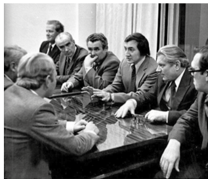
70-е годы. Переводчики работают с делегацией «Тиссен Рейнштадт Техник» на кузнечном заводе