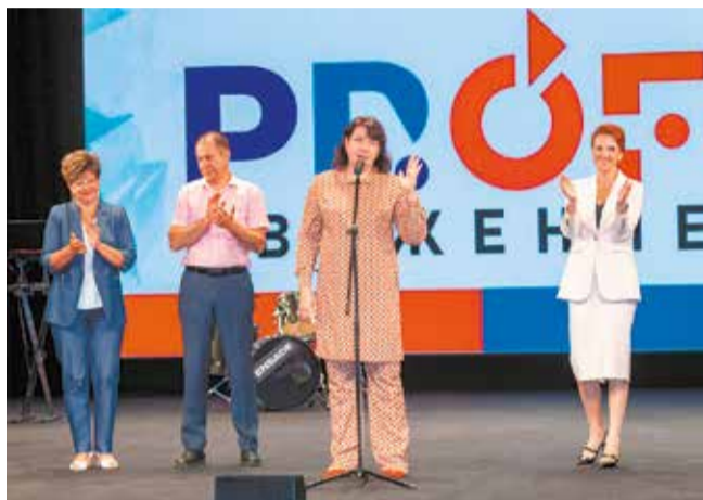
Напутствуя участников форума, руководители желали им успешного профдвижения