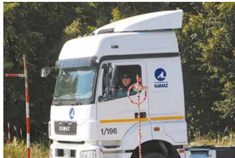
Эстафета: достань, сидя за рулём большегруза, кольцо

Прохождение дистанции на каждом из видов транспорта требовало большой концентрации внимания и опыта. Каждый води-