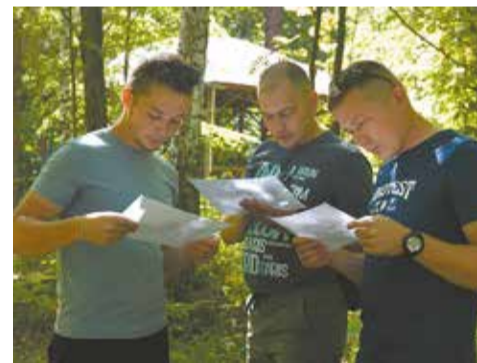
Чтобы пройти квест, надо изучить карту

Программа спортивных соревнований началась с квеста, включающего ориентирование на местности. Организаторы празд-