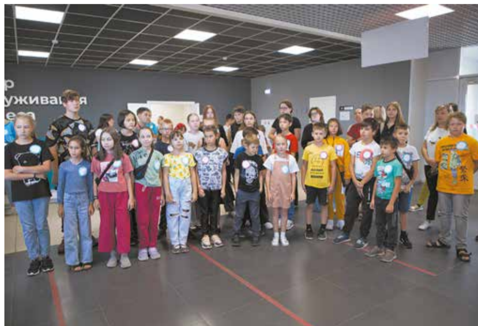
Всего на «Чумовую пятницу» собралось больше 40 ребят от 8 до 15 лет. Все они — сыновья, дочери, братишки, сестрёнки и племянки сотрудников ЦОБ