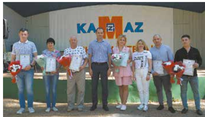
Награды вручены самым активным мастерам

Впечатлениями все делились уже за столом с наваристой ухой и ароматным плом. Следующий праздник — День мастера «КАМАЗа» — будет в декабре.