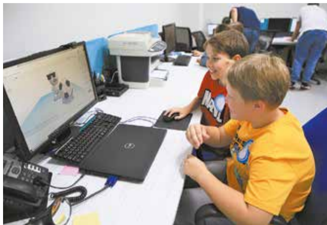
Потехе — час, а делу — время: во время IT-мастер-класса дети учились 3D-моделированию и конструировали своего собственного робота-цобота

Детей разделили на три группы, и каждая команда во главе с гидом прошла