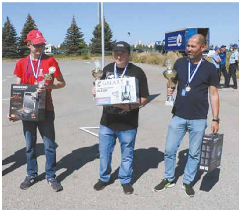
Награды — победителям...

В логистическом центре «КАМАЗа» определили лучших водителей большегрузных и легковых автомобилей. В конкурсе профессионального мастерства приняли участие 20 водителей департамента транспортной логистики, по 10 в каждой номинации.