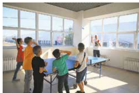
Сбить бумажным шариком бумажный самолётик... Звучит легко, а на деле задание заставило мальчишек попотеть!