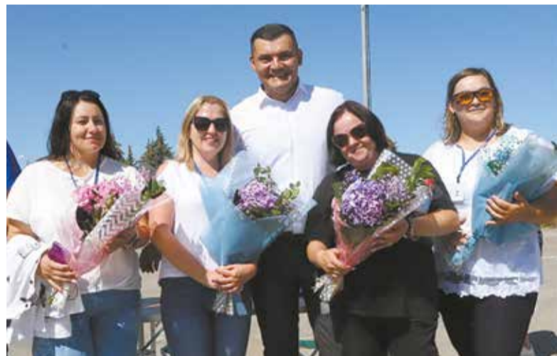
...а дамам-победительницам ещё и цветы

В начале конкурса участники соревнований сдали тест на знание правил дорожного движения. На 20 вопросов отводилось 10 минут, но большинство справилось с экзаменом гораздо быстрее.