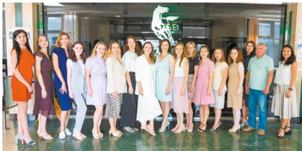
Коллектив отдела внешних связей — настоящие профессионалы: и перевод сделают, и загранкомандировку оформят

— С 25 по 28 февраля текущего года, когда политическая ситуация обострилась, мы в круглосуточном режиме перевели три пакета санкций объёмом 345 страниц. За 2021 год одних только письменных переводов было порядка 10800 страниц, не говоря уже о шеф-монтажных работах и онлайн-переговорах. Всё это силами 17 сотрудников. Сейчас, в век Google-перевода, скоростью мало кого удивишь. Но, в отличие от машины, человек может увидеть нюансы, грамотно расставить акценты, распознать многозначное слово и учесть контекст. Поэтому наши переводы — это не только про скорость, но и про качество, которое всегда на высоте.