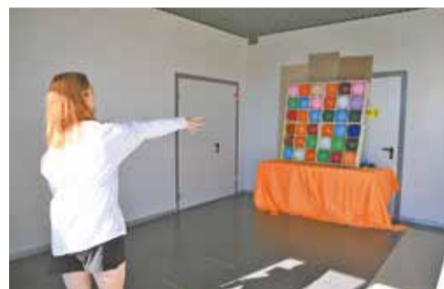
Вот это меткость — после точного «выстрела» дротиком ни один воздушный шарик не остался непобеждённым!