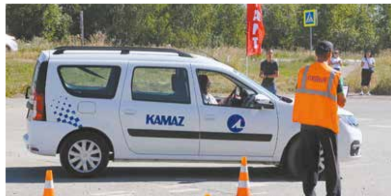
Водителю легкового автомобиля нужно выполнить все манёвры максимально аккуратно

тель (а были среди них и такие, что уже имели опыт участия в конкурсе) должен был, преодолев волнение, показать лучший результат, и он будет вписан в историю соревнований.