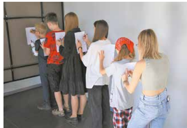
Игра в глухой телефон в современном стиле: пойми, что рисуют у тебя на спине, и повтори для соседа. А потом вместе посмотрите, что получилось!

А в конце ребят ждали сладкие подарки, наклейки и море впечатлений.