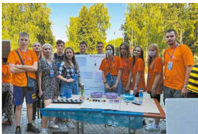
Мастера подготовили и рабочие места, и визуализацию процесса

В тот же день в лагере ребята приступили к подготовке своей версии профессиональных проб. Станки, лаборатории, сборочные посты они сооружали из пенопласта, картонных коробок, листов бумаги, клея и других подручных материалов.