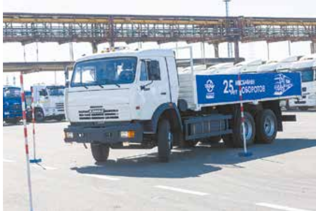
В руках профи грузовик становится лёгким и податливым

И всех, конечно же, ждут и на следующий год — профессионального мастерства много не бывает!