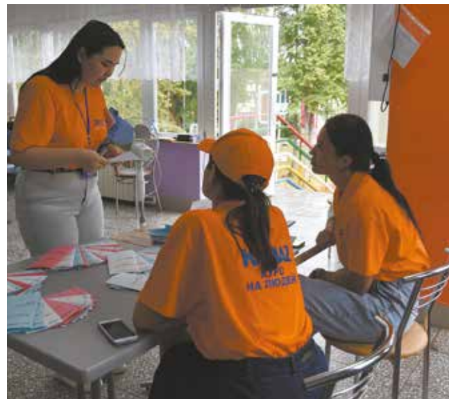
На ярмарке вакансий каждый мог найти работу