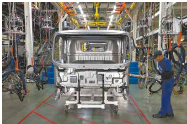
Каркас кабины сейчас собирается серийно

троля проще обнаружить отклонения от геометрии каркасов, дефекты сварки и самой кабины.