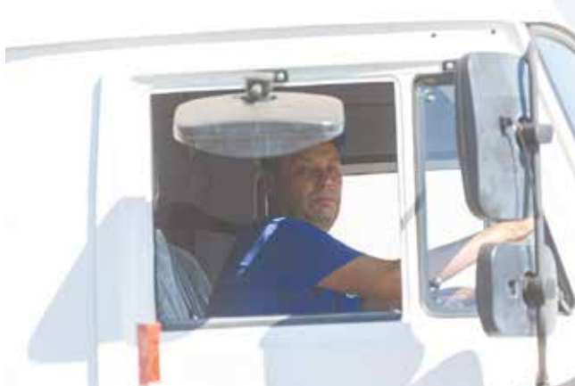
Всё внимание — на стойки