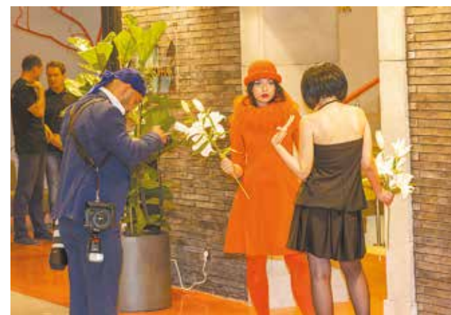
Поход в театр обещает быть праздником