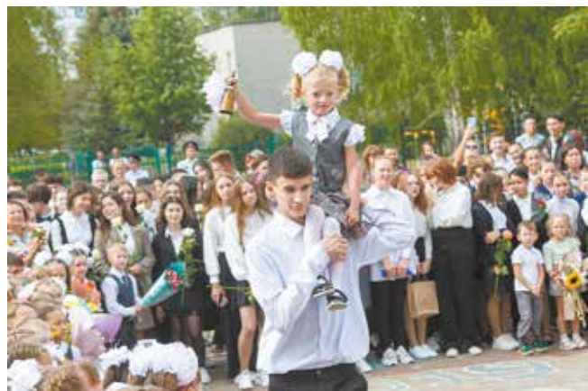
Новый учебный год объявляется открытым

Об открытии новой школы № 62 читайте на портале «Вести «КАМАЗа»