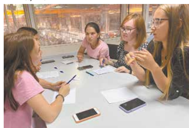
Девушки из планово-бюджетного отдела сосредоточены, ведь они идут к победе

Больше всего правильных ответов на 20 вопросов дала команда планово-бюджетного отдела. Ей вручили переходящий кубок, диплом и сладкие призы. Дипломы и шоколадки получили призёры игры — интеллектуалы из технологического и конструкторского отделов. Не обделили организаторы сладостями и других участников. Следующая битва знатоков РИЗа состоится осенью.