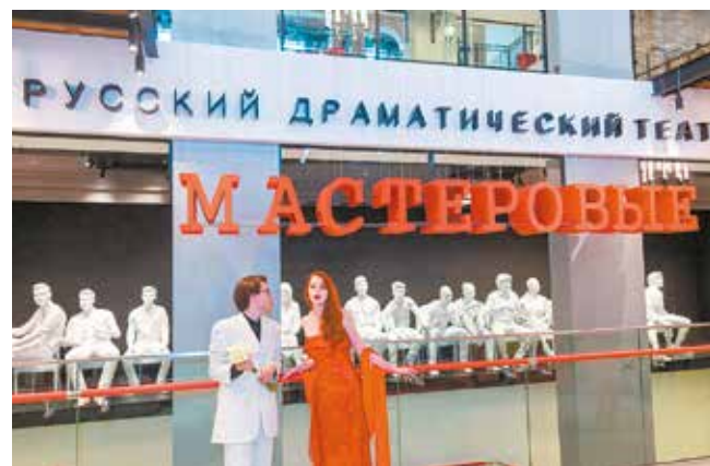
В фойе новых «Мастеровых»

К слову, любители театра, пришедшие на постановки с детьми, могут оставить своих чад в специальной комнате, где с ними будут заниматься педагоги. В программах такой комнаты, как её назвали театралы, «волшебной», рисование и просмотр мультфильмов.