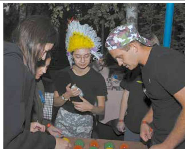
Героям нужно пройти серию серьёзных испытаний

А закупщикам тем временем предложили принять участие в квесте «Последний герой в джунглях». По сценарию на исследование загадочного острова отправляется экспедиция, которая попадает в ловушку. Чтобы вырваться из неё, каждая из восьми команд должна организовать убежище, развести костёр, собрать карту, заполнить дневник, научиться стрелять... В