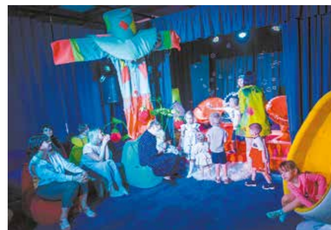
В бэби-театре примут малышей до пяти лет

пьесе советского писателя Евгения Шварца. В целом на сезон запланированы семь постановок. В планах «Мастеровых» также сказки для детей, постановки для подростков.