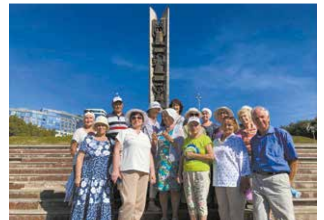
Фото на память у главного монумента Ижевска

Домой ветераны вернулись радостными, воодушевлёнными. Не зря говорят, что лишь тот, кто путешествует, открывает новые пути.