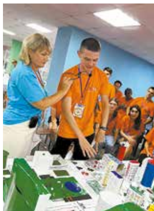
Форумчане строят город мечты

Перед защитой проектов отряды провели бессонную ночь: нужно было смонтировать динамичный ролик о профессии на