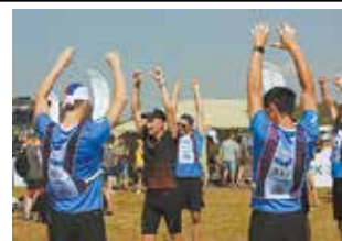
Прежде чем отправиться на испытания, проводят разминку

— Через день по возможности собирались и бегали кроссы, занимались на турниках и брусьях. Заранее не знали, какие будут испытания, ориентировались на наши предположения, — поделился он. — Команда в результате выступила