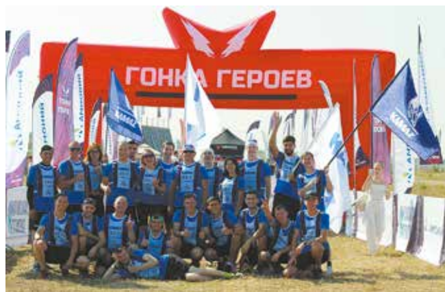
От «КАМАЗа» в «Гонке героев» участвовали три команды