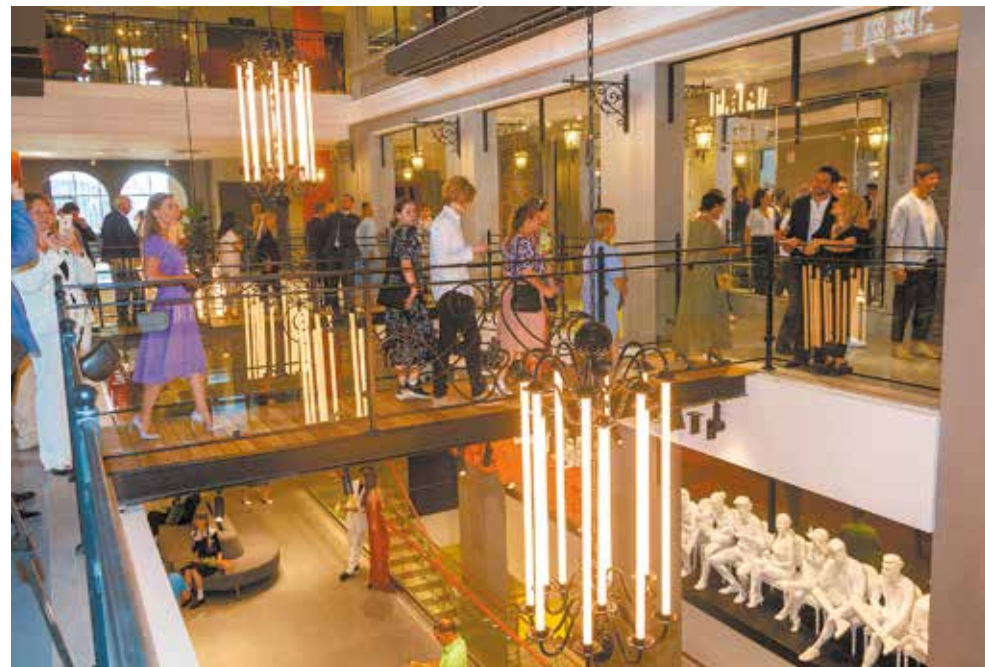
В зрительный зал ведут перекидные мостики. А что ждёт в самом зале, придёте и увидите сами