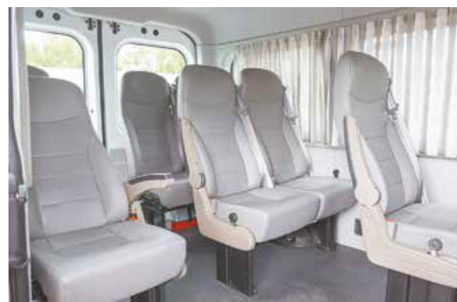
В салоне восемь кожаных кресел с откидными подлокотниками и ремнями безопасности

Пилотный запуск должен состояться в конце сентября и продлится месяц, по результатам примут решение — будет ли