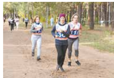
Легкоатлетический кросс на «КАМАЗе» — традиционно самое массовое соревнование

Конец октября и начало ноября тоже не подкачают: в эти дни будут разыграны кубки «КАМАЗа» по баскетболу и волейболу . На баскетбол уже предварительно заявлено четыре команды, а на волейбол — восемь. А вот список болельщиков не определён, так что ждём всех!