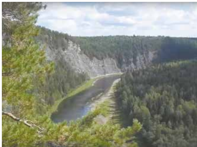
Река Чусовая удивительно красива