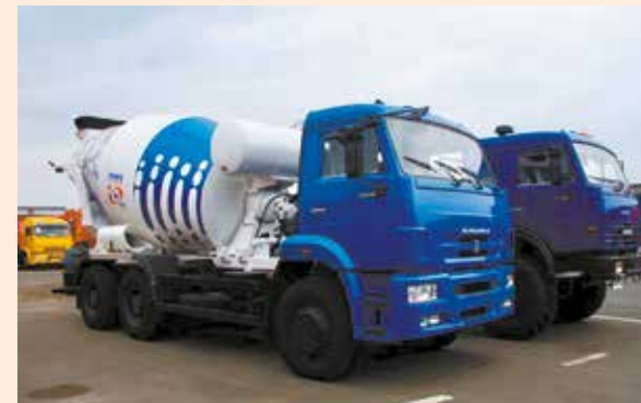
До конца года автобетоносмеситель можно купить по акции

Особые условия акции распространяются на четыре модели автомобилей, пользующиеся спросом на рынке самосвальной и строительной техники: самосвалы КАМАЗ-6520 и 65115 и автобетоносмесители 58149 и 58147. Акционная программа продлится до конца текущего года.