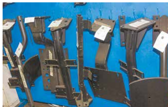
Так выглядят детали после грунтовки

корректировки норм расхода металла. В итоге нормы на одну деталь были снижены на 7,76 кг. Экономический эффект составил 292 тыс. рублей.