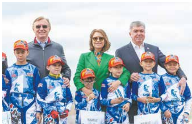
Ученикам мотошколы вручены удостоверения

В результате двухдневных соревнований финального этапа чемпионата России определены сильнейшие гонщики России в восьми классах.