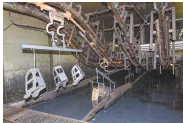
Изменение такта движения на линии окраски 004 в ЦО-1 ПРЗ повысило производительность