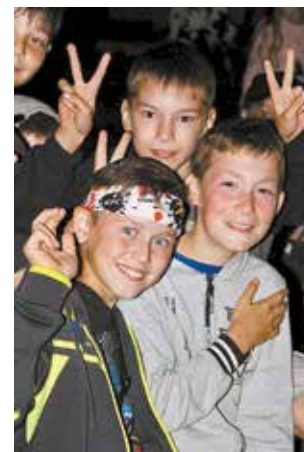
«Саулык» — это здорово!

Ежегодно лагеря «Крылатый» и «Солнечный» оздоровительного комплекса «Саулык» принимают в своих стенах более 8000 юных челнинцев на летний отдых. В 2022-м для увеличения количества приобретаемых путёвок в детский лагерь «КАМАЗ» принял участие в федеральной программе, которая