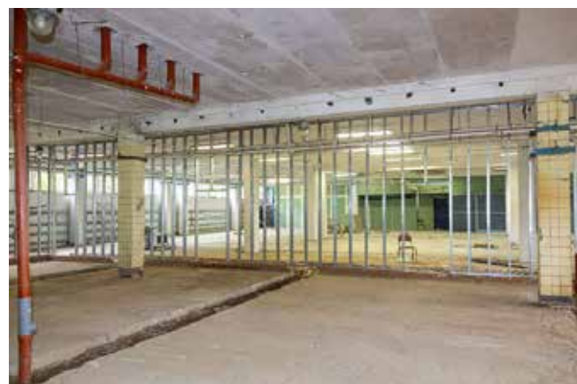
АБК-06: в раздевалках сделали стяжку пола, заменили трубы и подготовили каркас для перегородок