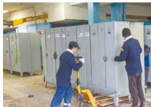
АБК-09: помещения освобождаются перед началом работ

И этот список планируют дополнить. На ЛЗ надеются, что в 2023 году «КАМАЗ» выделит средства на ремонт оставшихся гардеробных и душевых комнат. Таких на «литейке» ещё семь: в АБК-05, АБК-09, АБК-10, на скрапобазе и СФС.