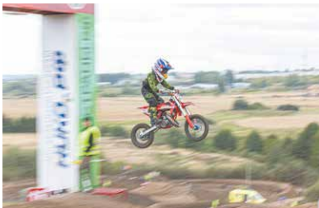
Чтобы так взлететь, надо тщательно подготовиться