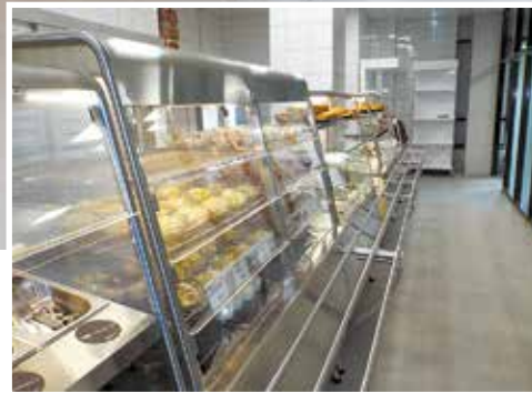
Удобная линия раздачи ▶