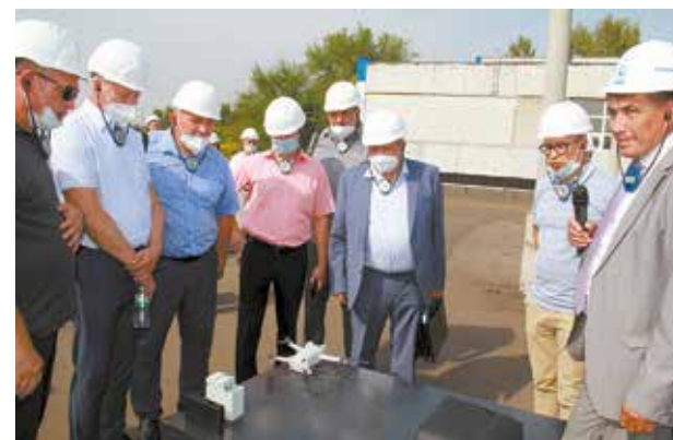
В системе видеонаблюдения за станцией используются и квадрокоптеры

Участники высоко оценили степень антитеррористической защищённости СОВ, а также дали ряд рекомендаций.