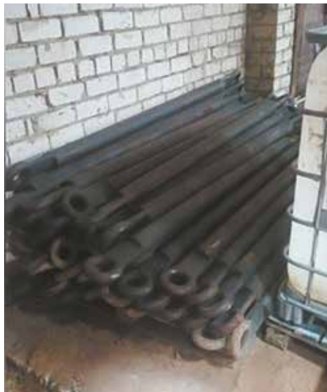
Вот 48 буксировочных штанг. А где документы на них?

Всё найденное вернулось в производственный цикл, хотя могло быть со временем вынесено — никто ведь не хватится комплектующих и материалов, не отражённых ни в каких документах. Руководителям упомянутых подразделений придётся организовать не только внеплановую инвентаризацию на своих территориях, но и служебную проверку: допустившие халатность лица должны быть установлены и привлечены к ответу.