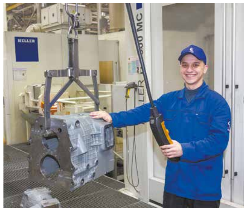
«КАМАЗу» в первом полугодии 2022-го удалось и коллектив сохранить, и уровень доходов держать на уровне

Отдельно была отмечена работа компании, направленная на поддержку пенсионеров, бывших работников «КАМАЗа», детей сотрудников автогиганта, а также женской части коллектива. Для этих категорий разработаны отдельные программы по оздоровлению и материальной помощи.