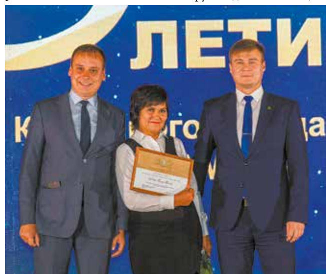
Кузнецы достойны самых высоких наград

После торжественного мероприятия в актовом зале для ветеранов организовали праздничный обед и вручили памятные подарки. Затем ветераны имели возможность познакомиться с новейшими образцами камазовской автотехники — для них на территории КЗ были выставлены её образцы, посетить заводской музей и, конечно, сделать памятные снимки в специально оборудованной фотозоне.