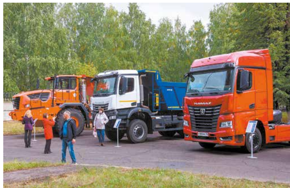
Выставка новейшей камазовской техники — украшение праздника