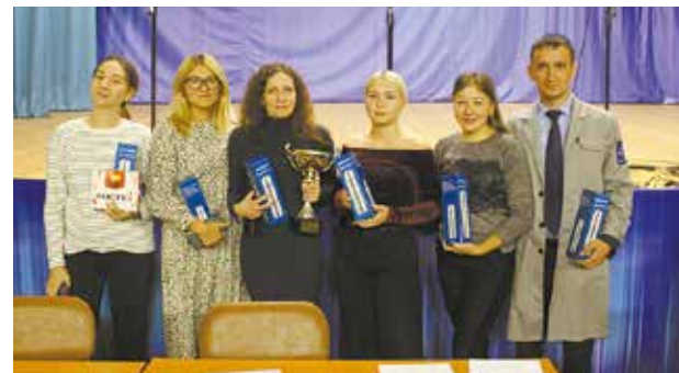
Лучшими знатоками предпраздничной игры стали интеллектуалы из отдела кадров

По итогам игры первое место и кубок победителя достались команде отдела кадров, «серебро» — у знатоков из отдела методов обработки, третьим призёром стала команда отдела подготовки производства.