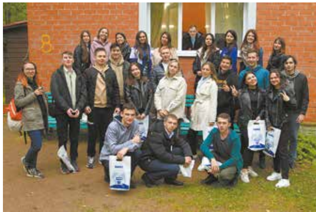
Все новички успешно прошли квест и получили подарки на память

Тут же выпускники вузов получили приглашение на базу отдыха «Бережок», где для них Совет молодёжи и администрация блока под-