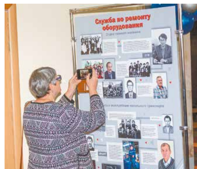
Музей кузнечного всегда отличался бережным сохранением памяти. Все фото и факты из истории — здесь