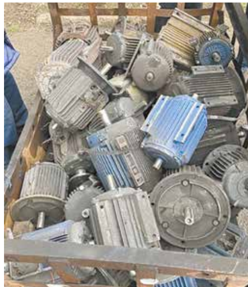
32 двигателя разной мощности на 160 тыс. рублей нашлись на «литейке»