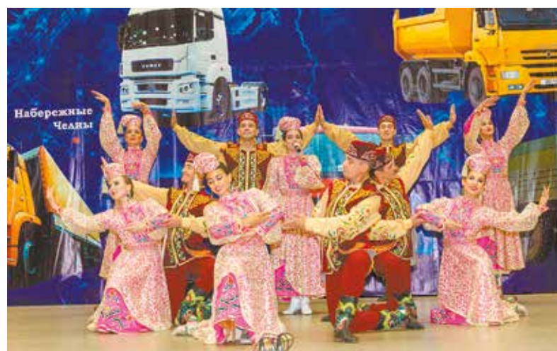
«Булгары» традиционно покоряют изысканностью и красотой