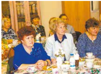
«Пятое время года» — такое название получил клуб ветеранов-камазовцев, имеющих желание делиться творческими идеями

Свой клуб по интересам ветераны-камазовцы назвали просто и поэтично: «Пятое время года».