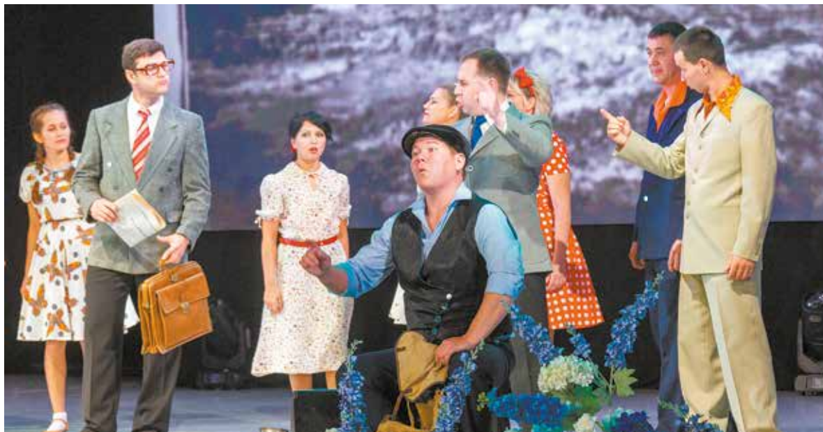
Постановка «Рассвет новой жизни» стала украшением праздника

23 сентября поздравление коллектива предприятия продолжилось в городском парке культуры и отдыха.