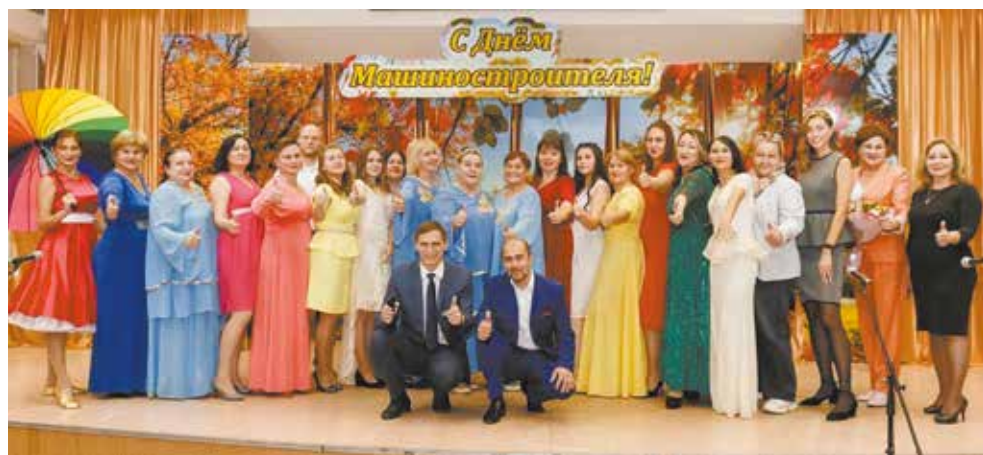
День машиностроителя на литейном раскрасили все цвета осени

После торжественной части зрителей ожидала концертная программа. Здесь были мужской и женский вокал, а также различные театрализованные постановки. А закончился праздник песней «Мир вашему дому» — это пожелание сегодня важно для каждого человека.