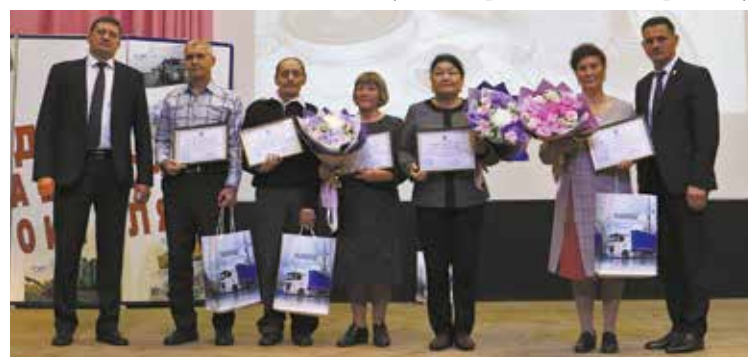
Лучших специалистов отметили наградами федерального, республиканского, городского и корпоративного значения

А после официальной части перед заводчанами выступил театр песни «Монлы Чаллы». Яркие вокальные выступления певцов никого не оставили равнодушными.