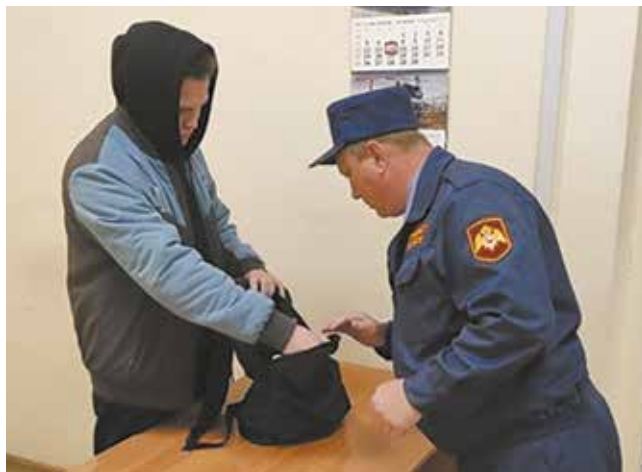
Попытка пройти с бомбой через проходную оказалась напрасной

Караул росгвардейцев оперативно перекрыл вход в здание и оцепил место происшествия, персонал был экстренно эвакуирован: по результатам тренировки