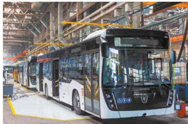
Пассажирский транспорт от «НЕФАЗа» прочно закрепился на дорогах России

должию Нефтекамский автозавод за относительно короткий период добился больших успехов в выпуске пассажирского транспорта.