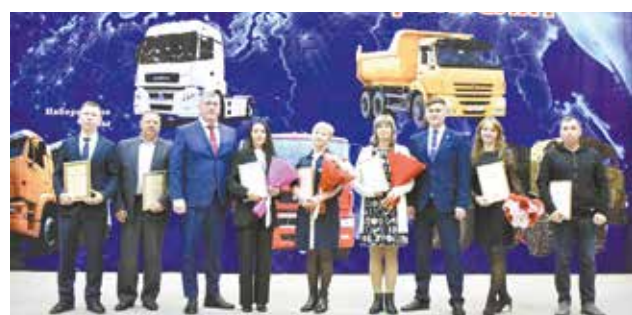
Труд инструментальщиков отмечен самыми высокими наградами

Конюков. Они поблагодарили коллектив предприятия за труд, за то, что даже в самых сложных, стрессо-