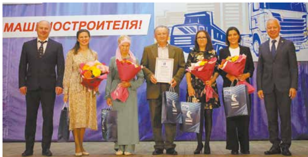
Общий трудовой стаж этой семьи 181 год