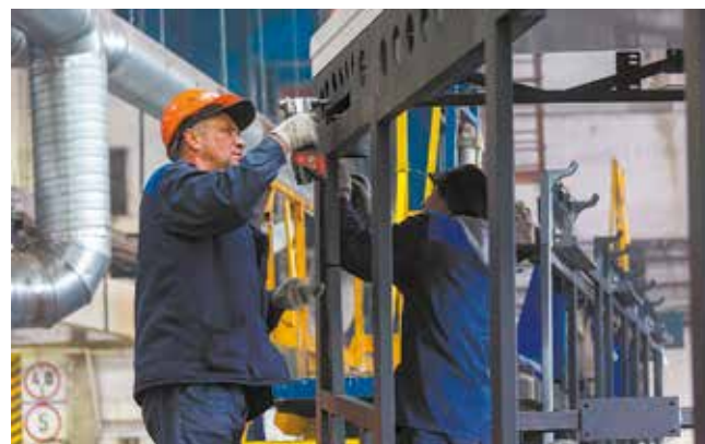
Люди — самый ценный ресурс предприятия