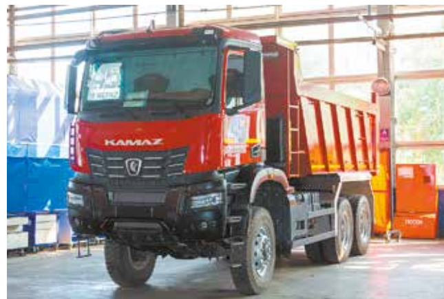
Самосвалы — наиболее востребованная сейчас техника

— В первую очередь своим коллективом. На «НЕФАЗе» работают добрые, отзывчивые люди. Благодаря их знаниям, умениям, тру-