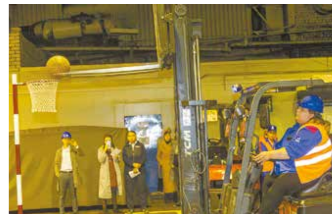
...И мяч послушно залетает в корзину

— Каждый из вас хорошо знает свою работу, обстановка вам знакома. Отбросьте волнение, и всё получится, —