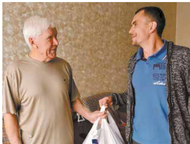
Визит гостей для пожилых людей — настоящая радость