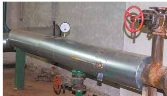
После замены основного трубопровода отопительной воды в термогальваническом корпусе № 302 станет теплее

Чтобы температура на каждом рабочем месте была комфортной, контроль за ней будет вестись круглосуточно.