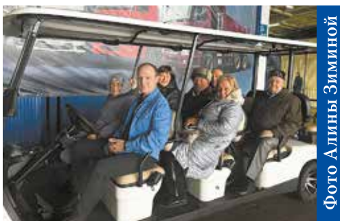
Самых дорогих гостей по заводу прокатили на электрокаре

Обсудить увиденное гости могли за чайным столом. Многие вспоминали свои рабочие будни, радовались за новое поколение заводчан, благодарили за возможность увидеть коллег, поговорить по душам.