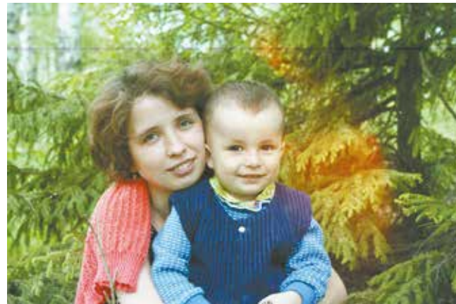
Портрет жены с сыном