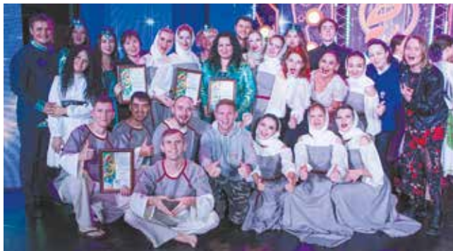
Первое место на зональном этапе придаст камазовцам уверенности в суперфинале

Суперфинал фестиваля «Наше время — Безнен заман» запланирован на 4-5 ноября. Призовой фонд суперфинала — более трёх миллионов рублей.