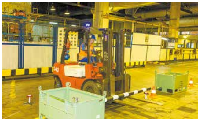
Перевезти трубу ой как непросто

максимально усложнить. За один проход водитель должен был продемонстрировать свои навыки установки тары в штабель, маневрирование змейкой, укладку длинномерного груза. Завершал этот марафон традиционный баскетбол.