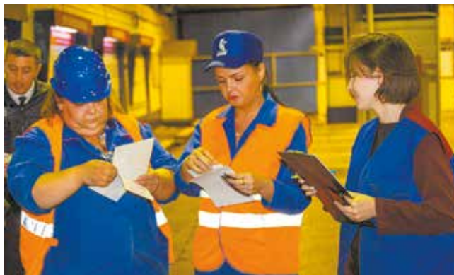
Что там в маршруте?