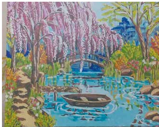
Картина по номерам — ещё одно увлечение Людмилы