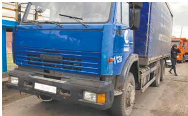
Этот грузовик принял груза на две тары больше положенного