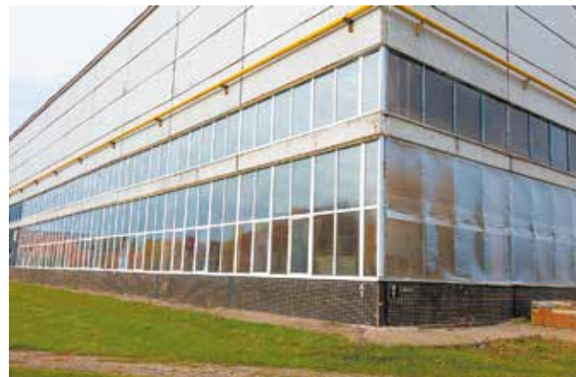
В производственных корпусах завода двигателей начали менять витражи на пластиковые

А следить за температурой воздуха в подразделениях будут работники местных диспетчерских пунктов и главные энергетики заводов. Сейчас на автопроизводстве как раз идёт установка температурных датчиков.