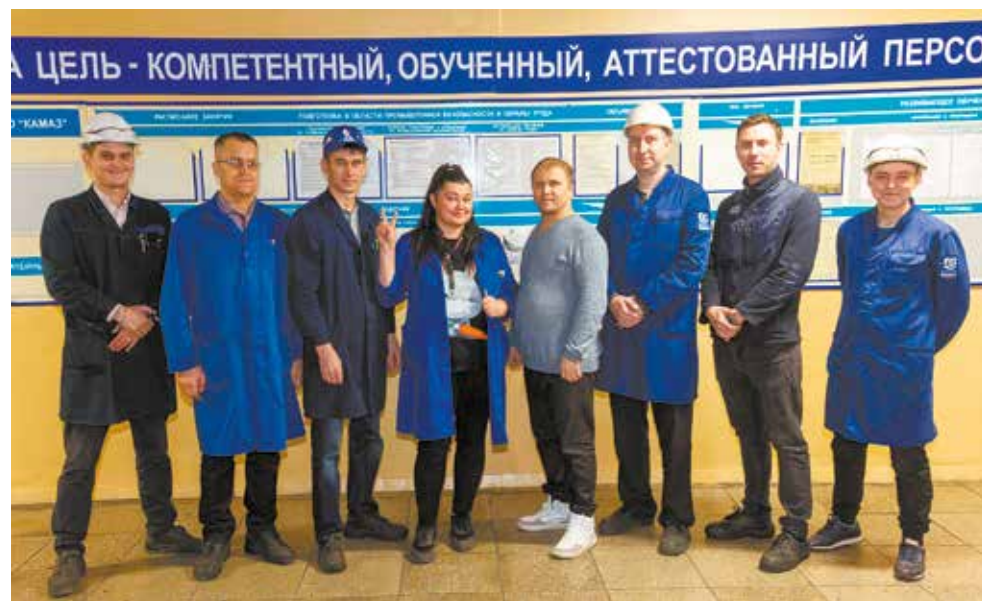
Восьмёрка смелых: на этих мастерах держится литейное производство

Знатоки конкурсов профмастерства наверняка могли подумать, что на ЛЗ позабыли ещё об одном слагаемом профессионального соревнования — практической части. Она была, но в этот раз в заочном формате. Справедливо рассудив, что