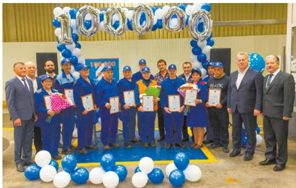
Заслуженные награды к памяtnому событию