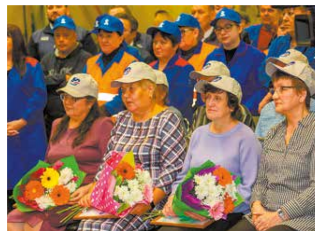
Эти люди начинали производство КПП

выпуска юбилейной коробки почётными грамотами 33ЧиК были награждены 15 работников завода. Среди них руководители цеха, слесари МСР, наладчики автоматических линий и агрегатных станков. Коллеги аплодисментами поддерживали всех отмеченных знаками признания. На фотографии с