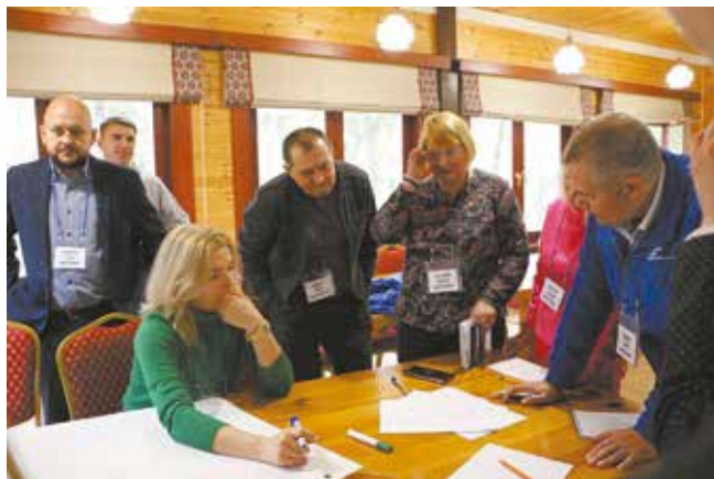
Участники бизнес-сессии вели себя как настоящие лидеры

— Приятно видеть, что никакие сложности не повлияли на желание наших председателей работать и генерировать новые подходы к работе. Идеи, которые выдали на-гора участники сессии, помогут профсоюзу выйти на новый уровень и определиться с ближайшими планами на три года. Самые успешные инициативы мы будем сопровождать и интегрировать в нашу работу.