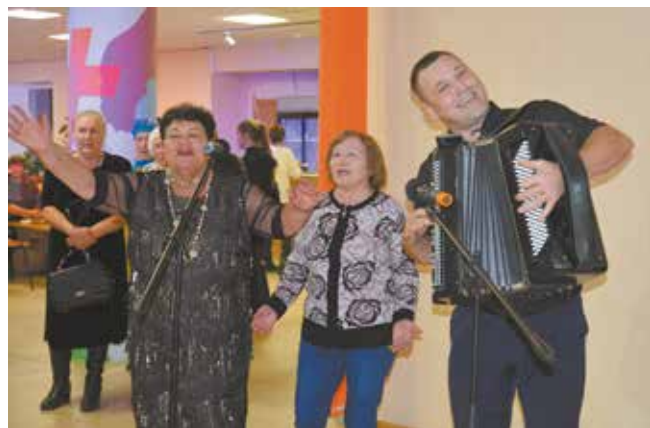
Есть баянист — будут и песни, и перепляс

14 октября вспомнили свои рабочие будни пенсионеры «НЕФАЗа». И все вместе, как когда-то давно, собрались, и о делах заводских перемолвились словечком на праздничном концерте, приуроченном к Дню пожилых людей.