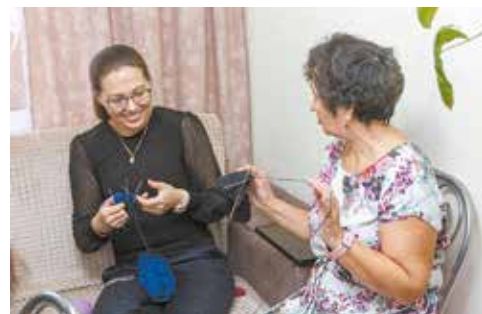
«А резинку лучше провязывать так...»