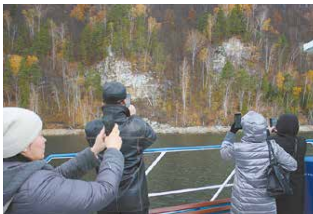
Прибрежные ландшафты так и хочется сохранить на память

Вот такой по-настоящему увлекательной и запоминающейся вышла субботняя экскурсия для работников «НЕФАЗа». Это отличный способ перевести дух после трудовых будней, чтобы с новыми силами начать новую неделю.