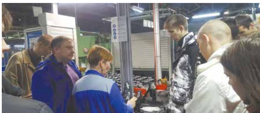
Все секреты сборки можно узнать только на производстве

Мастер-класс для второкурсников Камского государственного автомеханического техникума им. Л.Б. Васильева провели на автомобильном заводе. Ребятам предложили поближе познакомиться с профессией слесаря механосборочных работ.