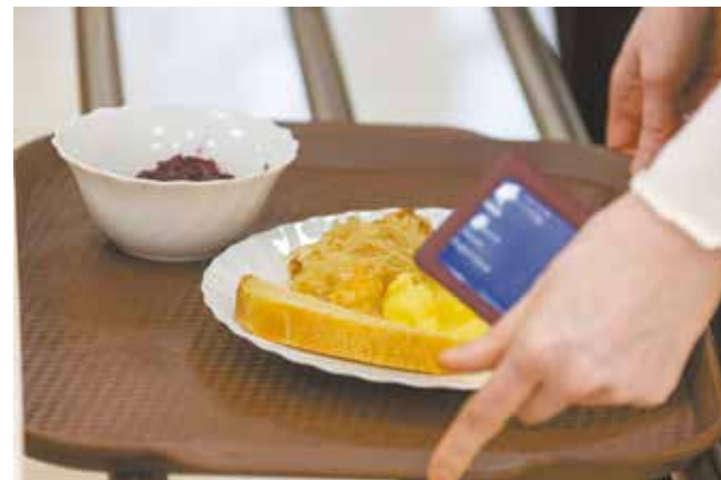
Прежде чем попасть к потребителю, блюдо проходит оценку бракеражной комиссии

Показатели качества оцениваются по пятибалльной шкале. На оценку «отлично» претендуют блюда, полностью соответствующие утверждённой рецептуре. «Хорошо» можно поставить, например, в случае недосола. «Удовлетворительно» даётся блюдам, имеющим отклонения от требований кулинарии, но пригодным для продажи. Бракуются из-