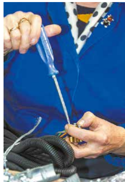
Чтобы всё заработало, нужны умелые руки и ясная голова

Со временем ей доверили возглавить ту самую бригаду, в которой она когда-то начала свой трудовой путь и прора-