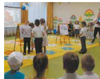
Раскрась машину как маляра!

Во время декады специально для детей подготовительной группы провели занятие «Автомобили КАМАЗ — это класс». Шестилетки почувствовали себя автолюбителями во время конструирования грузовичков, на мастер-классе узнали азы робототехники. Была организована выставка творческих работ «КАМАЗ — наше будущее», а рисунки для конкурса «КАМАЗ — машина на все времена» малыши готовили вместе с родителями. Успехи гоночной команды «КАМАЗ-мастер» вдохновили воспитателей и детей устроить спортивное состязание на свежем воздухе.