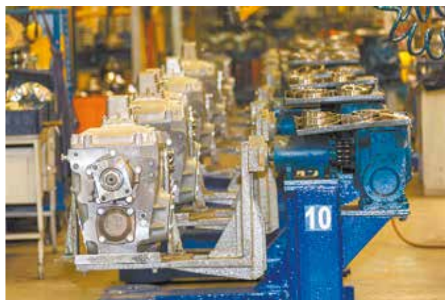
Сборка коробки на конвейере постоянно совершенствуется