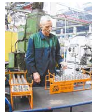
Для каждой детали есть своя ячейка

За один раз в спецтаре можно перевозить 30 деталей. Сейчас на участок заказано 10 штук тары, что покрывает потребность в межцеховых перевозках.