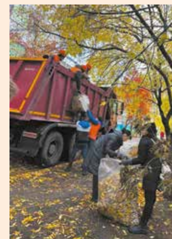
Убирай да грузить успевай!

Сейчас уборка продолжается на территориях, прилегающих к производственным и административно-бытовым корпусам подразделений. Закончится санитарно-экологический месячник 31 октября.