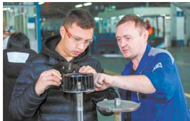
Объяснять тонкости парням — особое удовольствие для мастера

Образовательно-производственный центр НПК с «КАМАЗом» начнёт работу с 1 сентября 2023 года. К тому времени учебные площадки колледжа будут оснащены станками, к ним прибавятся три новые мастерские и порядка семи лабораторий. Бюджетные места будут ждать 350 будущих камазовцев.