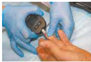
Портативные глюкометры мгновенно покажут уровень сахара в крови

— Такие выездные «Дни здоровья» проводим впервые, и тему профилактики сердечно-сосудистых заболеваний выбрали не случайно, — прокомментировала генеральный