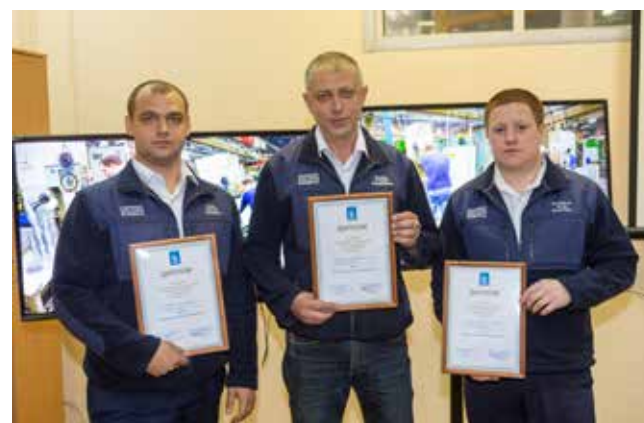
Тройка победителей примет участие в общекamazовском конкурсе профмастерства

Впрочем, много знаний не бывает, поэтому после конкурса, перед самым награждением, члены жюри провели с участниками работу над ошибками. Пояснили, в чём конкурсанты были неправы и почему — в дальнейшей работе информация мастерам обязательно пригодится.