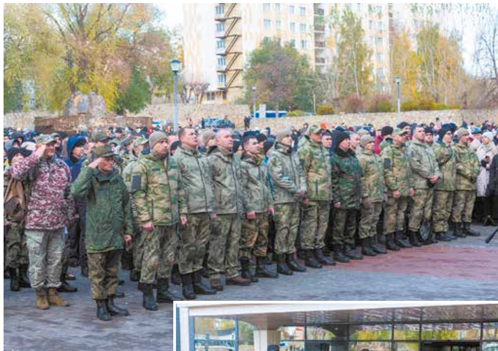
Руководители автогиганта и города дают бойцам почти отеческие напутствия