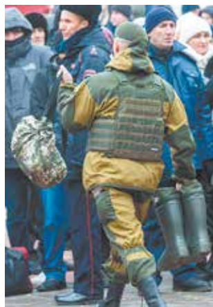
Челны экипировали бойцов как следует

не встречались, хотя я вхожу в состав единого штаба. А по «КАМАЗу» скажу точно — отказников не было. У тех, кто уезжает, настроение боевое, посмотришь на них — на душе спокойнее, потому что чувствуешь, что задача будет выполнена. Все прекрасно понимают, что задача серьёзная: фашизм остановить. Как один из них сказал: «Мне есть кого и что защищать в этом мире».