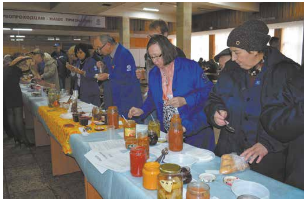
Заводчане угощались и удивлялись многообразию заготовок