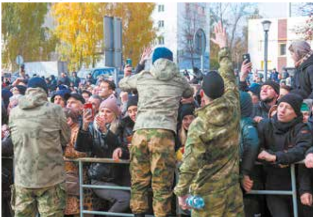
Минуты прощания с родными

А «КАМАЗ», в свою очередь, своих защитников помог обеспечить всем необходимым — камазовцы в толпе выделялись боль-