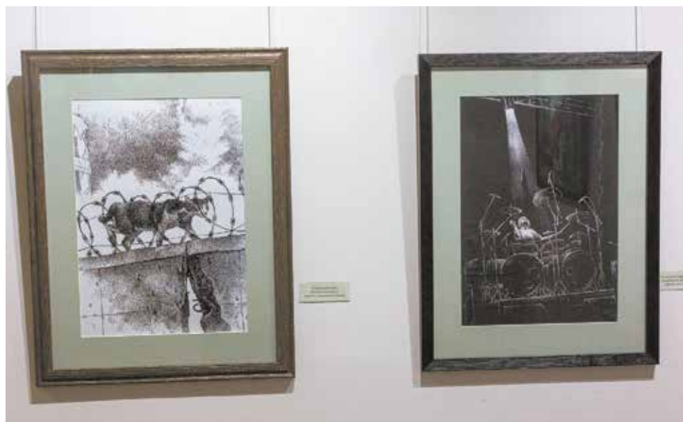
Эти графические работы неизменно вызывают симпатии зрителей