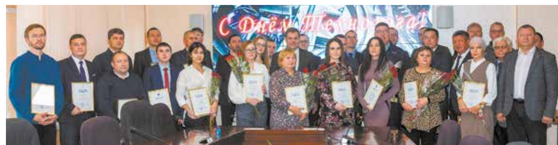
Лучшие технологи «КАМАЗа». Это признание подвигнет их на новые трудовые победы

— Я пришёл на кузнечный завод в конструкторский отдел инструмента и оснастки в 2006 году, после окончания ИНЭКА по специальности «Обработка металлов давлением». Работаю по специальности 16 лет, четыре из них — в должности начальника бюро. Основная моя задача — разработка чертежей поковок, переходов штамповки, проектирование штамповой оснастки для горячей объёмной штамповки (ГОШ), деталей автоматики, приспособлений, разработка математических моделей, моделирование процессов ГОШ, авторский надзор при изготовлении, наладке и испытаниях новых конструкций штамповой оснастки. Моя профессия нравится тем, что она творческая, решения часто приходится искать в производстве, а какие-то рождаются в обсуждении с более опытными коллегами. Эта победа — результат сплочённой работы технологической службы и производства, и она вдохновляет на новые достижения.