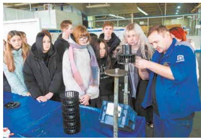
Интерес к технике проявили даже девочки

Приоритетом в обучении подразумеваются компетенции, объявленные работодателем, и лаборатории будут