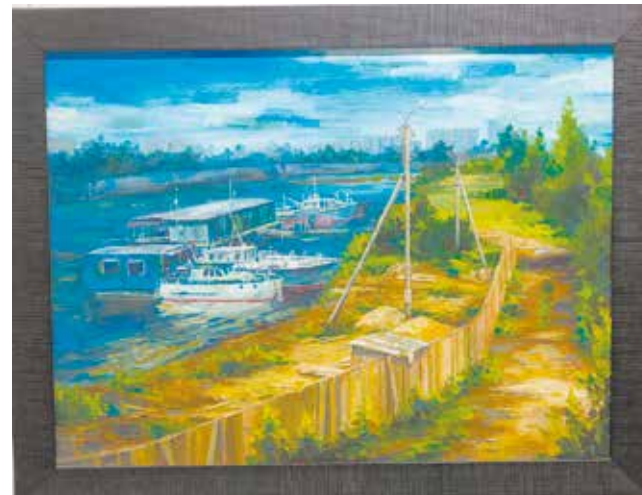
«Речной порт» — одна из её любимых картин матери Вадима

Всего на экспозиции, объединившей два периода жизни молодого художника, представлено 46 живописных и графических работ. Она продлится до 30 октября. В следующем году мама художника намерена организовать выставки картин Вадима Кукушкина в Казани и Санкт-Петербурге.