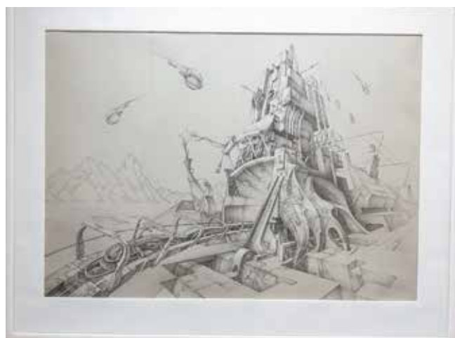
«Портал в подземный город» стал признанием мастерства молодого художника