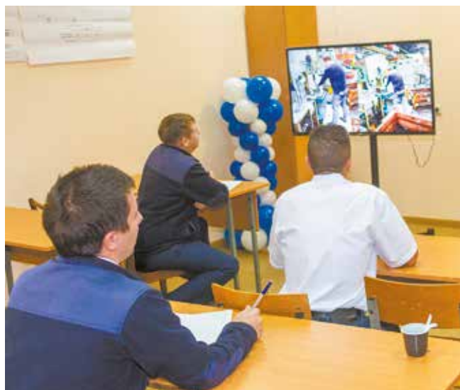
На этих фото мастера нашли 22 нарушения. Блестящий результат!

Всего побороться за победу заявилось 18 участников. Испытания подготовили совместно администрация и профком завода. Мастеров ждали два этапа: теоретиче-