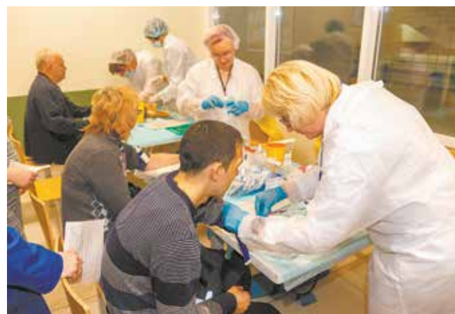
В обеденный перерыв в столовую АБК-210 потянулись желающие проверить свои показатели

ректировке меню в нашей столовой. Планы большие. После основных заводов планируем пойти по другим подразделениям компании. Подобные мероприятия будут и впредь проводиться, и в зависимости от полученных результатов мы поймём, какие меры профилактики принимать в дальнейшем, — резюмировал профлидер.