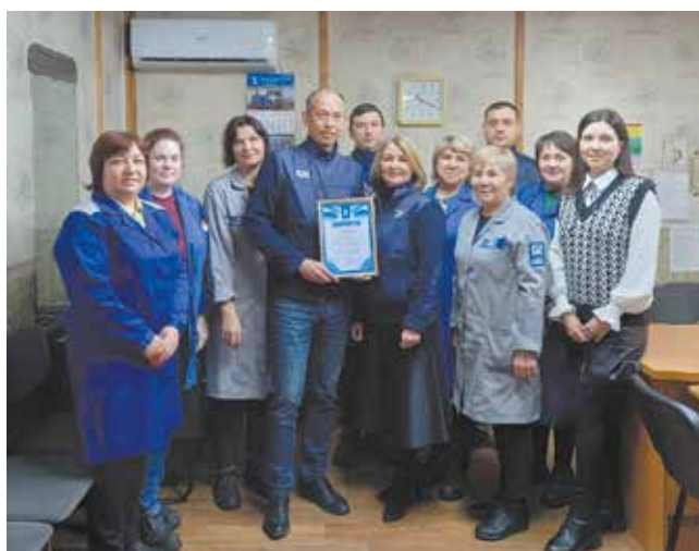
В цехе пучков проводов с дисциплиной полный порядок

Участников соревнования — основные и ремонтно-вспомогательные цеха — разделили на три группы, в зависимости от численности, ведь в большом коллективе сохранять порядок гораздо сложнее. А организаторы как раз рассчитывают на то, что более дисциплинированная часть коллектива поможет в профилактике и снижении нарушений, урезонивании менее сознательных коллег.