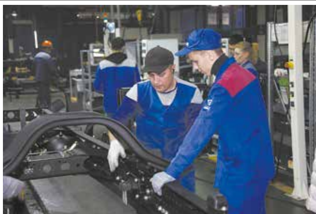
Наставник покажет, как надо узел крепить

Рабочий день начался по определённому распорядку: получение спецодежды, инструктаж, знакомство с мастерами и рабочими местами, изучение операций. Ребят направили в цеха сборки автомобилей и сборки кабин. Под руководством наставников они трудились на подборке узлов, а затем устанавливали их в ритме