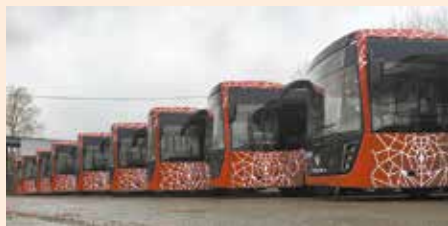
У пермских автобусов свой дизайн

Поставка пассажирской техники проходит в несколько этапов: 33 автобуса НЕФАЗ уже поступили в распоряжение МУП «Пермгорэлектротранс», ещё 31 появится в автопарке муниципального перевозчика в ближайшие месяцы.