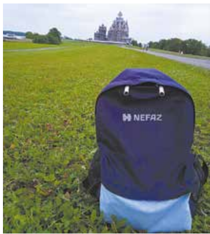
Этот рюкзачок заснят в далёкой Карелии

Свои истории рюкзачки с логотипом NEFAZ поведали с помощью фото. И показали своих владельцев, конечно, поучаствовавших в фотоконкурсе «Путешествия одного рюкзачка». Главного героя соревнования нужно было запечатлеть на фоне достопримечательности во время отдыха и поделиться краткой историей своего путешествия.