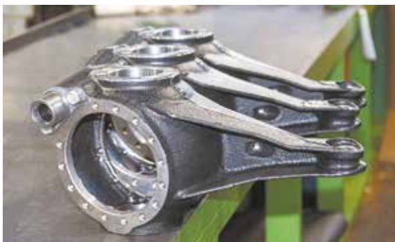
Обработку корпуса поворотного кулака планируется перевести на обрабатывающие центры

Сейчас большой спрос на полноприводные автомобили. В следующем году их доля в общем объёме выпуска продукции увеличится, планируется нарастить и темп сборки ГСК. При этом очень важно точно рассчитать загрузку мощностей во время работ по модернизации — большая их часть придётся на 2023 год, а сам проект должен быть завершён до конца 2022-го.