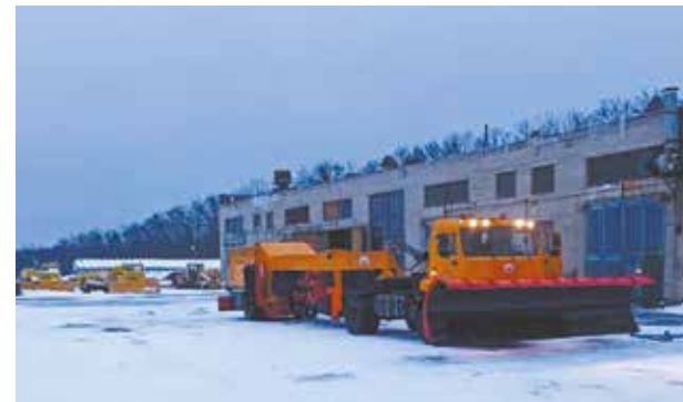
Новые машины прошли испытание первым снегом в ночь с 28 на 29 октября

А персонал аэропорта прошёл сезонное обучение, которое регулярно проводится в преддверии смены периода навигации, включая противоаварийные тренировки и инструктажи.