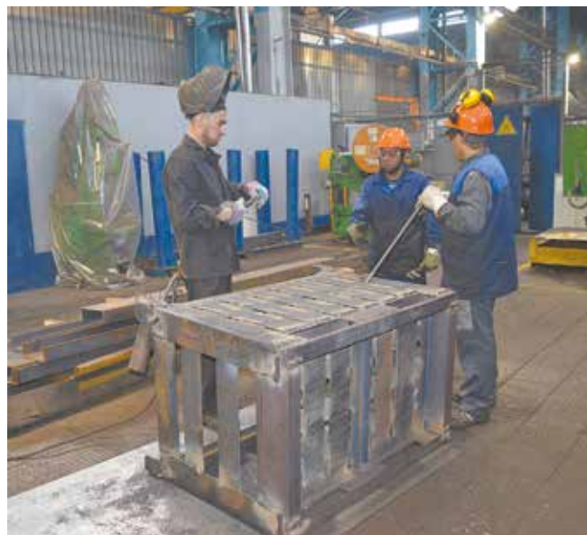
На участке идёт изготовление новой тары

На кузнечном заводе чаще стали испытывать дефицит оборотной тары. Собрав своими силами опытную партию новой тары, здесь надеются на оперативное решение проблемы.