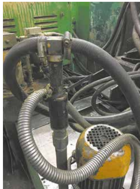
С механическими обратными клапанами, управляемыми гидравлическим способом, простои из-за аварийной замены СОЖ на этом оборудовании исключены