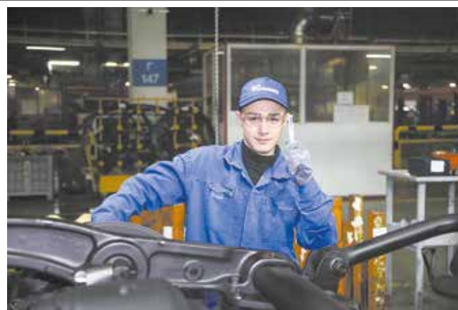
У меня всё получится!

Специально для гостей была проведена экскурсия