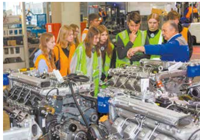
Где ещё узнаешь столько о двигателях, как не на производстве?

Некоторым из них пришлось, конечно, и в очереди постоять, но ради эмоций и впечатлений можно и подождать. Когда ещё доведётся посидеть в огромном грузовике? Впрочем, кто знает... Быть может, через несколько лет эти ребята вернутся на «движки» уже настоящими инженерами и, проходя мимо учебно-технологического комплекса, с ностальгией вспомнят эту экскурсию и навесят старого знакомого.