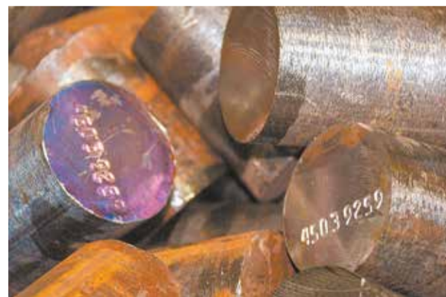
Концевые отходы тоже можно использовать