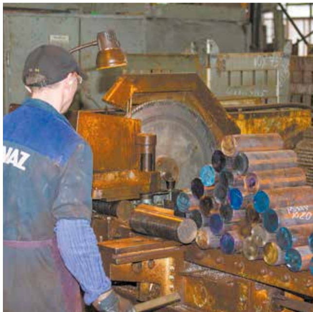
На резку металлопроката диаметром 80 мм на старом станке 8Г663 уходит шесть минут, а на новом — всего полторы