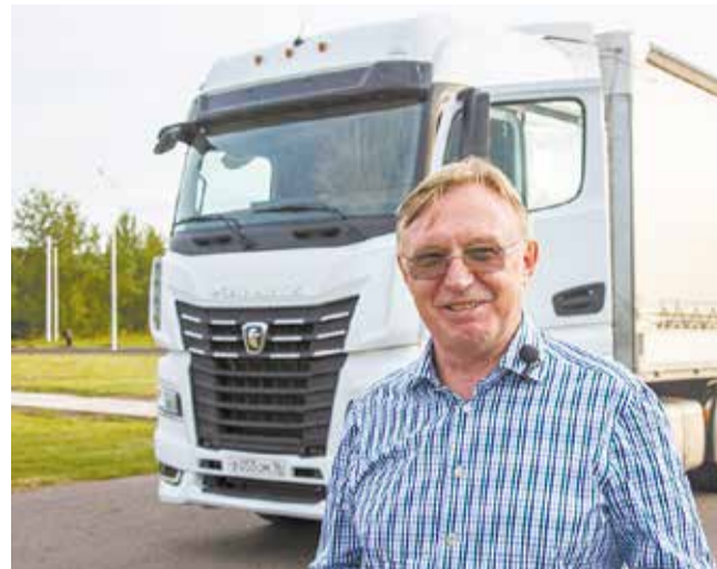
Гендиректор «КАМАЗа» способен на многое. На фото — после тестирования новинки К5 на трассе М7

— Вот простая деталь — кронштейн, ничего особенного, но без него двигатель не соберёшь. Только по мотору 6,7 литра локализовано 86 деталей, из них 68 — за март-апрель. Вдумайтесь! У нас, когда мы начали производство таких двигателей, цель была обработать только базовые крупные узлы, эти детали мы проинвестировали. Остальное поступало из Европы, Китая, США. Наступило время, чтобы освоить то, что мы раньше не делали.