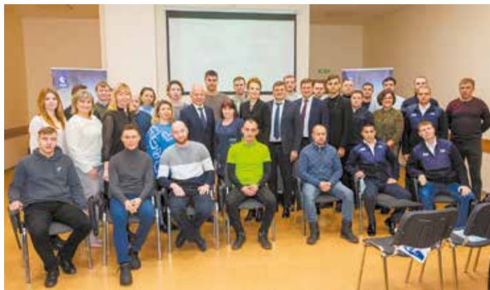
Команда мастеров к конкурсу готова!

Конкурсные задания должны быть актуальны и для мастера, работающего на производстве, и для руководителя начального уровня, отвечающего за работу инструментальных