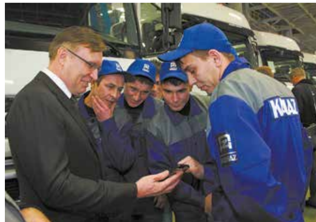
Доверительность в отношениях с рабочими — отличительное качество рулевого «КАМАЗа»

— Например, я считаю достижением нашей команды и компании то, что мы рискнули пойти на перепроектирование продукта и перепроизводство. Я говорю об автомобиле серии К5. Я понимал, что сделать это за короткий промежуток времени очень сложно. Но мы смотрели на пять-шесть лет вперёд и понимали, что без нового продукта компании нет места на рынке. И когда сошёл с конвейера первый К5, радовались, как только что родившемуся ребёнку. Другое поколение машин, другой уровень... Такое было счастье! Я разговаривал с рабочими на главном конвейере, они с гордостью говорили: «А мы и такое можем делать!»