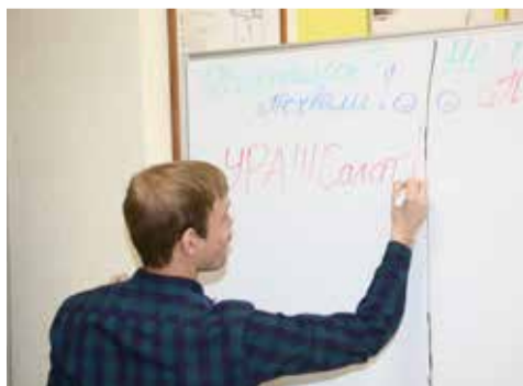
Обратную связь работники столовой получают сразу после обеда

В iFCM group настроены на продуктивный диалог с потребителем. Сотрудники столовых меняют рецептуру, отслеживают время нахождения камазовцев в очереди, установили доски отзывов о качестве блюд. Обновлённое меню должно появиться после Нового года.