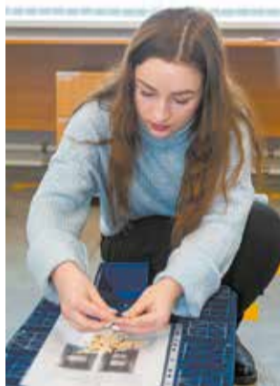
Сортировать в неудобной позе быстро не получится