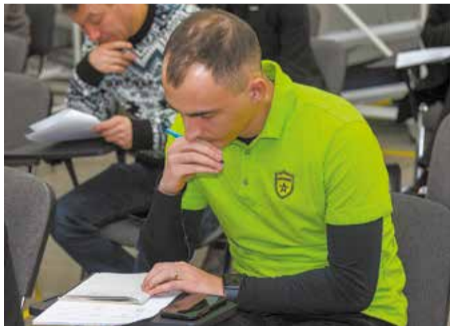
Над расчётом производительности надо крепко подумать

На втором этапе требовалось оценить эргономику смоделированного на Фабрике процессов рабочего участка и предложить улучшения. Участникам конкурса пришлось испытать на себе, каково это — работать в неудобной позе. Команда по чек-листу анализировала количество движений, вызывающих дополнительное напряжение, и создавала идеальные рабочие места, где трудиться максимально комфортно. На личном примере руководители убедились в том, что от эргономики рабочего места во многом зависит производительность труда и сохранение здоровья камазовцев, и теперь будут уделять этому гораздо больше внимания на вверенных им участках.