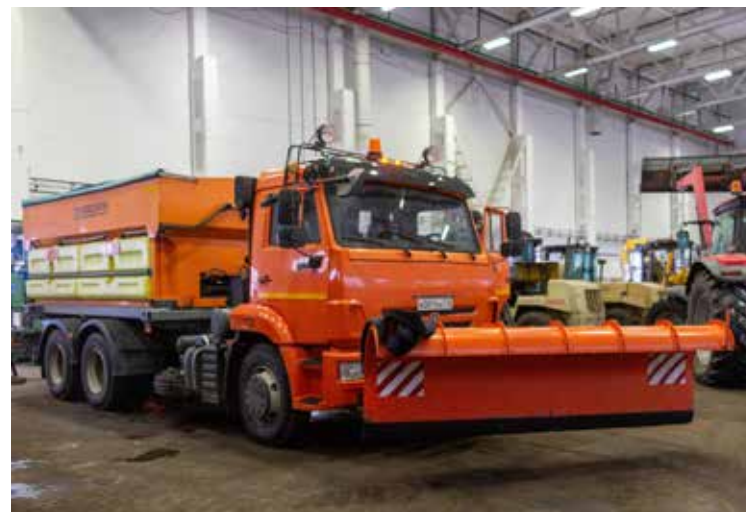
КДМ-115001 распыляет на дороги антигололёдную смесь