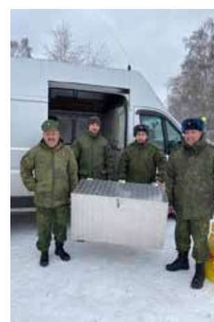
Металлическая тара — необходимая вещь

Мобилизованные горячо поблагодарили руководство «КАМАЗа» за эту встречу. Для них возможность повидаться с роднёй очень важна, особенно накануне Дня матери. Благодаря автогиганту поздравить своих мам у