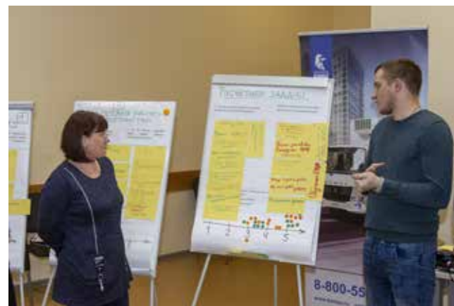
Мастера теперь знают, как правильно сделать расчёт мощностей