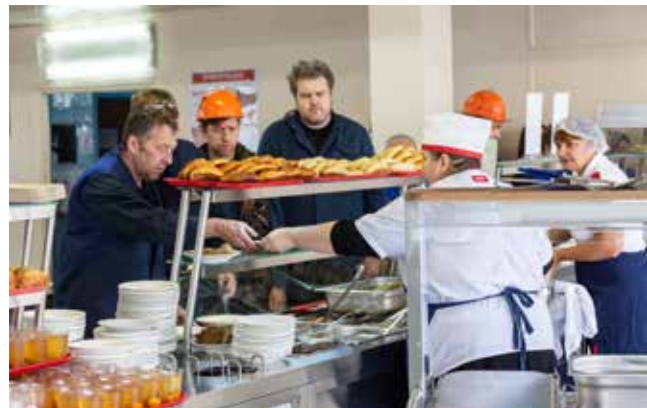
Горячим питанием на «КАМАЗе» охвачены лишь 55% сотрудников. Этот показатель надо повышать

— Всем нужна построенная система оценки удовлетворённости, и не раз в