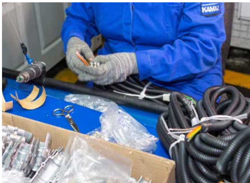
Чтобы провод жгута не застревал в гофрированной трубке, стали использовать глицерин. Дело ускорилось