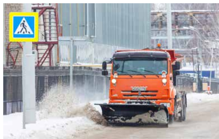
Коммунальная машина КДМ-829 не только снег убирает, но и рассыпает пескосоляную смесь