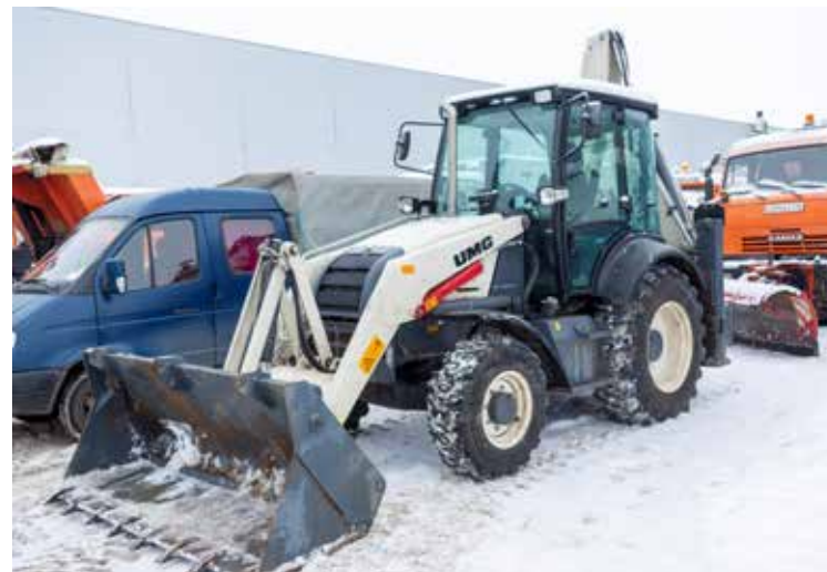
Три в одном: бульдозер, погрузчик и экскаватор TLB-825