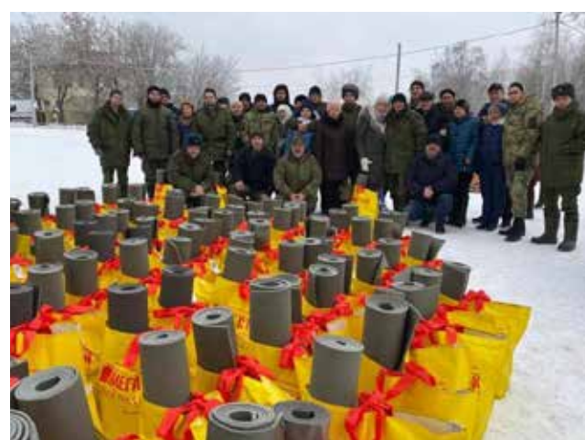
Принимайте походные принадлежности, ребята

Море эмоций вызвала у солдат встреча с роднёй. Не считая сопровождающих от компании, из Челнов на полигон приехало 55 человек. Люди без раздумий воспользовались предла-