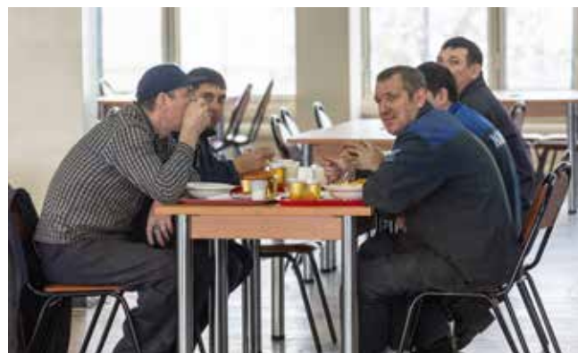
Комплексные обеды — хорошее решение проблемы очередей