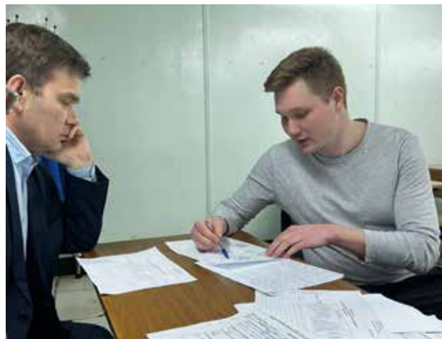
Конкурсанты должны были объяснить принцип построения технологического процесса