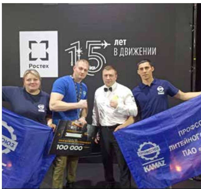
В этом году камазовская команда выступила достойно, войдя в пятёрку лучших

— Когда-то занимался боксом, поэтому удар у меня поставлен, — поясняет он. — Это здорово помогает сейчас. Ведь сила удара — это в первую очередь правильное использование массы собственного тела, верное приложение силы. Физика чистой воды, по сути. Нужно уметь переносить вес тела с ноги на ногу, вкладываться в каждый удар, да ещё и делать это быстро. Так что для хороших результатов нужна силовая подготовка, тренировки на выносли-