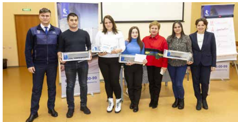
Впервые лучшей признана команда логистического центра