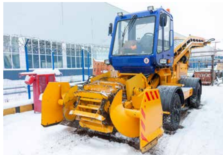
Снегопогрузчик СНП-18 — машина функциональная

Работники ДСТиСАД заверили, что все работы выполняются по плану, согласно технологическому порядку. Механизаторы и мастера переведены на скользящий график, это способствует оперативному реагированию на погодные изменения. Основная работа по расчистке дорог, тротуаров и вывозу снега с площадок проводится в дневное время, а в ночь выводится дежурная техника. Снег вывозится и складывается на согласованной площадке на резервных землях «КАМАЗа». А в случае возникновения нештатных ситуаций и обстоятельств необходимо подать заявку в диспетчерскую.