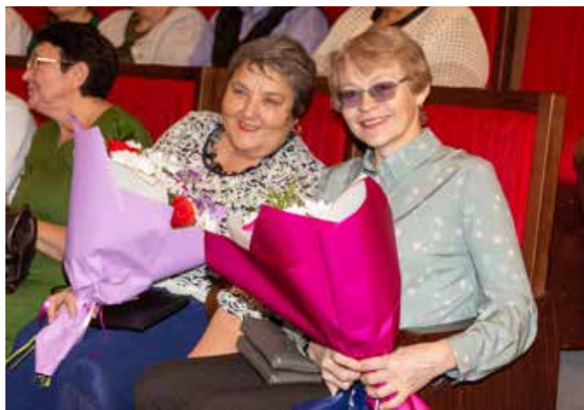
Прекрасные букеты — благодарность за вклад в развитие предприятия