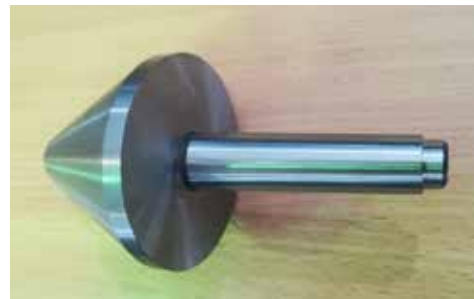
Благодаря таким конусным вставкам стало возможно проводить ручной замер биения в центрах диаметром более 20 мм