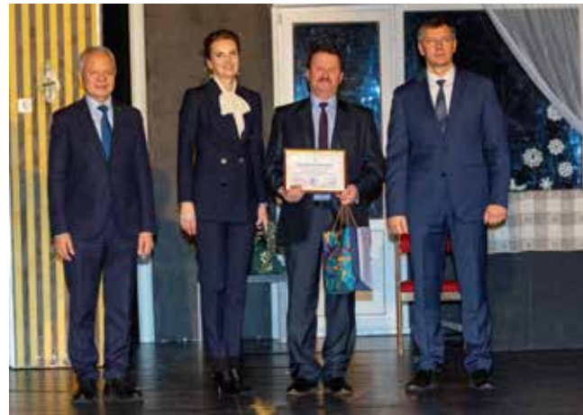
На сцене в честь 15-летия предприятия награждено 18 человек