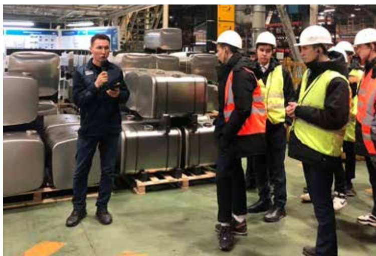
На линии сварки топливного бака есть что посмотреть

На заводе надеются на новые встречи со студентами. Их уже пригласили на производственную практику, а там и до выбора первого места работы недалеко.