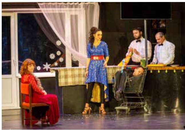
Логисты увидели, как незапланированный девичник обернулся для трёх подруг чередой неожиданных событий