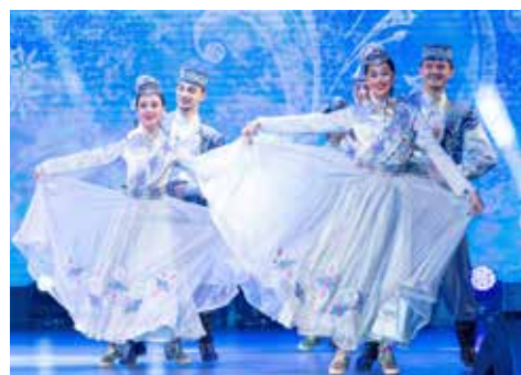
Творческий подарок от театра танца «Булгары»

Ещё медицинские работники провели анкетирование, чтобы определить приоритетное отношение камазовцев к оздоровлению. Следующая встреча с сотрудниками предприятия состоится уже в 2023 году.