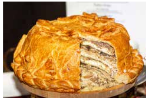
Такой богатый курник непременно станет украшением любого банкета

А жюри ещё раз убедилось — камазовские повара умеют удивлять. Эх, эти блюда бы да в столовые!..