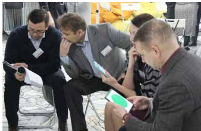
В деловой игре участники бизнес-сессии решали серьёзные задачи

площадок «КАМАЗа», но и дочерних предприятий, расположенных в российских регионах, а также в Казахстане.