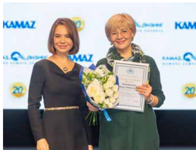
Получить признание от основателя компании — большая ценность для работников «КАМАЗ-ЛИЗИНГа». Лучшим работникам вручены благодарственные письма депутата Госдумы