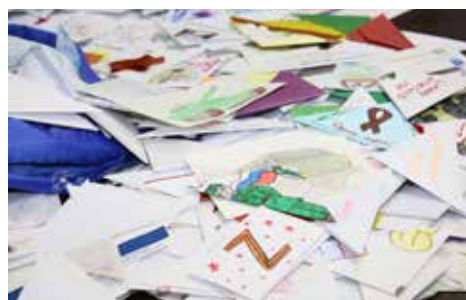
Больше полутора тысяч писем отправятся к западным границам России