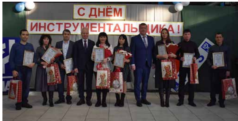
Награды вручены настоящим профессионалам РИЗа

В следующем году у инструментальщиков наверняка будут новые победы, ведь успешное развитие компании во многом зависит от точного и прочного инструмента.