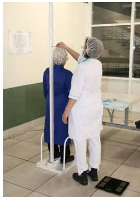
Нехитрые замеры могут сказать о многом