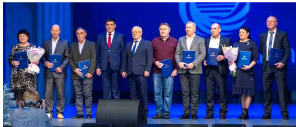
Звания «Ветеран ООО «Челныводоканал» удостоены восемь работников