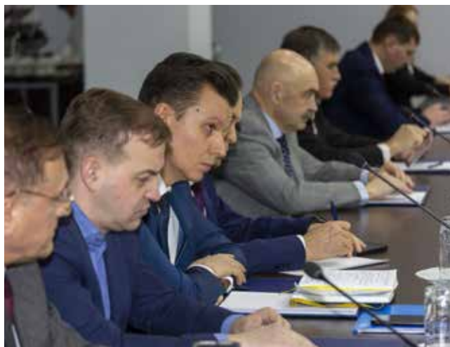
Передовая инженерная школа сейчас нужна как никогда