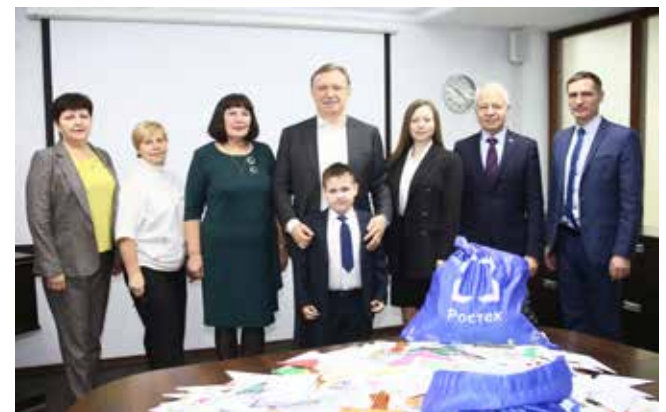
Акция «Весточка надежды» прошла благодаря этим людям