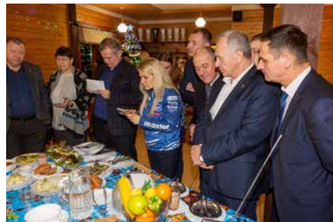
Дегустация — дело ответственное