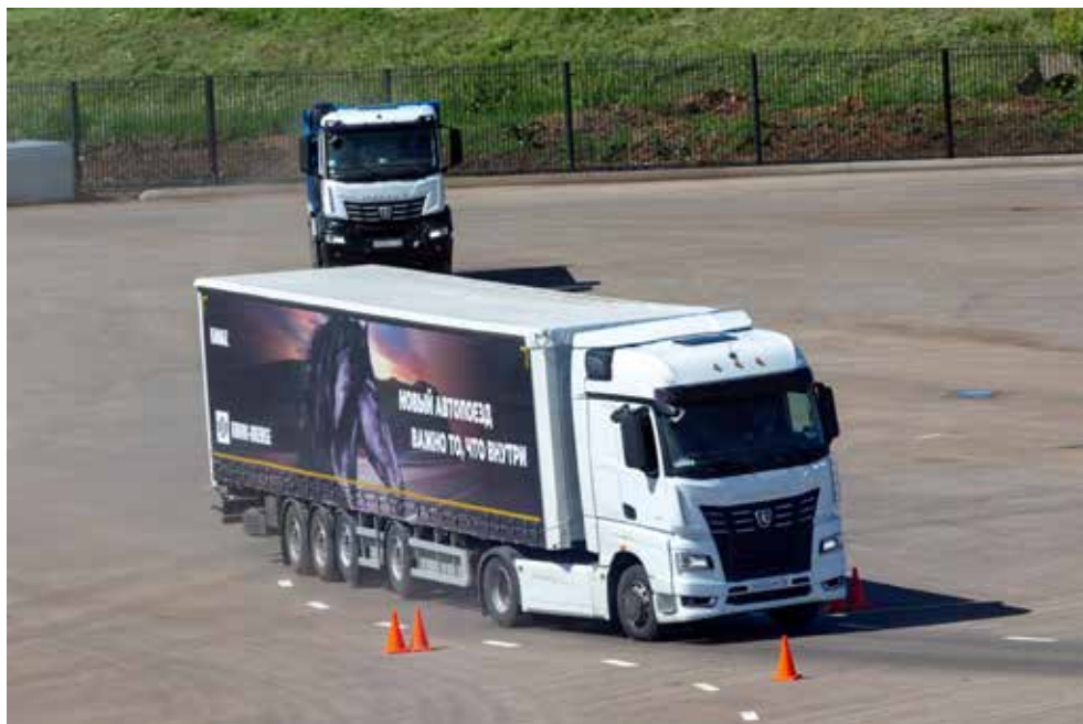
В следующем году будет выпущено свыше 10 тысяч автомобилей поколения К%