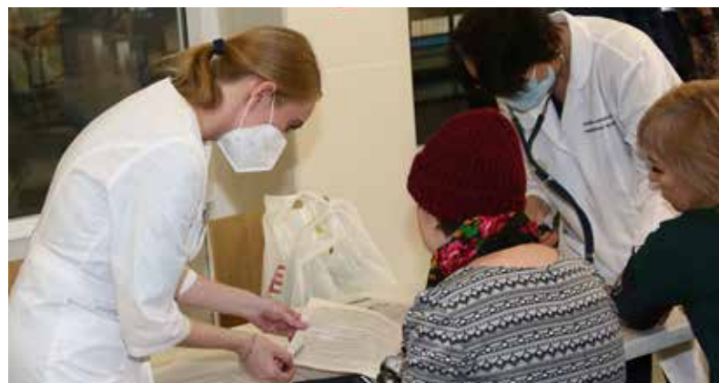
Врачи плохого не посоветуют