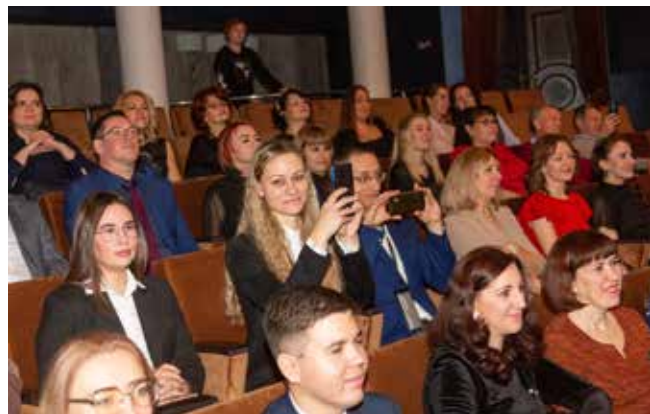
Юбилейный вечер удался!