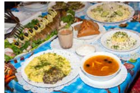
«Операция Ы» порадовала и сервировкой, и вкусом