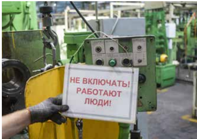
Предупреждающий плакат — одно из средств безопасности. Но и о других забывать нельзя

Судя по материалам, предоставленным департаментом промышленной безопасности и экологии «КАМАЗа», в это утро наладчики цеха шестерён на гидравлической тележке везли детали. На их пути оказалась лестница, предназначенная для обслуживания привода натяжной станции демонтированного грузонесущего конвейера, из-за этого проход для провоза тары стал уже. Один из наладчиков решил убрать препятствие и обратился за помощью к коллеге. Мужчина, встав под привод натяжной станции, подце-