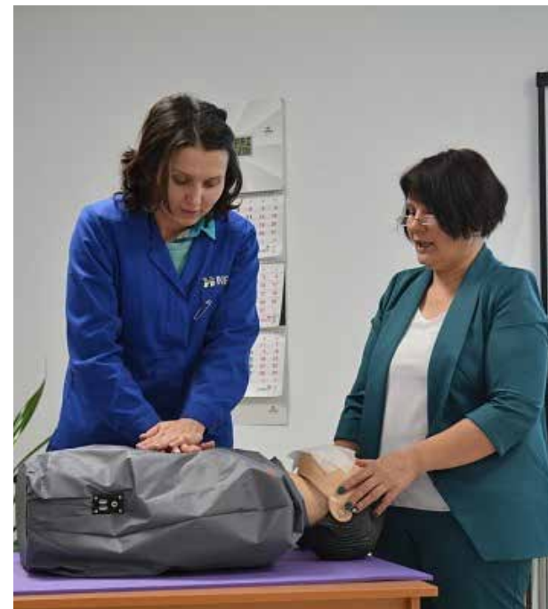
Сердечно-лёгочная реанимация, проведённая вовремя, сохранит жизнь

Курс включает в себя теоретические основы оказания первой доврачебной помощи на месте при различных происшествиях, а также показ тематических видеороликов. Теоретические материалы подкрепляются и практикой. С помощью робота-тренажёра «Гоша» обучающиеся отрабатывают навыки проведения сердечно-лёгочной реанимации.