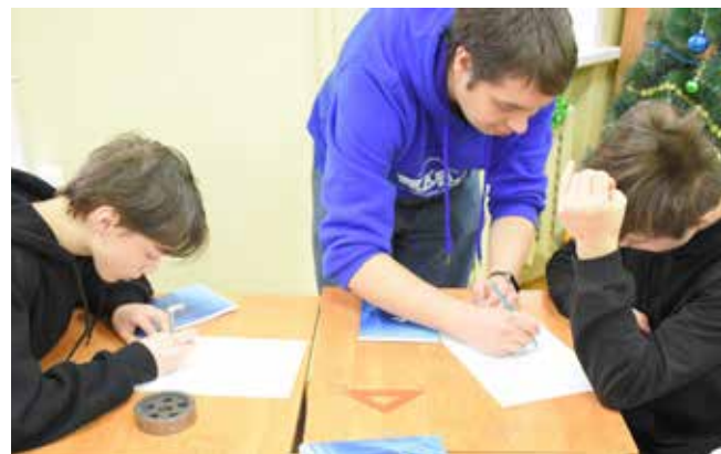
Мастер-класс по основам инженерной графики