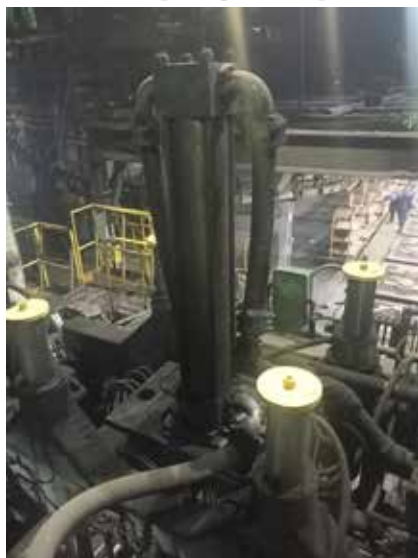
Защитные шайбы служат ограничителями выпадения механизма

— Я заметил потенциально опасную проблему: на АФЛ СПО-1 в механизме «К» (сборщик) при срывании резьбы штока цилиндра лифта или при полом-