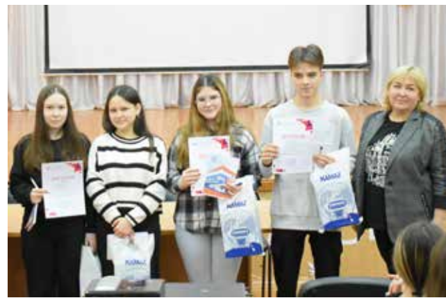
Награждение победителей викторины, проводимой Техническим колледжем

Представители «КАМАЗа» дали возможность почувствовать себя в рабочих профессиях. Например, в процессе изготовления декоративной свечки ребята на водяной бане плавил парафин (плавильщик), потом заливали его в формочки