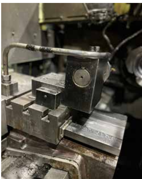
...и работать с деталями, полученными на обновлённом агрегате, стало гораздо приятнее

Ежедневно со 2 по 8 января в ремонтных работах участвовало 1030 механиков и 330 представителей энергетической службы.