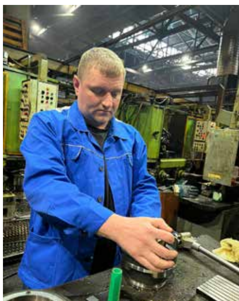
На этом механизме автоматической линии в цехе шестерён Ав3 восстановили направляющие и поменяли пластины...

Лимитирующее технологическое оборудование начали запускать сразу после ремонта с 3 января — нужно было ещё раз проверить его возможности, убедиться в надёжности агрегатов. Всё получилось! Ресурса станков и автоматических линий хватит до новой встречи с техническими докторами.