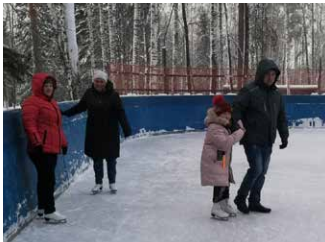
Первые шаги на коньках безопаснее делать на загородном катке

В лес прессоворамщики приезжали каждый день до начала сильных морозов. Любители зимних видов спорта успели хорошенько размяться. Скоро начнутся соревнования — сначала заводские, а потом и камазовская Спартакиада. Надо быть в форме!