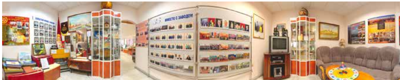
Круговые панорамы помогут совершить виртуальное путешествие по музею «НЕФАЗа»

Попасть в виртуальный музей можно через официальный сайт предприятия nefaz.ru, зайдя в раздел «О компании».