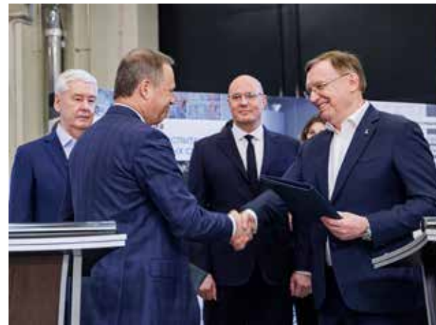
Сотрудничество «КАМАЗа» и МГТУ им. Н.Э. Баумана уже давно взаимовыгодно

Подписание договора прошло в рамках торжественного мероприятия, в ходе которого мэр Москвы Сергей Собянин и зампред правительства РФ Дмитрий Чернышенко открыли новые корпуса научно-исследовательского кластера МГТУ им. Баумана, в том числе инжиниринговый центр наземных транспортно-технологических систем, предназначенный для выполнения научно-исследовательских и опытно-конструкторских работ.