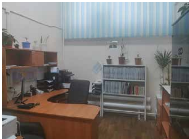
Сотрудники группы пожарной безопасности отдела ОТиПБ АвЗ сделали из своего кабинета эталонный офис, за что получили 80 тыс. рублей