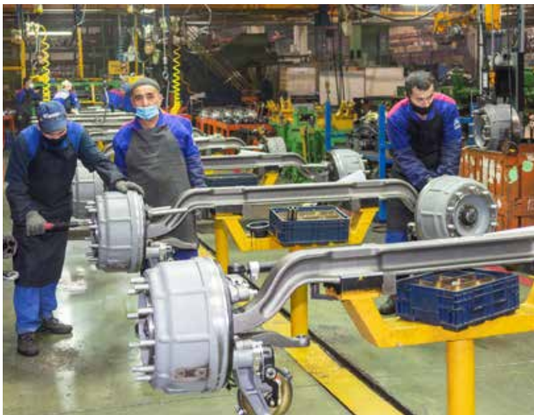
Минтруд Узбекистана в 2022 году наградил «КАМАЗ» как работодателя, создавшего лучшие социальные условия для граждан этой республики, — таких специалистов у нас свыше 600

— С сентября 2022 года выплачиваем мобилизованным материальную помощь в размере 50 тыс. рублей ежемесячно, сохранили за ними рабочие места. Всех призванных мы обеспечили экипировочными комплектами из 27 наименований, в том числе летнее и зимнее обмундирование, каска, бронежилет. Сейчас думаем над тем, как обновить экипировку. В декабре посетили все семьи мобилизованных работников, чтобы окружить их поддержкой и заботой, детям вручили новогодние подарки, организовали их участие в новогодних мероприятиях города и республики. Работа будет продолжена.