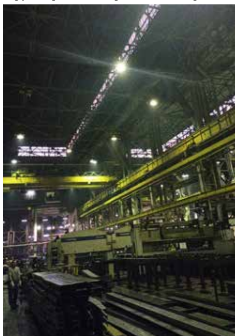
Таким ещё недавно было освещение на кузнечном заводе...

ного завода в 2021 году. В прошлом году работа в этом подразделении продолжилась — на этот раз модернизация освещения была сделана в КПК-1. Вместо морально и физически устаревших 642 светильников трёх типов суммарной мощностью 646,5 кВт установили 226 светодиодных светильников Ecomex Basik PowerX суммарной мощностью 105,8 кВт. Экономия от модернизации — 40 млн рублей в год, при этом освещённость по всему корпусу улучшилась, она сейчас составляет 300 люкс. Изменения позволили повысить производительность труда, улучшилось и настроение камазовцев.