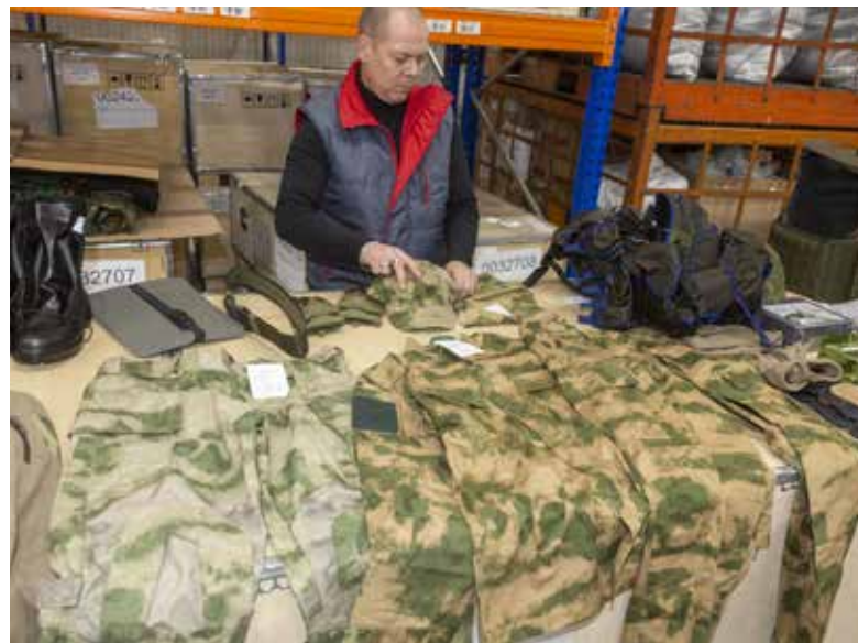
Первые экипировочные комплекты для мобилизованных камазовцев были собраны в октябре. Сейчас уже думают над их обновлением

— Мы привлекаем к сотрудничеству граждан Узбекистана с 2021 года. Сейчас на «КАМАЗе» работает 638 человек, около 450 из