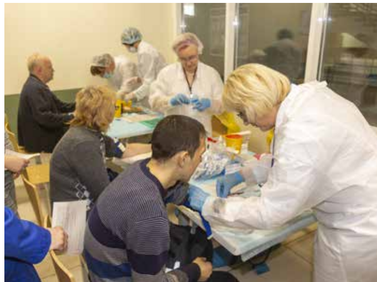
Дни здоровья — дополнительная профилактика заболеваний

достижений работника коллегами и руководством. Награды за успехи повышают внутреннее удовлетворение работников, у людей появляется чувство значимости своего труда. В 2023 году будет введён новый вид наград — звание «Отличник качества», оно будет присваиваться к Всемирному дню качества шести высокопрофессиональным рабочим основного и вспомогательного производства заводов.