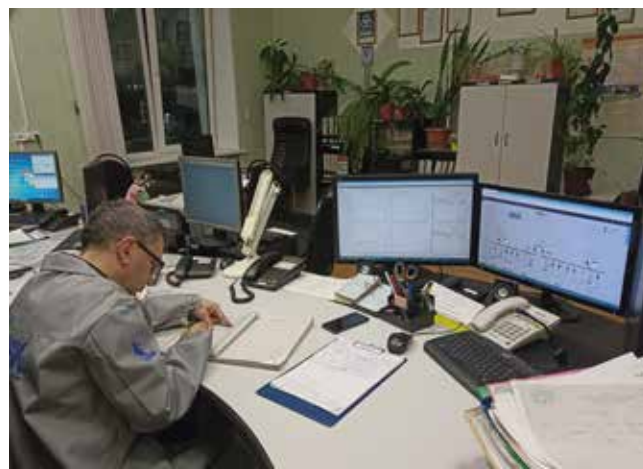
В энергодиспетчерском отделе внедряется система дистанционного контроля температуры в производственных корпусах

В этом году для улучшения температурного режима на въездных воротах в корпусах литейного завода, АвЗ и ПРЗ были установлены 10 энергосберегающих усиленных воздушных завес шибера типа. В них струи пересекают проём и