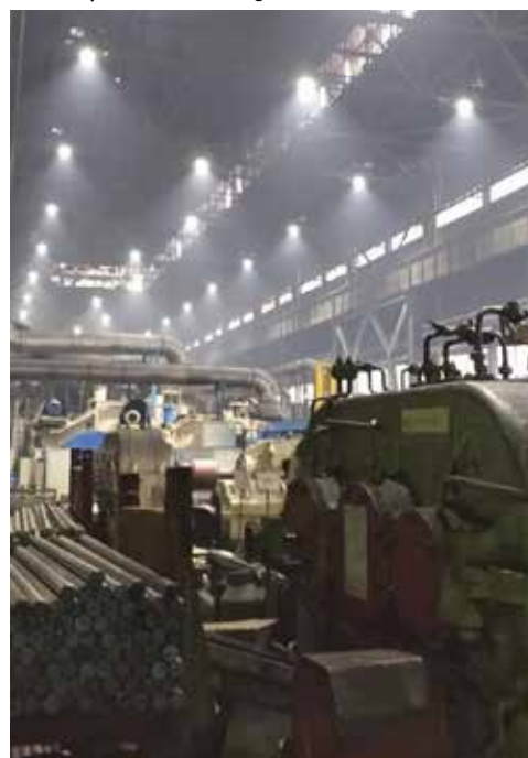
...а после замены ламп работать здесь стало гораздо комфортнее

В этом году проекты по модернизации освещения также в рамках энергосервисных контрактов планируется реализовать на ПРЗ, литейном заводе и заводе двигателей.