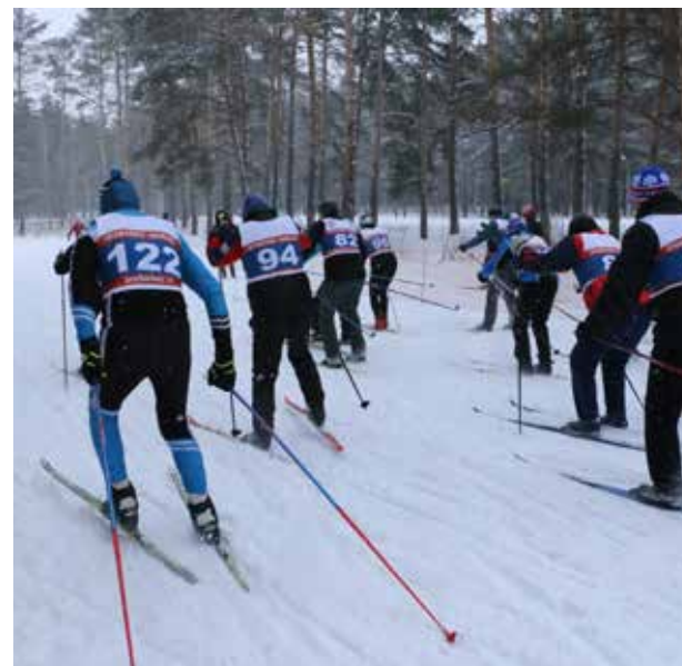
Лыжные гонки в марте откроют Спартакиаду-2023

Камазовцы также намерены принять участие и в Спартакиаде Федерации профсоюзов РТ и завоевать там награды.