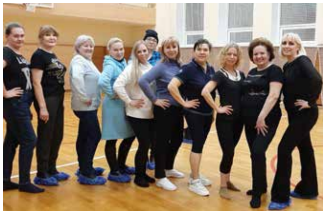
Профактивисты ПРЗ станут первыми, кто внедрит производственную гимнастику среди рабочих

Новость о его гибели стала настоящей трагедией как для его близких, так и коллег по работе на «КАМАЗе».