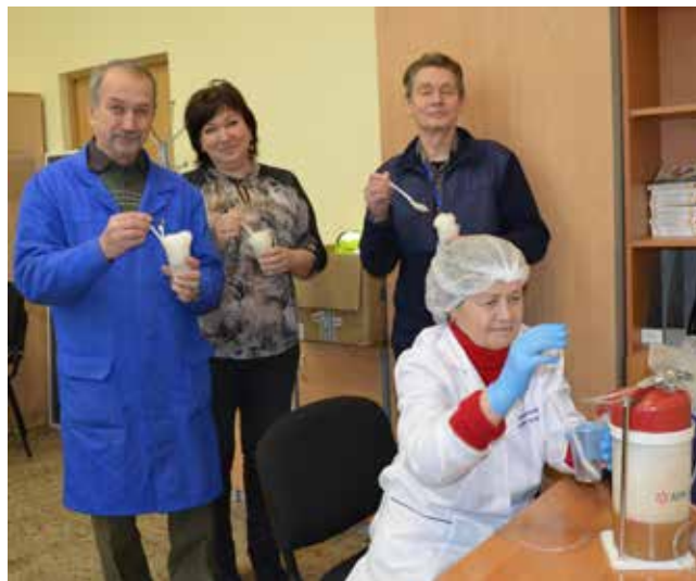
Сотрудники производственно-технического отдела оснастки с удовольствием насыщаются полезным кислородом