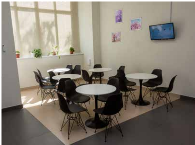
Комнаты психологической разгрузки стали новинкой 2022 года

2022 года рост производительности в бригадах, где работали универсальные работники, в среднем составил 16%. Всё это говорит о востребованности программы.