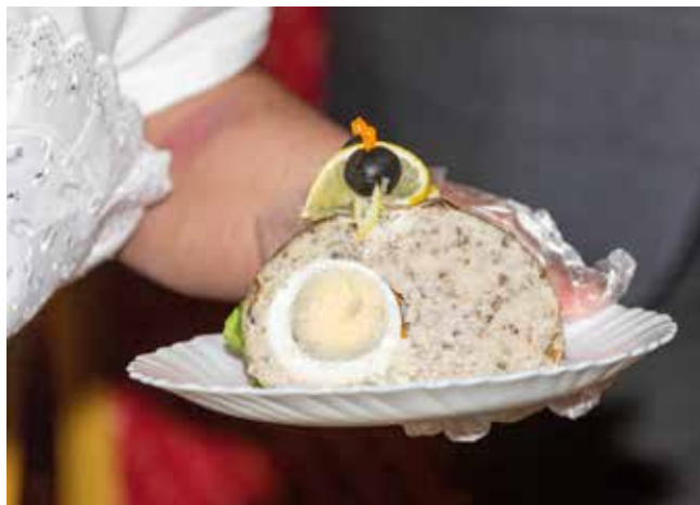
Расскажи об оригинальном рецепте — и камазовские повара приготовят его на обед

При отборе заявок будут учитываться соответствие номинации, название блю-