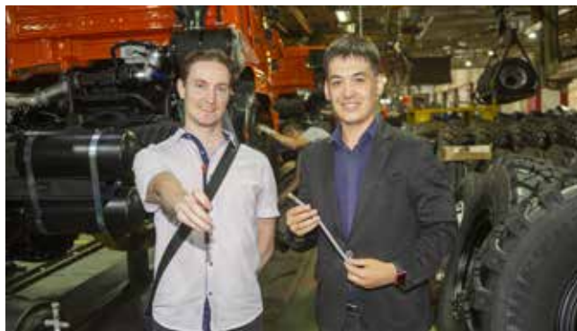
Экономический эффект от внедрения инженерами-конструкторами НТЦ пластиковых удлинителей вентилей на автомобилях КАМАЗ-65115 и 4308 составил более двух миллионов рублей в год

На «КАМАЗе» заинтересованы в развитии молодёжных