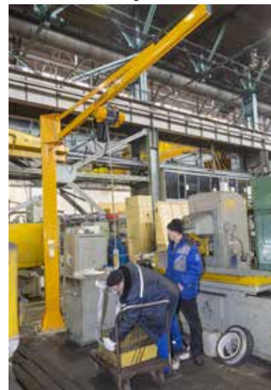
Облегчение тяжёлого физического труда на производстве — основная задача. Один из примеров — установка кран-балки для переноса деталей с большим весом

— В условиях, когда на рынке труда наблюдается значительный дефицит кадров, одним из методов снижения потребности в найме стала работа по универсализации персонала. Порядка 2000 специалистов прошли программу обучения второй профессии, в итоге на 40% возросла их производительность и повысилась зарплата. По итогам