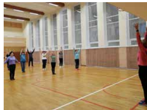
Проводить разгрузочные пятиминутки учат на занятиях в клинике-санатории