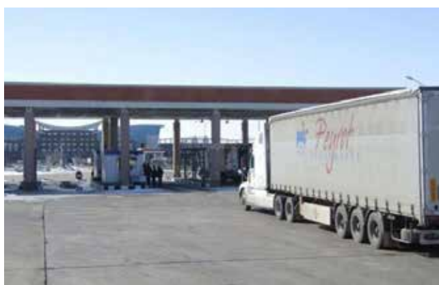
Забайкальский МАПП возобновил работу

Вместе с открытием границы Китай отменил и требование «обратной перцепции». Этот режим означал, что для получения импортного груза водитель российского перевозчика должен был оставить свой прицеп на территории КНР и ждать, пока он будет загружен поставщиком. После водитель возвращался на границу за прицепом, что пагубно сказывалось на оперативности и объёме поставок, тормозя потоки в обе стороны. Как