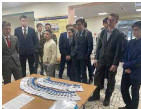
Выбор будущего места работы — дело серьёзное

Специалисты отделов по работе с персоналом автомобильного, прессово-рамного, литейного и ремонтно-инструментального заводов, 33ЧИК рассказали будущим выпускникам о перспективах работы в подразделениях компании. Молодых людей интересовали размер заработной платы, возможности повышения квалификации, освоения новой профессии. Многие из них заполнили анкеты для прохождения производственной практики, а значит, скоро на «КАМАЗ» прибудет молодое пополнение.