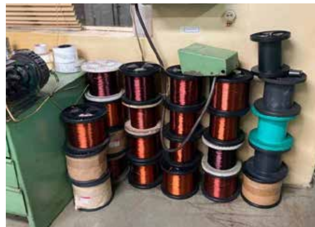
Бесхозными эти катушки больше не считаются

На площадке цеха рам ПРЗ внимание проверяющих привлекли ящики, заваленные бытовым мусором. Под отходами обнаружили 12 кронштейнов и 21 накладку. Новые изделия лежали на дне, аккуратно упакованные в бумагу. Начальник производства пояснил, что детали за цехом не числятся, поскольку изначально были получены без документов. Найденное было передано на ответственное хранение мастеру цеха рам.