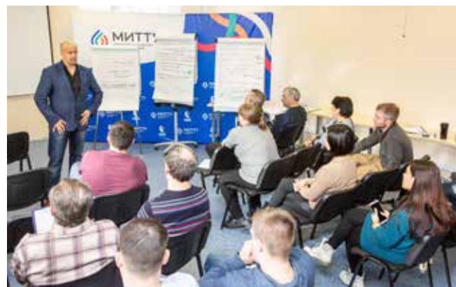
Число обученных по теме «Бездефектное производство через принцип «3 НЕ» по сравнению с 2021 годом увеличилось на 70%

Ещё мы должны достичь уровня удовлетворённости потребителя работой дилерского центра в момент приобретения автомобиля не менее 95%, а работой сервисных центров по автомобилям поколений К3 и К5 — не менее 90%.