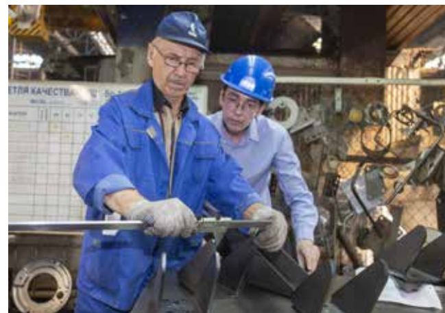
Если каждый работник обеспечит качество на своём месте, целевые задачи мы выполним

— За 11 месяцев 2022 года достигнуты хорошие результаты относительно уровня 2021 года. Например, средний уровень удовлетворённости потребителей работой дилерского центра в момент приобретения автомобиля возрос на 4,3%, а сервисным центром — на 1,2%. Коэффициент дефектности (АРА) снизился на 29,1%, а что касается автомобилей поколения К5 — на 41,8%. Количество дефектов на автомобиль (DPV) снизилось на 16,8%, по К5 — на 26,8%. Но остаются и проблемные зоны, в частности, не выполнен показатель