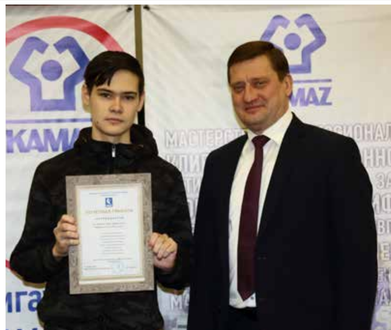
Грамоты студентам вручил сам директор завода

После насыщенной торжественной части собравшимся гостям праздника предстояло хорошенько «пошевелить мозгами»: студенчество — пора такая, без учёбы или проверки знаний обходится редкий день... Впрочем,