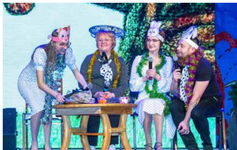
«Татарский Винни-Пух» — визитка команды