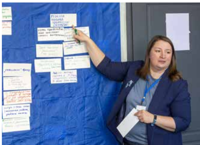
С целями и показателями поможет определиться модератор