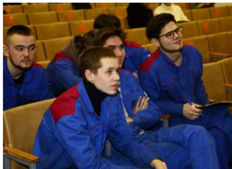
Вопросы о «движках» лёгкими не были, но студенты справились

Практику на производстве «движков» в 2022 году прошли больше 500 человек.