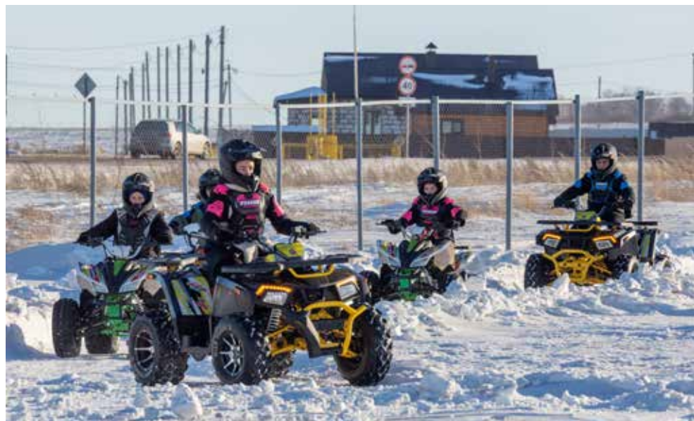
Пять кругов на квадроцикле — хороший старт для начинающих

В департаменте финансов намерены продолжить общекомандные встречи. На очереди тренинги по тайм-менеджменту и навыкам презентации.