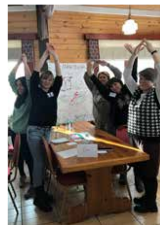
На тренинге для взаимодействия используется язык жестов

А ещё все участники тренинга построили город своей мечты. В нём нашлось место для парков и скверов, садов, спортивных площадок, комфортного жилья и даже планетария! Своей работой архитекторы остались довольны. Осталось воплотить мечты в жизнь и вместе с коллегами стре-