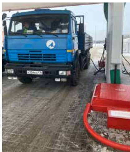
Пока идёт заправка «КАМАЗа», в автоматическом режиме формируются все необходимые для отчёта документы

В первом квартале этого года в ДТЛ начинается освоение терминала считывания данных. На складах теперь не надо будет вручную оформлять накладные — новый инструмент фиксирует и приход,