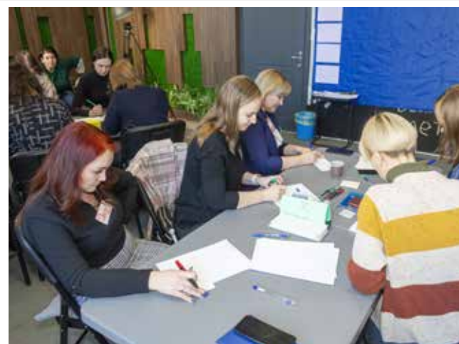
Участникам сессии есть над чем подумать — из их идей должна сложиться новая концепция работы с учениками школ и студентами

Следующий этап — описание эффектов, которые рассчитывает получить компания в результате профориентационных мероприятий, располагал к размышлениям. В первую очередь, это, конечно же, продвижение бренда «КАМАЗ», интерес к нему, появление амбассадоров, которые будут репостить статьи о компании в соцсетях, и как итог — трудоустройство в одно из её подразделений. Но как можно этого добиться? Вариантов было