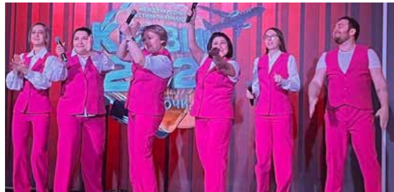
Одежда в горошек стала объединяющим элементом ещё в апреле 2022 года, но удачу на «КиВиНе» принёс розовый