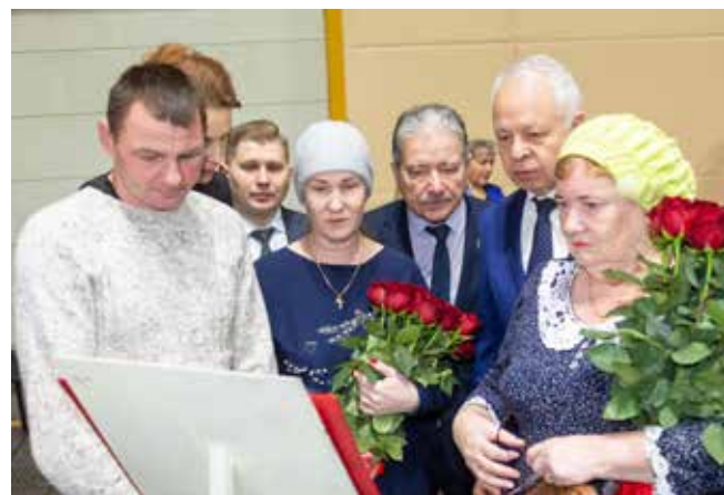
На открытии мемориальной доски присутствовали родные и близкие погибшего бойца

Подготовила Эльвира Галлямова. Фото Виталия Зудина