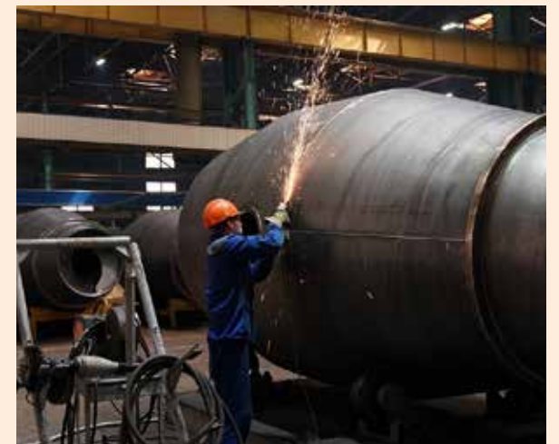
Выросшие объёмы производства потребовали и новой рабочей силы

Эти мероприятия, в свою очередь, способствовали значительному увеличению производственного персонала и созданию новых рабочих мест. В общей сложности в 2021–2022 годах на Туймазинском заводе автобетоновозов создано более 300 новых рабочих мест.