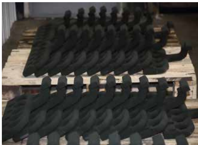
Партия стержней печатается за 18 часов