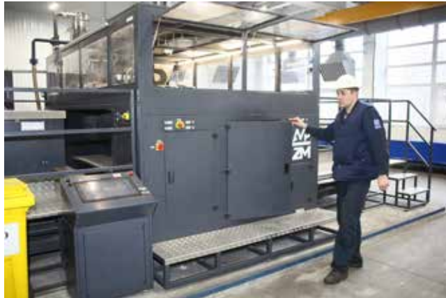
Брак и погрешности на новом 3D-принтере минимальны

Новое оборудование уже показывает отличные результаты. Брак и погрешности минимальны, а по времени производства литейщики выигрывают.