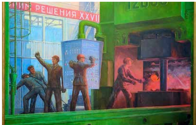
Картина «Кузнецы», 1986 г.