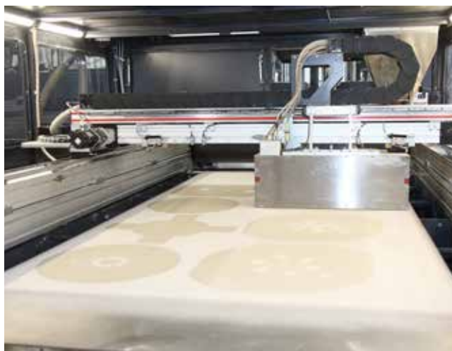
Очертания будущих стержней уже проявились