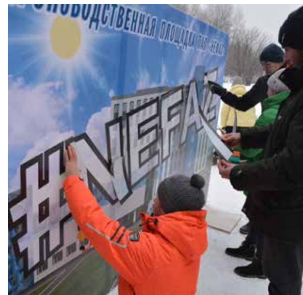
Так образуется команда

Результатами слёта остались довольны и организаторы, и сами участники. Молодёжь знает, что её заводской жизнью интересуется руководство, а руководство убедились в том, какие активные и деятельные у них специалисты. С такими далеко пойдём!