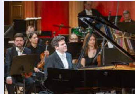
Маэстро Мацуеву двери челнинского Органного зала всегда открыты

47-й годовщине выпуска первого «КАМАЗа» в этом году будет посвящено сразу два торжества. Возможность разделить радость этого события будет и у работников автомобильного завода, и у сотрудников всех подразделений компании.