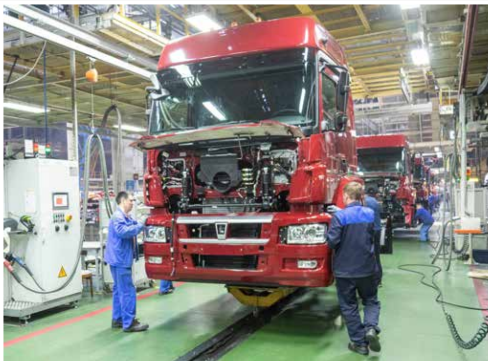
47 лет назад был запущен главный конвейер «КАМАЗа». Он успешно работает и сегодня

Хорошим подспорьем для контроля качества сборки должна стать система MES. Пока она работает в тестовом режиме, полномасштабный запуск пришлось перенести из-за изменения архитектуры антисанкционного флага К5. Сейчас идёт подготовка новых электронных техпроцессов, которые будут загружаться в систему. Благодаря внедрению MES мы уже сейчас обеспечиваем рабочих актуальными визуальными электронными инструкциями на терминалах на каждом рабочем месте под сборку конкретного автомобиля. Появляется возможность моментальной регистрации информации о дефектах по сборочному процессу, бло-