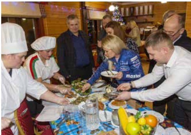
Рецепты для обновления меню собрали. Следующим этапом будет приготовление и дегустация блюд

Все заявки переданы специалистам iFCM group. Они оценят соответствие блюда номинации, благозвучность его названия, лёгкость и быстроту приготовления, стоимость и оригинальность. В следующий этап конкурса пройдут лишь 50 блюд, а итоги этого отборочного тура будут подведены в марте.