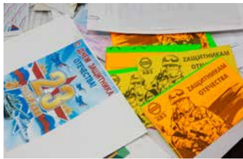
За 10 дней в профком поступило порядка 2000 писем для солдат

Акция «Восточка надежды», инициированная администрацией и профсоюзом «КАМАЗа» и проведённая в канун Нового года, получила своё продолжение. Сбор писем от детей камазовцев, адресованных российскому солдату, был объявлен в конце января. Буквально за 10 дней поступило по-