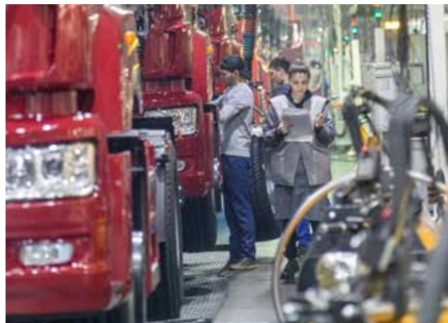
Заводская семья АвЗ — работающая и очень дисциплинированная

Хочется пожелать всем причастным к рождению автомобиля здоровья, каждой заводской семье — благополучия. Спасибо за терпение и понимание ситуации всем, кто продолжает трудиться в непростых условиях! Постараемся сохранить заводские традиции, чтобы каждый чувствовал себя на своём рабочем месте комфортно и был уверен, что любой коллега и руководитель готов подставить плечо, помочь, поддержать.