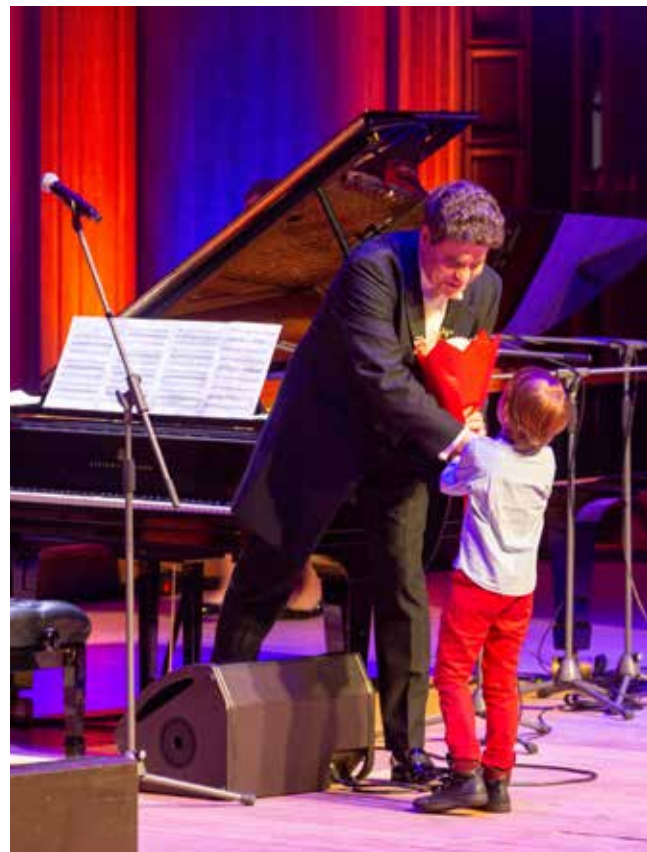
В Челнах подрастает новое поколение ценителей классической музыки

— А я благодарю публику и уверен, что каждый музыкант, сегодня выходящий на эту сцену, получил огромное удовольствие от диалога с вами. Желаю вам почаще дышать настоящим искусством, потому что оно обладает огромным терапевтическим эффектом. Надеюсь, мы с вами ещё неоднократно увидимся, — попрощался маэстро.