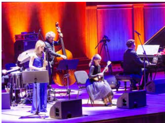
Импровизация — это спонтанность и ощущение праздника