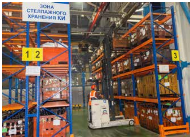
Задание на склад формируется в автоматическом режиме, а там заявки выполняются оперативно

низованных по уровню планирования: межзаводское, внутрицеховое и синхронизация процессов изготовления узлов и деталей в цехах заводов. Выяснилось, что у специалистов, планирующих поставку комплектующих на разных заводах, разный уро-