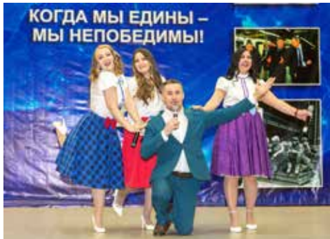
Этой встрече рады и исполнители, и зрители!