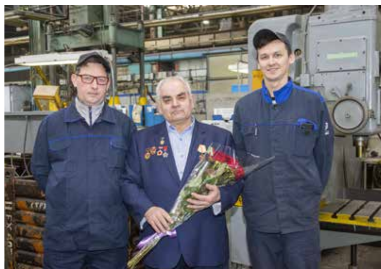
Передать опыт литейщикам XXI века — дело для Мазура крайне важное