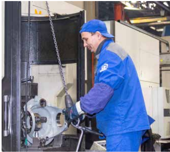
Цех картеров работает ритмично уже более полугода

Унификацию процессов обсуждали в группах, орга-