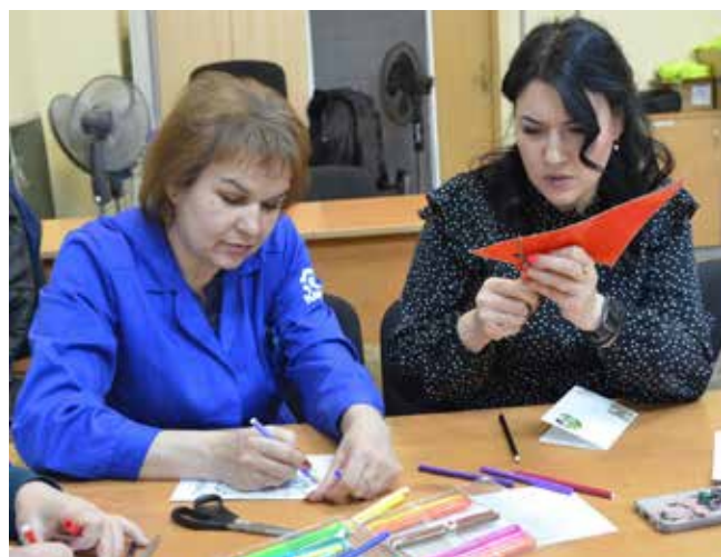
Порадовать близких подарком в стиле хэндмейд может каждый

Впереди два праздника: День защитника Отечества и Международный женский день, и желающие смастерить открытку своими руками подтянулись в обеденный перерыв в учебный класс АБК-211. За импро-