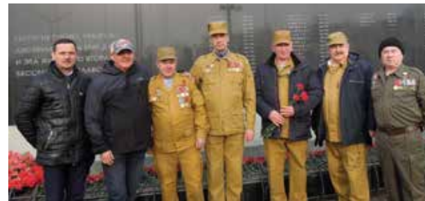
15 февраля для этих людей — день особый

Совет ветеранов боевых действий ЗД выражает благодарность за оказанную поддержку и материальную помощь администрации и профкому предприятия.