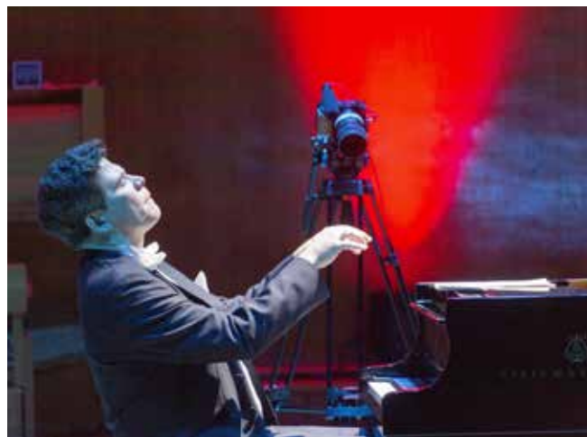
У рояля — виртуоз Денис Мацуев

«Денис Мацуев и его команда, мастера искусств, дали камазовцам своего рода мастер-класс: так владеть инструментом! Каждому бы. На своём рабочем месте!»