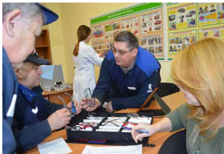
Выбор оправы — важный этап при заказе очков

Уже в марте все участвующие в пилотном проекте смогут оценить преимущества работы в новых защитных очках.