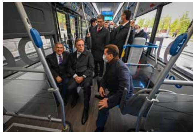
2021 год. Глава Татарстана Рустам Минниханов лично тестировал первый в Казани электробус КАМАЗ