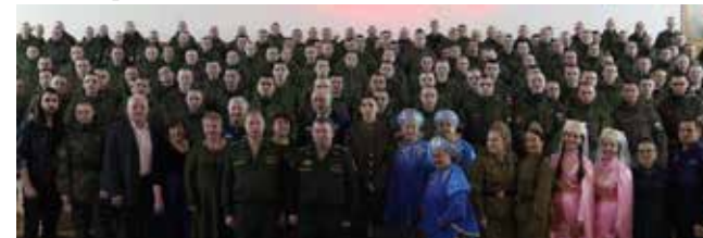
И гости, и хозяева остались довольны встречей

Зрители горячо приветствовали и долго не хотели отпускать артистов. Каждый номер солдаты встречали дружными, бурными аплодисментами и громкими криками «Браво!».