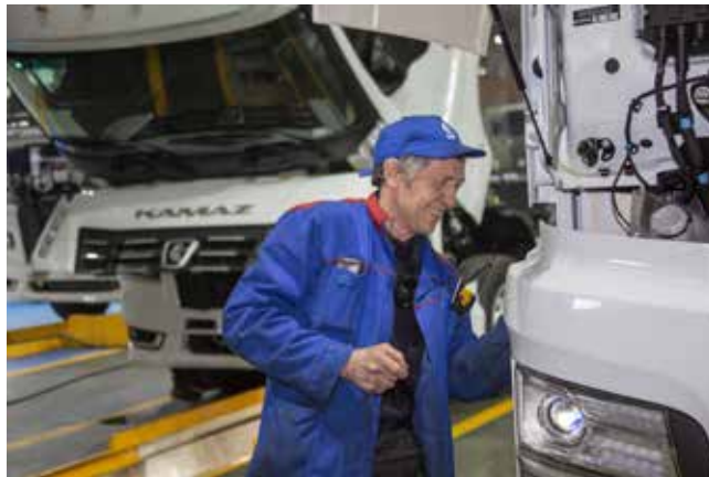
Одно из достижений прошлого года — стабильная работа компании