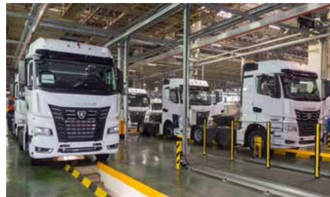
«КАМАЗ» не только возобновил выпуск К5, но и улучшил его потребительские свойства

запланировано создание отечественного цифрового электрокара, призванного изменить образ городской мобильности будущего. Прототип будет создан к маю 2023 года.