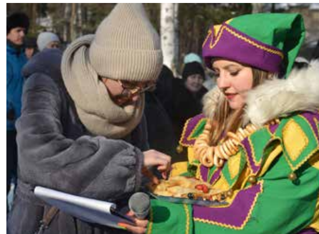
Хороши блины на АвЗ!

бросали кольца, поднимали гири, дружно тянули канат командами. В конкурсе «Народные таланты» дети с удовольствием рассказывали стихи, пели песни, танцевали. Впервые на этом празднике были организованы конкурсы блинов и костюмов «Эх, Масленица-красавица!». За участие и победы все были