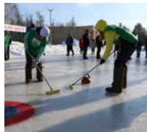
В кёрлинг сыграли впервые

Завершился фестиваль празднованием Масленицы: и зиму достойно проводили, и гостей в дорогу отправили сытыми и довольными.