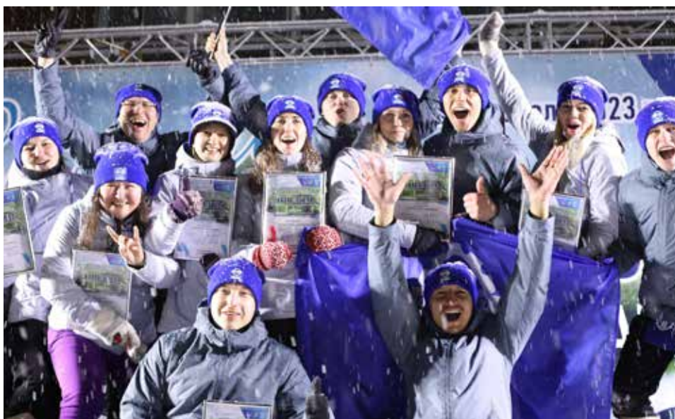
Камазовцы стали победителями фестиваля