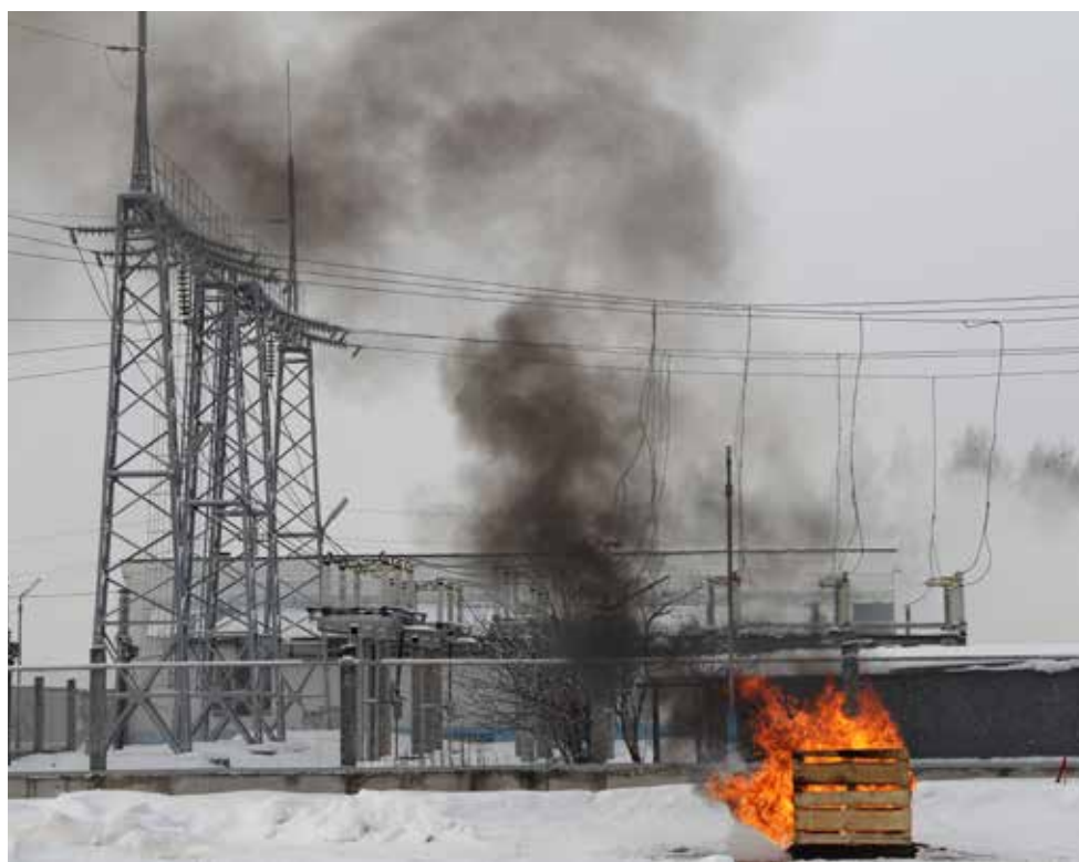
Пусть эта картина останется лишь сценарием учений