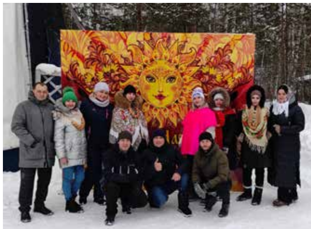
База «Литейщик» приняла сразу пять камазовских подразделений

24 февраля эстафету подхватил автомобильный завод. Работники с семьями отправились на базу отдыха «Иволга», чтобы проводить зиму и поприветствовать красавицу весну. Праздник получился вкусным — блинами здесь угощали всех под звонкие переливы гармонии, а ещё задорным и весёлым! На театральном представле-