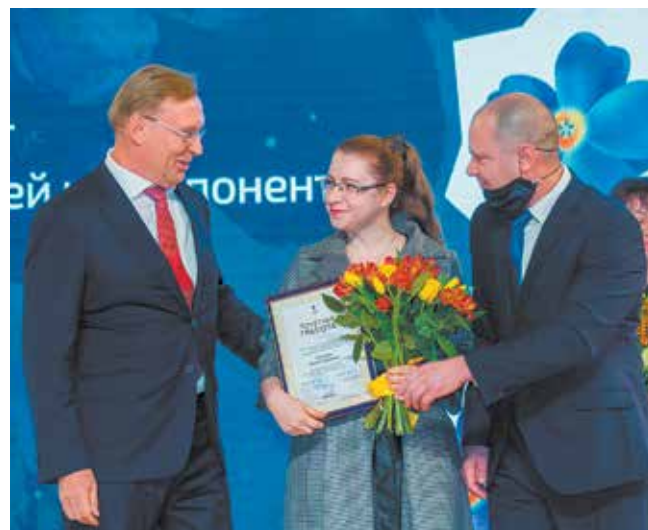
Первые лица компании для всех дам находят и улыбку, и тёплые слова

Напомнила, что в прошлом году Госдумой был принят закон в поддержку машиностроительной отрасли, который позволит поддерживать занятость, в том числе и на «КАМАЗе», и о законах поддержки семей с детьми.