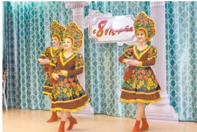
Хореографические постановки театра танца «Фьюжн» — главное украшение праздников на литейном заводе

о любви на русском и татарском языках, шоу песочной анимации.