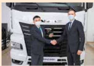
Пусть сотрудничество будет долгим!

Торжественное вручение ключей от автомобилей КАМАЗ-5490 и 54901 АО «Казпочта» состоялось в Акмолинском автоцентре «КАМАЗ». Грузовики были переданы с двумя шторными прицепами.