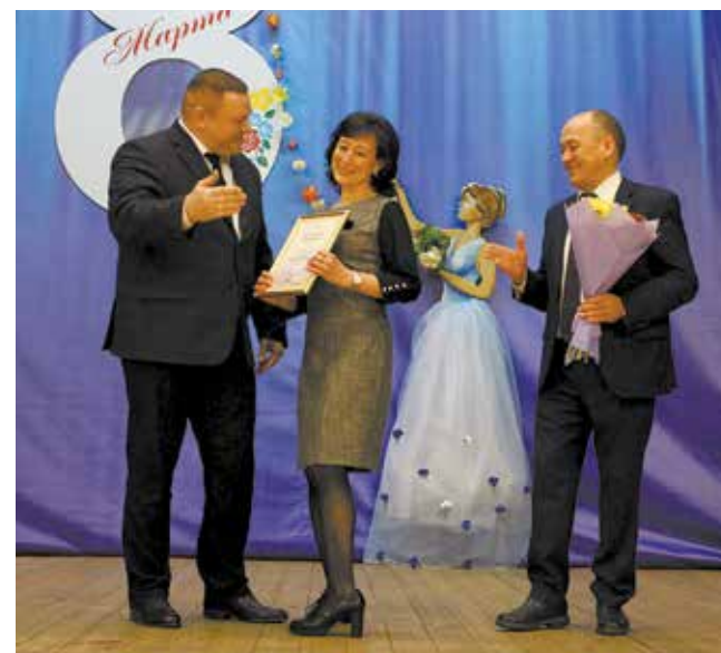
Во время церемонии награждения, приуроченной к этому празднику, царит особое настроение

Что до расследования, то его провели сами мужчины по сценарию, созданному режиссёром Нафисой Ибрагимовой. Они вспомнили, что год назад решили организовать концерт к 8 Марта своими силами, но задумку до конца не довели и решили махнуть на рыбалку. И в итоге были лишены рыбалки, охоты, футбола и гонок. Целый год сидели дома с женами и детьми, смотрели бесконечные сериалы, делали покупки по интернету, обща-