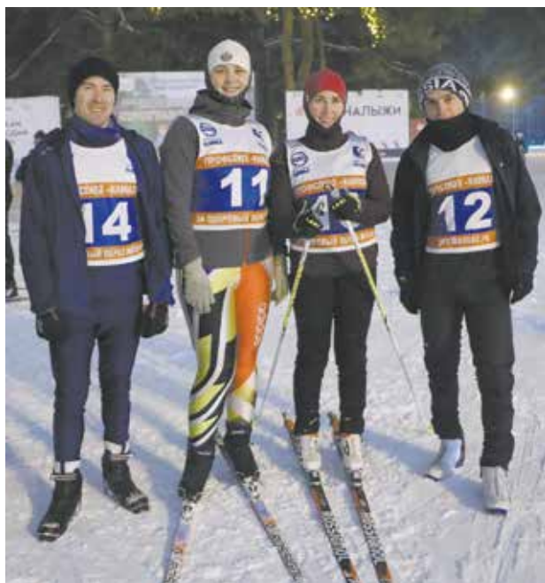
Сборная НТЦ выиграла вторую подряд лыжную гонку

Расслабляться камазовским спортсменам рановато, ведь уже 13 марта пройдёт первенство по биатлону.