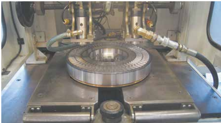
Заполнение гасителей силиконом

выполняет перманентное сварочное соединение комплектующих в диапазоне 360 градусов. Все этапы сварки сопровождаются стопроцентным контролем качества сварных швов и свободного вращения маховика. Со станции деталь перемещается на установку для заполнения силиконом, где автоматически проводится стопроцентная проверка на герметичность, замеряется объём, рассчитывается и заливается необходимое количество силикона. После этого в отверстия для заполнения привариваются пробки, деталь маркируется и упаковывается.