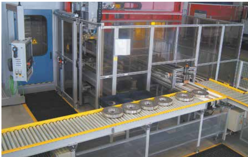
Новая линия сборки вязкостных гасителей крутильных колебаний для коленвалов двигателей Р6

В составе линии действует установка лазерной сварки немецкого производителя Arnold Maschinenfabrik GmbH мощностью 6 кВт — единственная подобная в России. Внутри сварочной станции подсобранная деталь помещается манипулятором на опору и перемещается в позицию сварки, где фиксируется. Техника пошагово