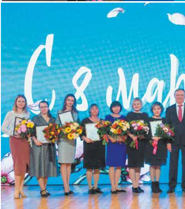
Награждение лучших сотрудниц почётными грамотами — важная часть праздничного вечера

наверное, потому, что я почти 10 лет сама работала на «КАМАЗе» и теперь почти столько же занимаюсь вопросами промышленной политики, поддержкой региональной экономики в Госдуме».