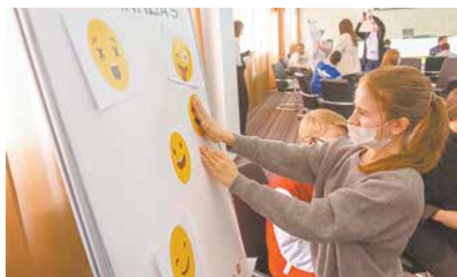
Судя по смайликам, студенты ждут от форума новых открытий

На этой неделе в ИТ-парке был дан старт сразу двум проектам: онлайн-стажировке в области цифровых технологий Digital Education и молодёжному форуму «PROФдвижение». В нём примут участие 425 студентов из Татарстана, пяти регионов России и 68 ребят, обучающихся в других странах.