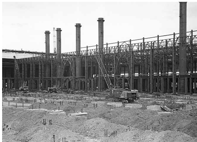
1972 год. Закладывается основа литейного производства

Перед СПТУ ЗИЛ была поставлена сверхзадача — спроектировать корпус «на голову выше» ведущих мировых чугунолитейных производств. Сенсацией того времени был завод компании «Форд» во Флэт-Роке, США,