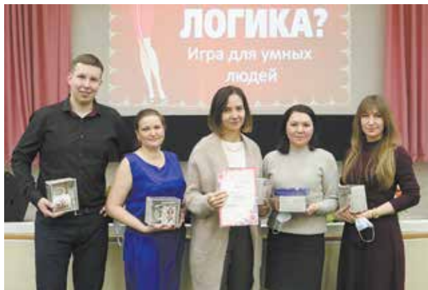
Победителям и призёрам были вручены призы

Всего в зале «Прогресс» в обеденный перерыв встретились 11 команд по пять человек в каждой. И если в спортивных соревнованиях организаторы часто ставят условием наличие среди игроков девушек, то здесь, наоборот, фору соперникам давали женские коллективы. Понятно, что шансов у участников, впервые встретившихся с такими понятиями как «омбре», «глиттер», «кафф» или «мультимаскинг», практически не было. Победу в итоге одержала команда «Импульс», второе место заняли «Нелогичные», третье — «Комета».