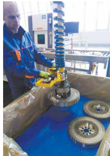
Упаковка готовой продукции

От вязкостных гасителей зависят безопасность и защита коленвалов от вибрации крутильных колебаний. Предприятие выпускает их с 2010 года, на 100% обеспечивая потребность «КАМАЗа». Все эти годы сборка велась на линии с оборудованием для лазерной сварки, заполнения силиконом, заварки пробок и маркировки продукции. На сегодня произведено уже более 540 тыс. гасителей для текущего поколения камазовских двигателей.