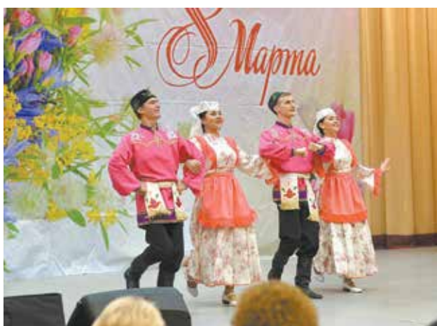
Задорная татарская плясовая любому поднимет настроение

«О женщина, божественное чудо! В глазах её огонь, в душе — пожар. Одной улыбкой пошатнёт рассудок, И для мужчин — волшебный божий дар!»