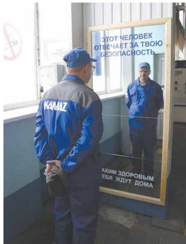
Главный человек, отвечающий за безопасность, — ты, работник. Помни о близких, которые ждут тебя дома. Береги себя!

В 2021 году планируется снизить коэффициент частоты несчастных случаев на производстве на 2% от среднего значения, достигнутого за последние пять лет. В этом поможет совершенствование системы менеджмента охраны труда, промышленной безопасности и экологического менеджмента, использование принципов и инструментов ПСК. В выявление и устранение травмоопас-